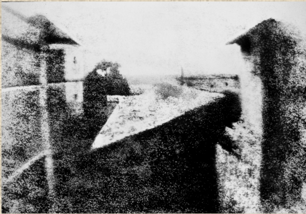
Первая в мире фотография

Первая в мире фотография представляла собой вид из окна мастерской Ньепса и была получена методом гелиографии. Экспозиция снимка продолжалась 8 часов.