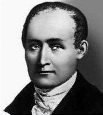
Жозеф Нисефор Ньепс

Ньепс начал свои опыты с хлоридом серебра. Поместив в камеру-обскуру бумагу, покрытую этим веществом, он получил негативные изображения, но не смог их закрепить.