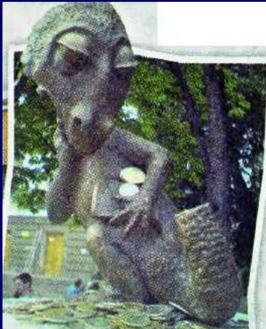
Мини- монумент студенческому хвосту в Туле.