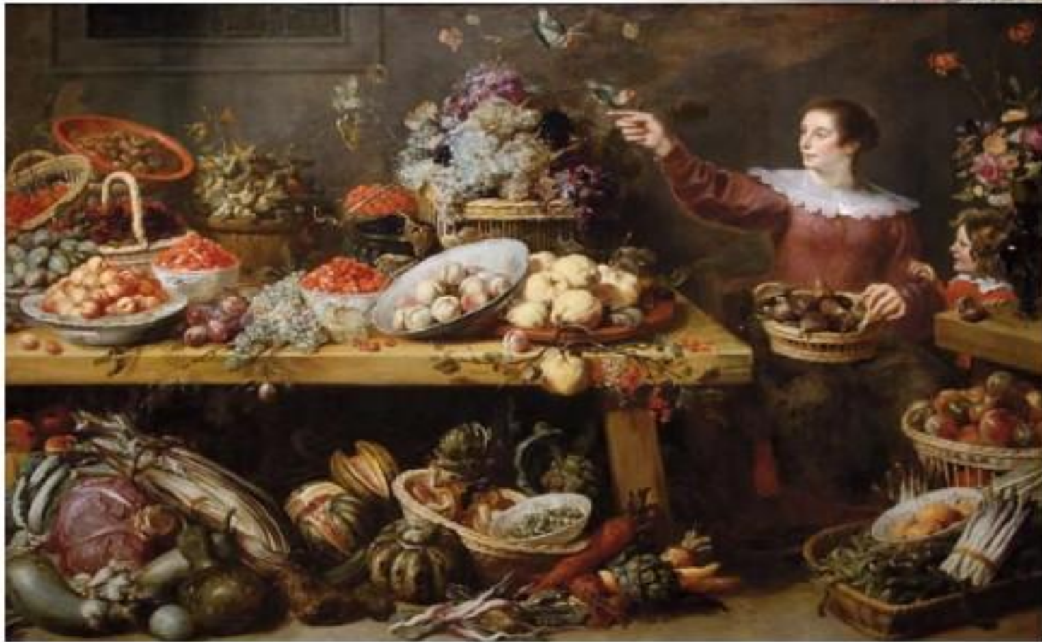
К. Снейдерс. Натюрморт с фруктами и овощами

Люди поразному воспринимали красоту и пользу окружающего мира.