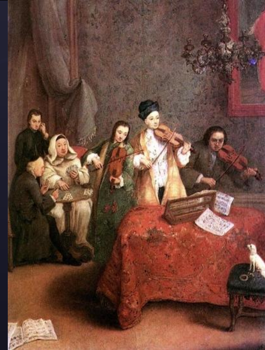
П. Лонги. Концерт.