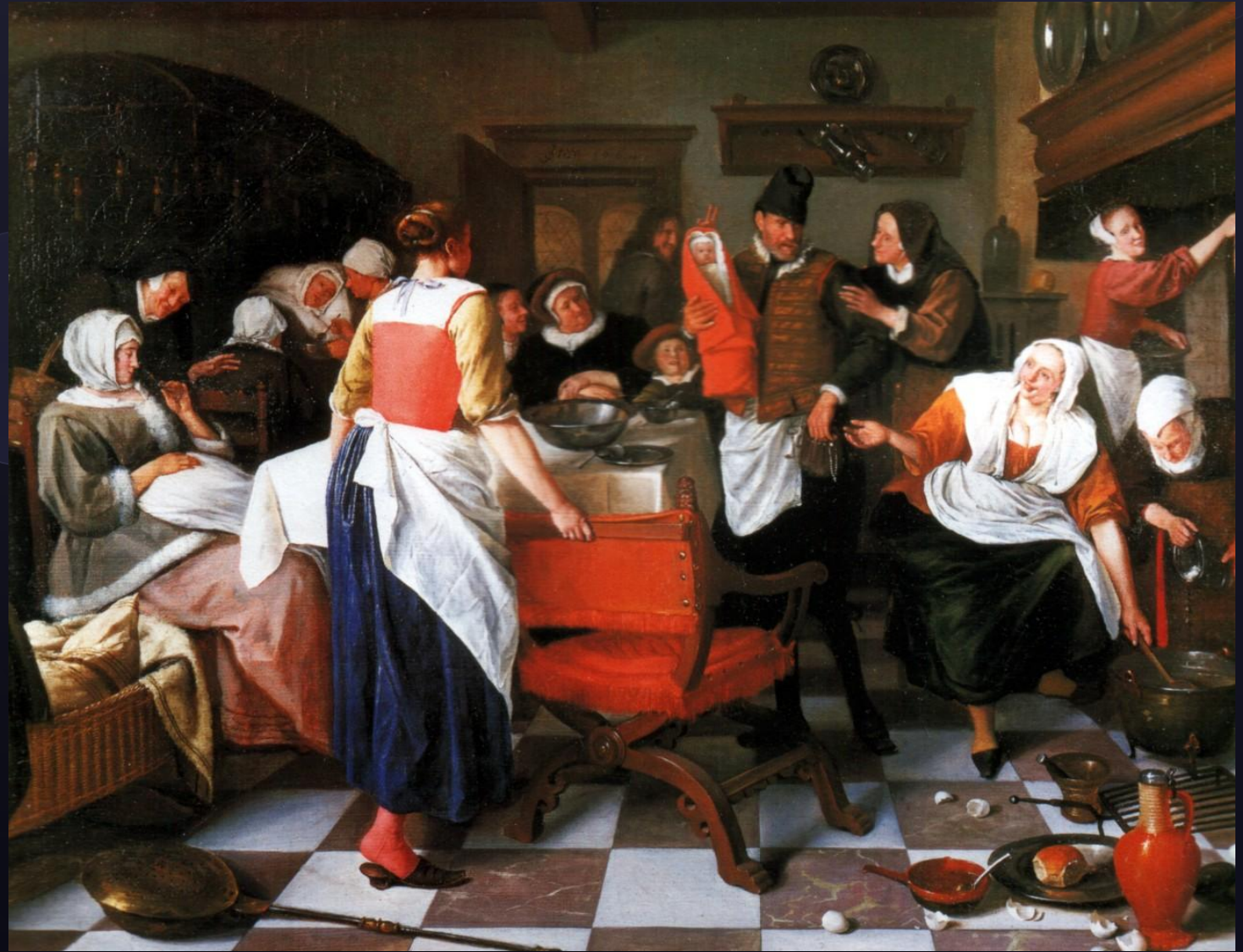
Ян Стен. Крестины.