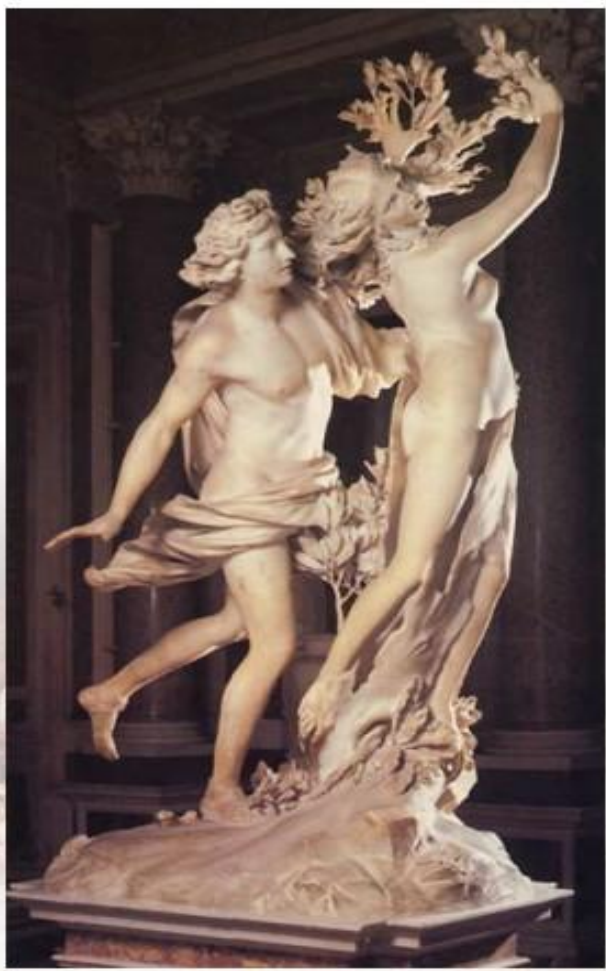
Дж. Бернини. Аполлон и Дафна