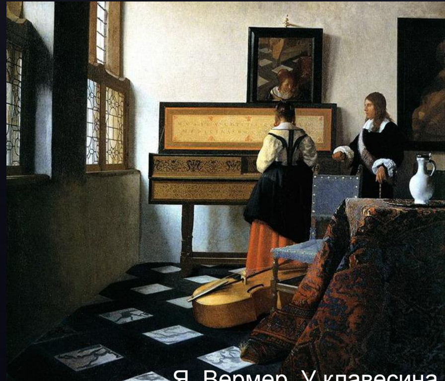
— Я. Вермер. У клавесина.