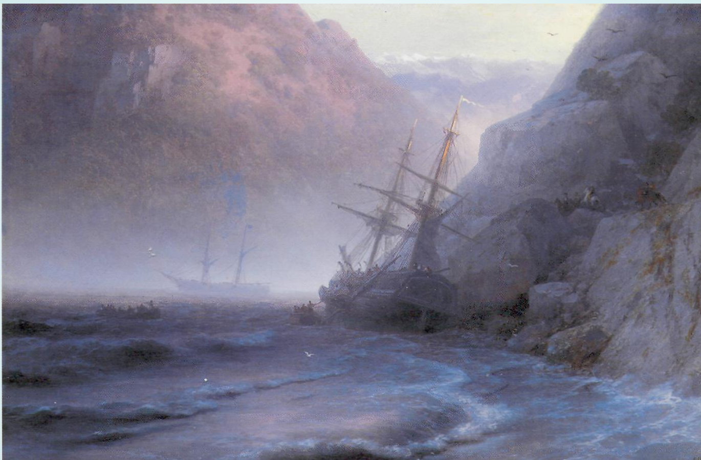
Контрабандисты 1884 год