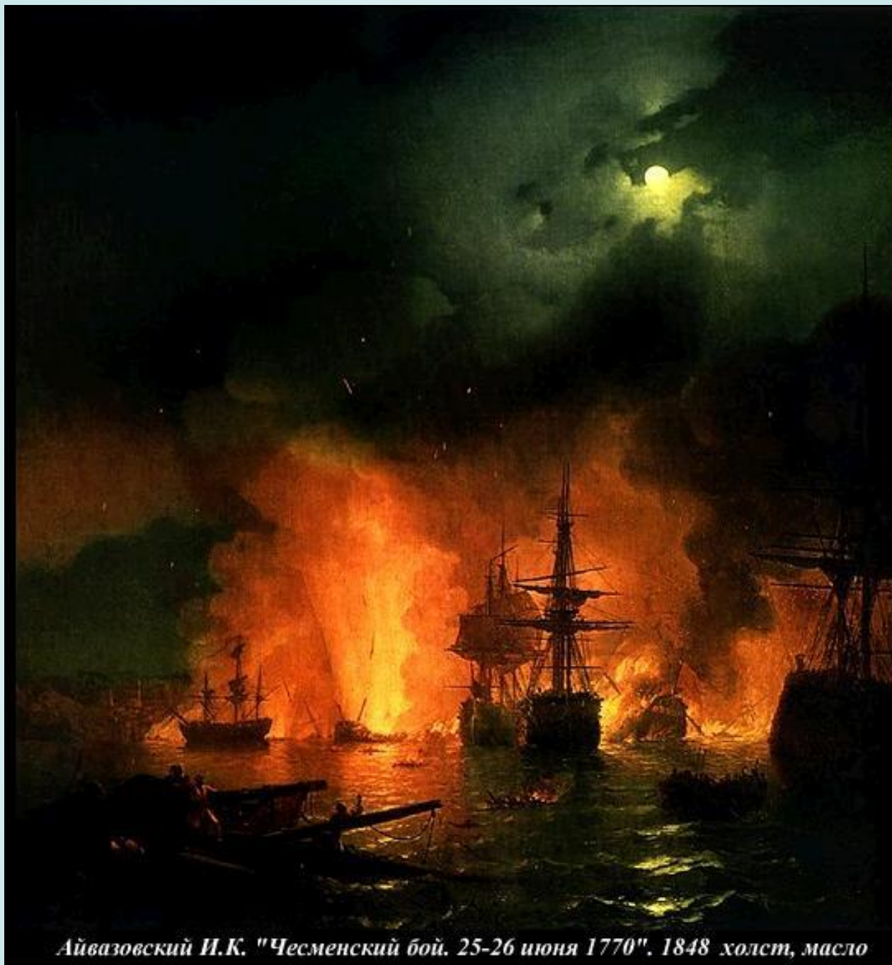
Айвазовский И.К. "Чесменский бой, 25-26 июня 1770", 1848 холст, масло