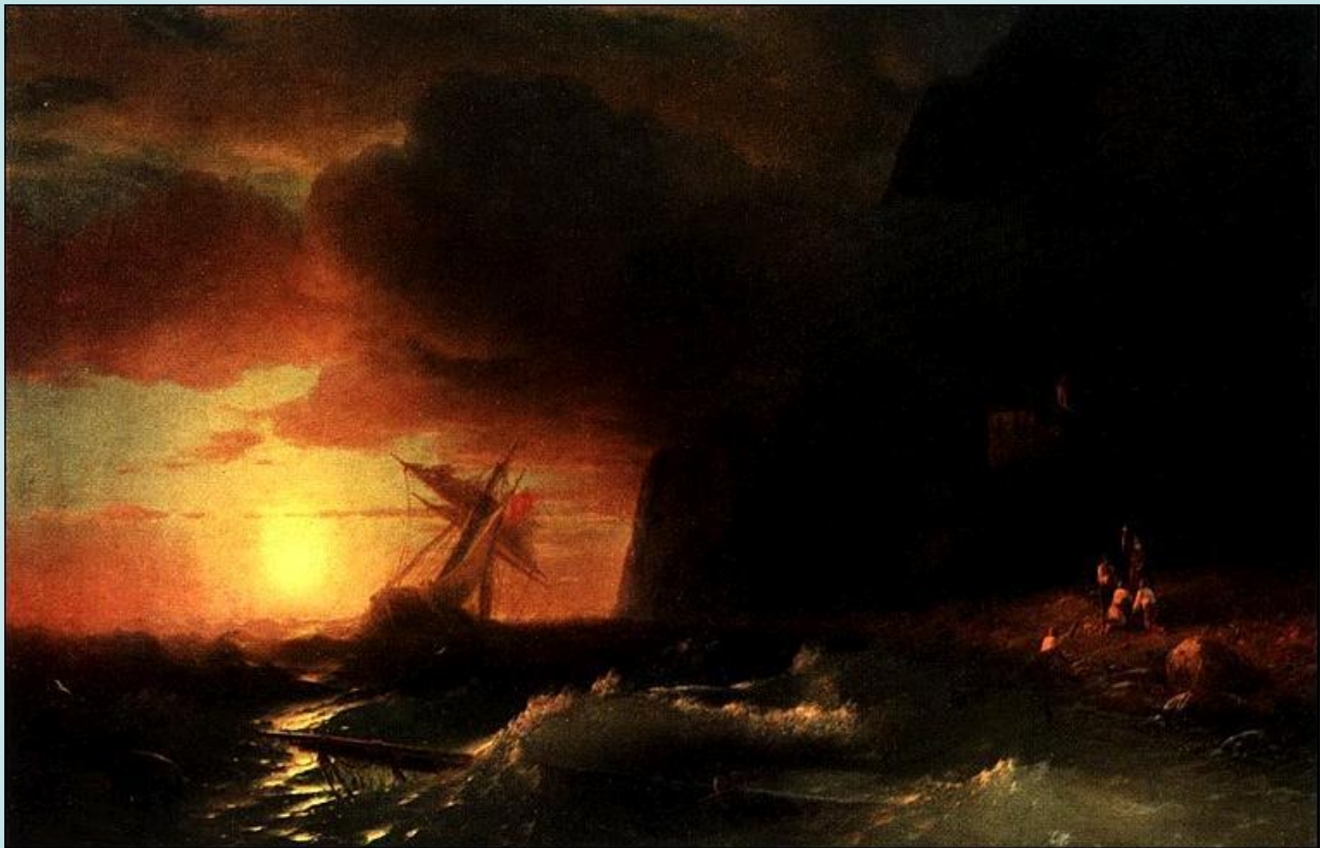
Айвазовский И.К. "Кораблекрушение у берега святой горы Афон". 1856 холст, масло