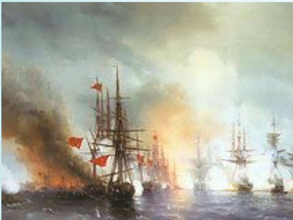
Синопский бой 1853 год