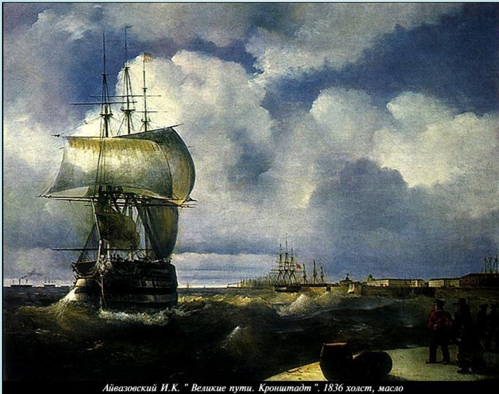
Айвазовский И.К. " Великие пути. Кронштадт ". 1836 холст, масло