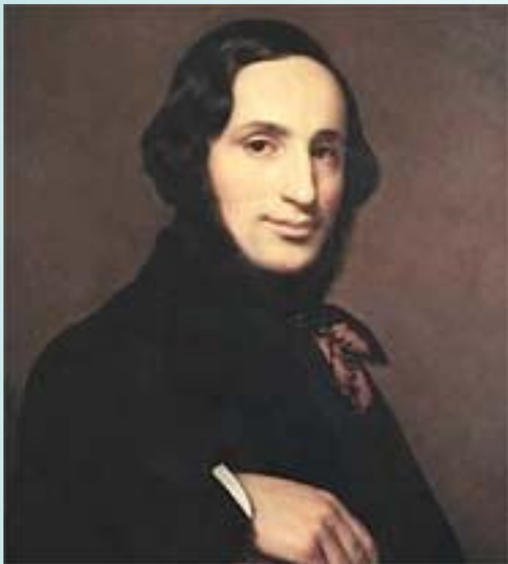
Иван Константинович Айвазовский