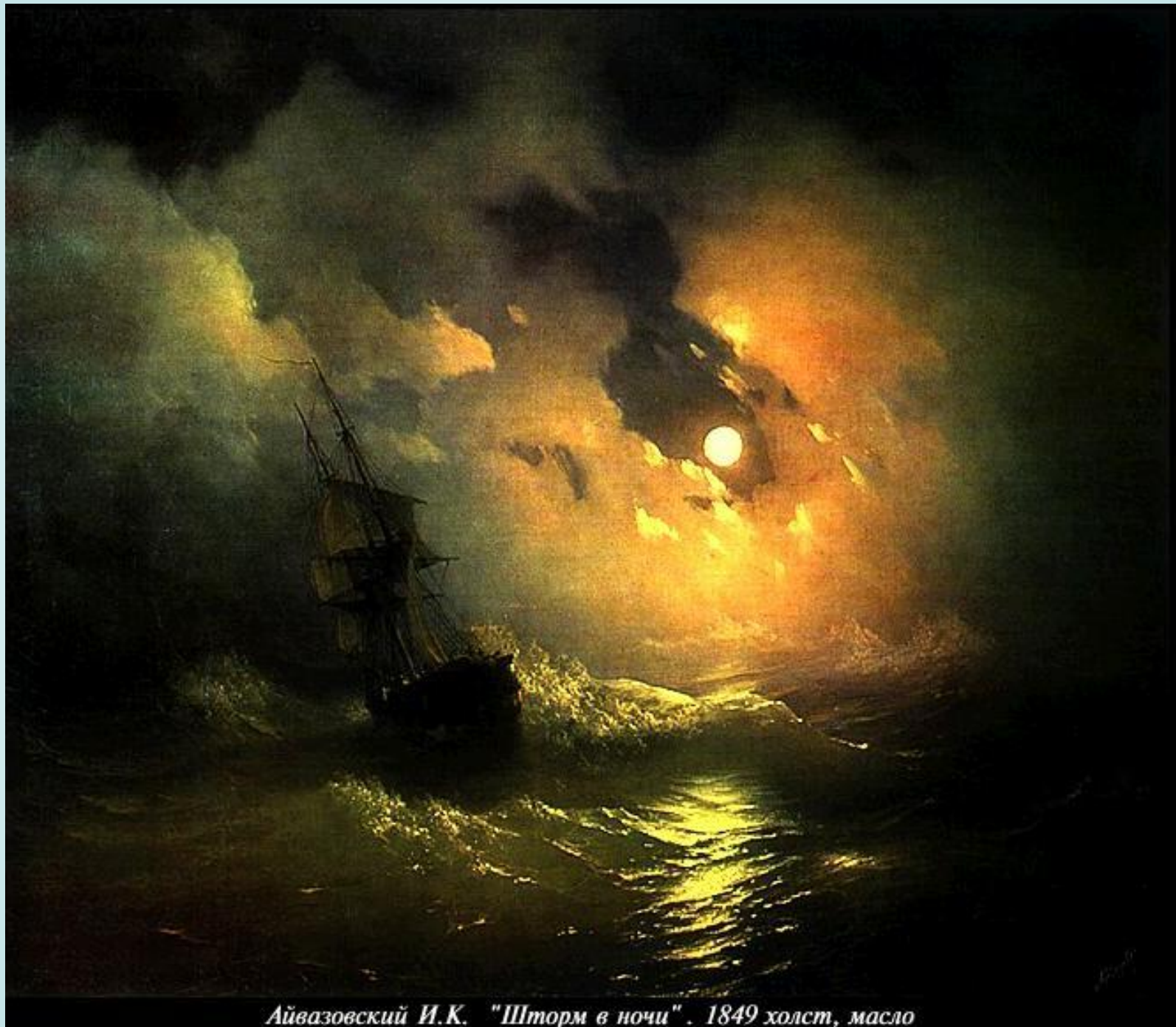
Айвазовский И.К. "Шторм в ночи". 1849 холст, масло