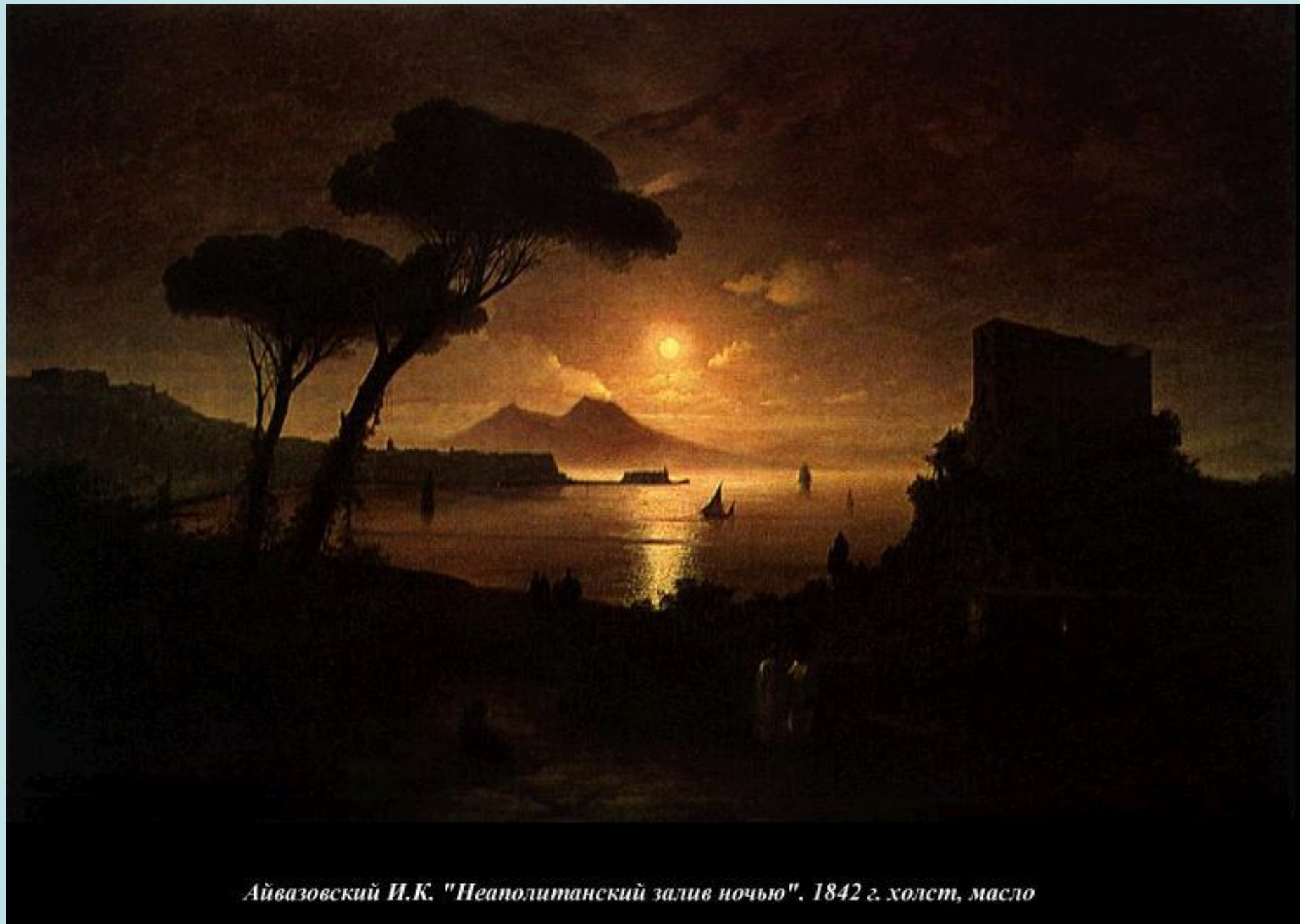
Айвазовский И.К. "Неаполитанский залив ночью". 1842 г. холст, масло