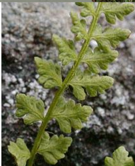
Папоротник вудсия альпийская