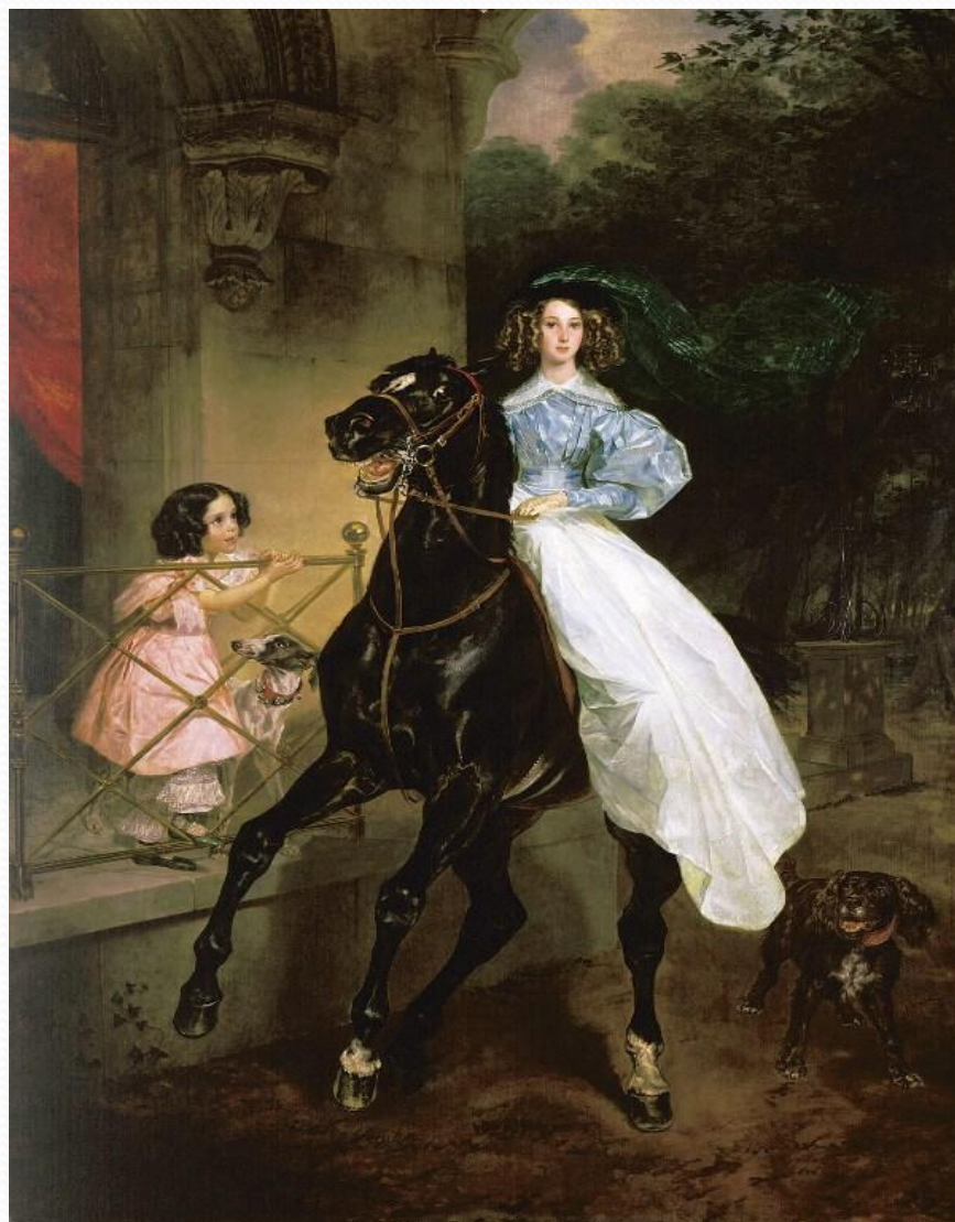
"Всадница (Дж. и А. Паччини)", 1832, Третьяковская галерея