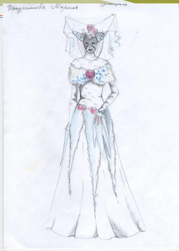
Участницы Цветочной Баталии