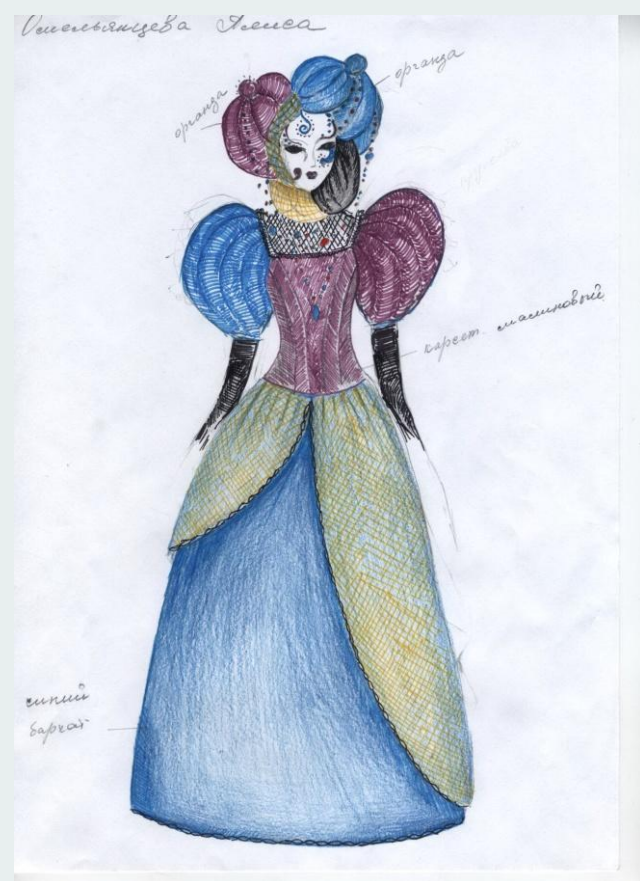
Придворная дама Короля карнавала