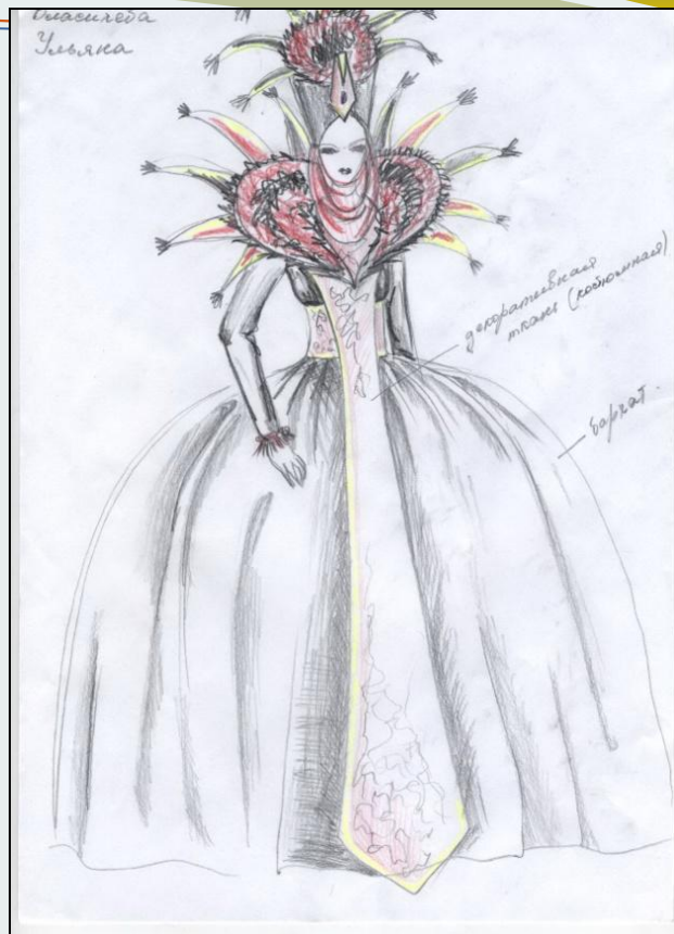
Пиковая дама или королева карт