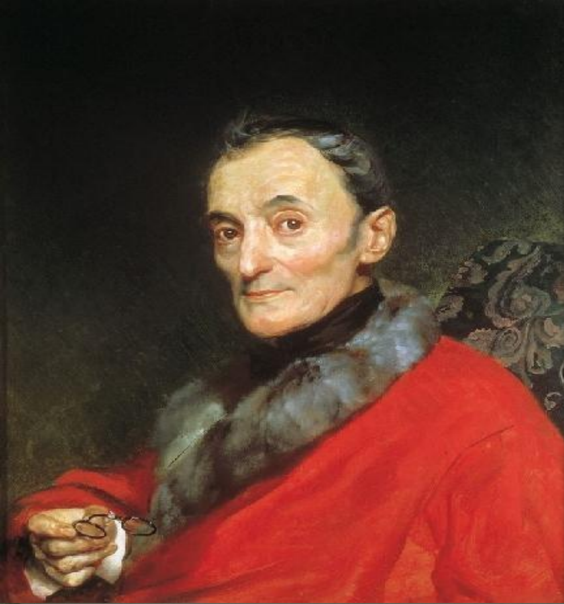
Портрет геолога Макеланджело Ланчи