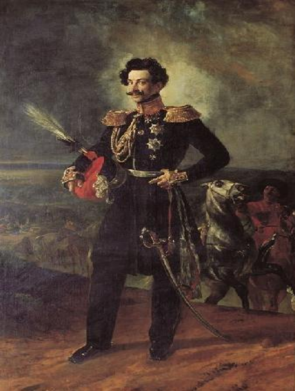
Портрет генерал-адъютанта графа В.А.Перовского