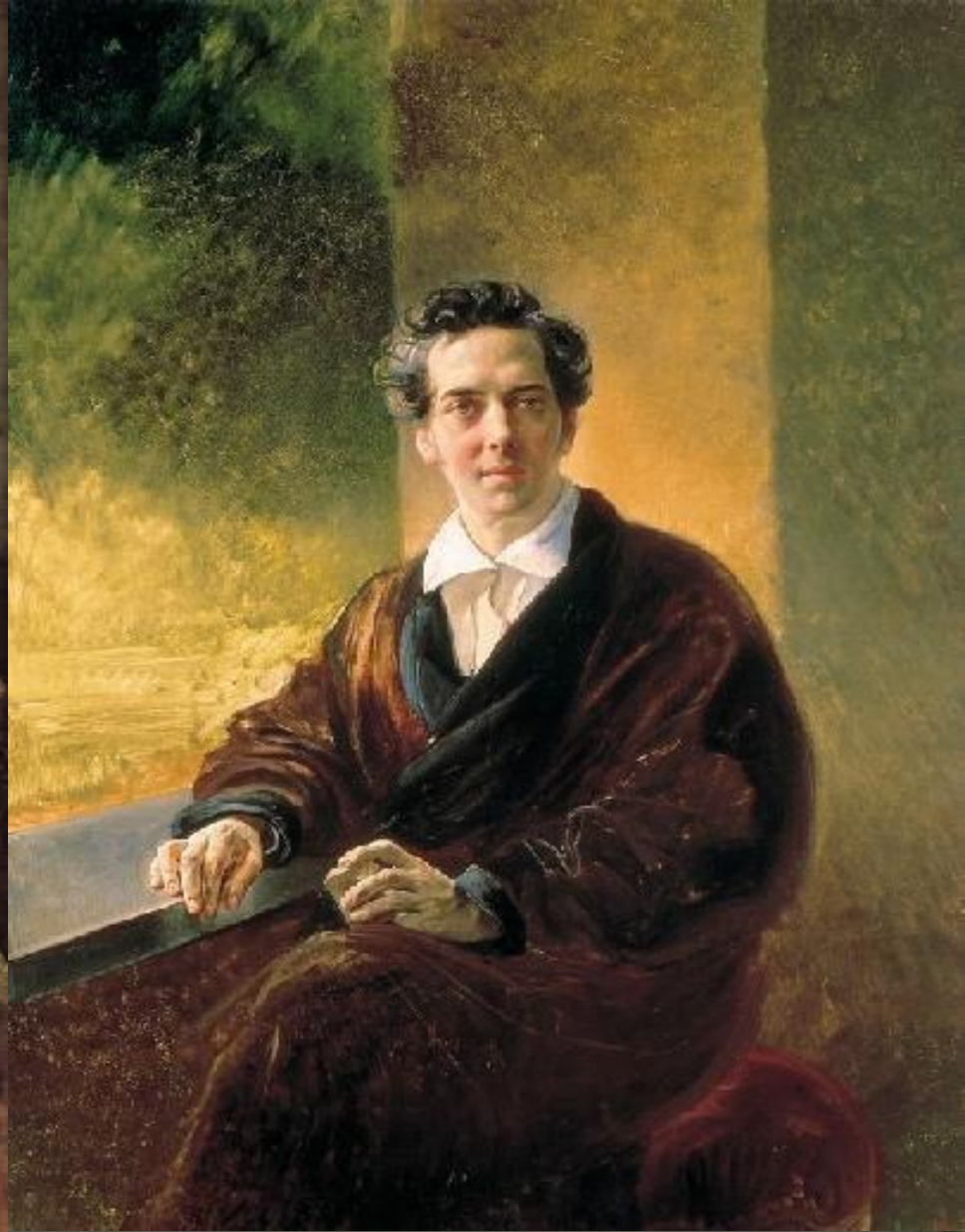
Портрет графа Алексея Алексеевича Перовского