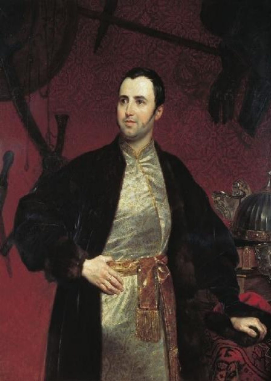
Портрет князя Оболенского