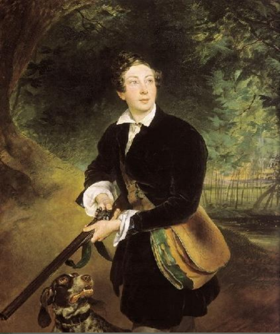
Портрет поэта и драматурга А.К.Толстого в молодости