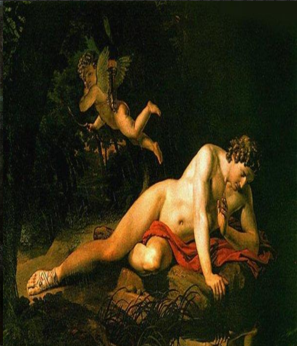
Нарцисс, смотрящий в воду