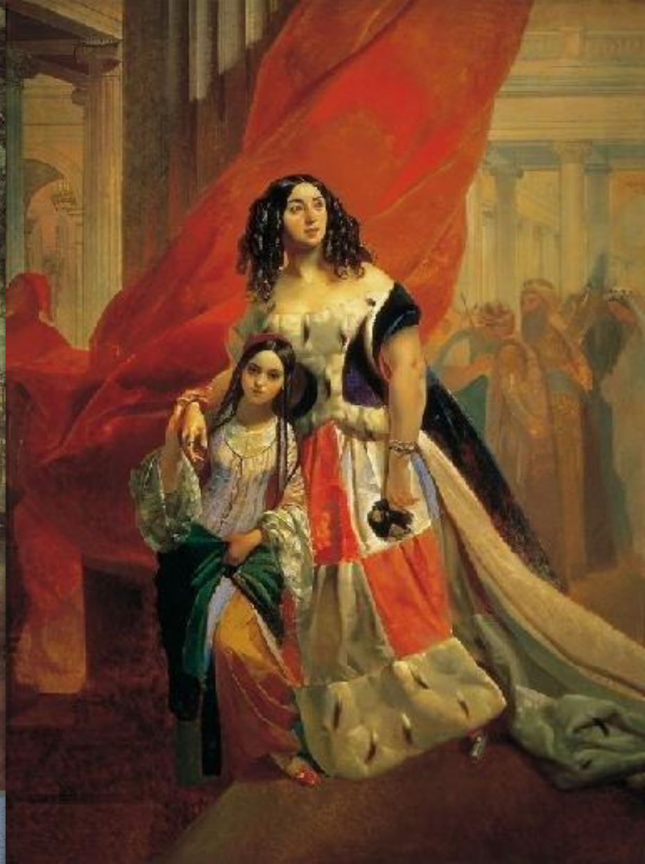
Портрет Самойловой с приёмной дочерью