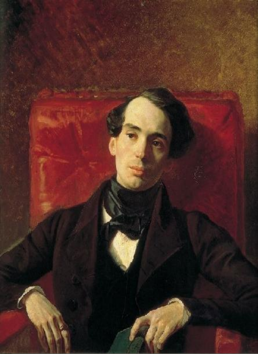
Портрет паисателя А.Н. Струговщикова