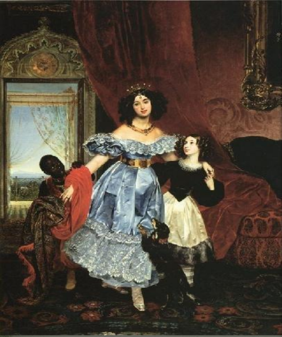
Портрет Самойловой с воспитанницей и арапчонком