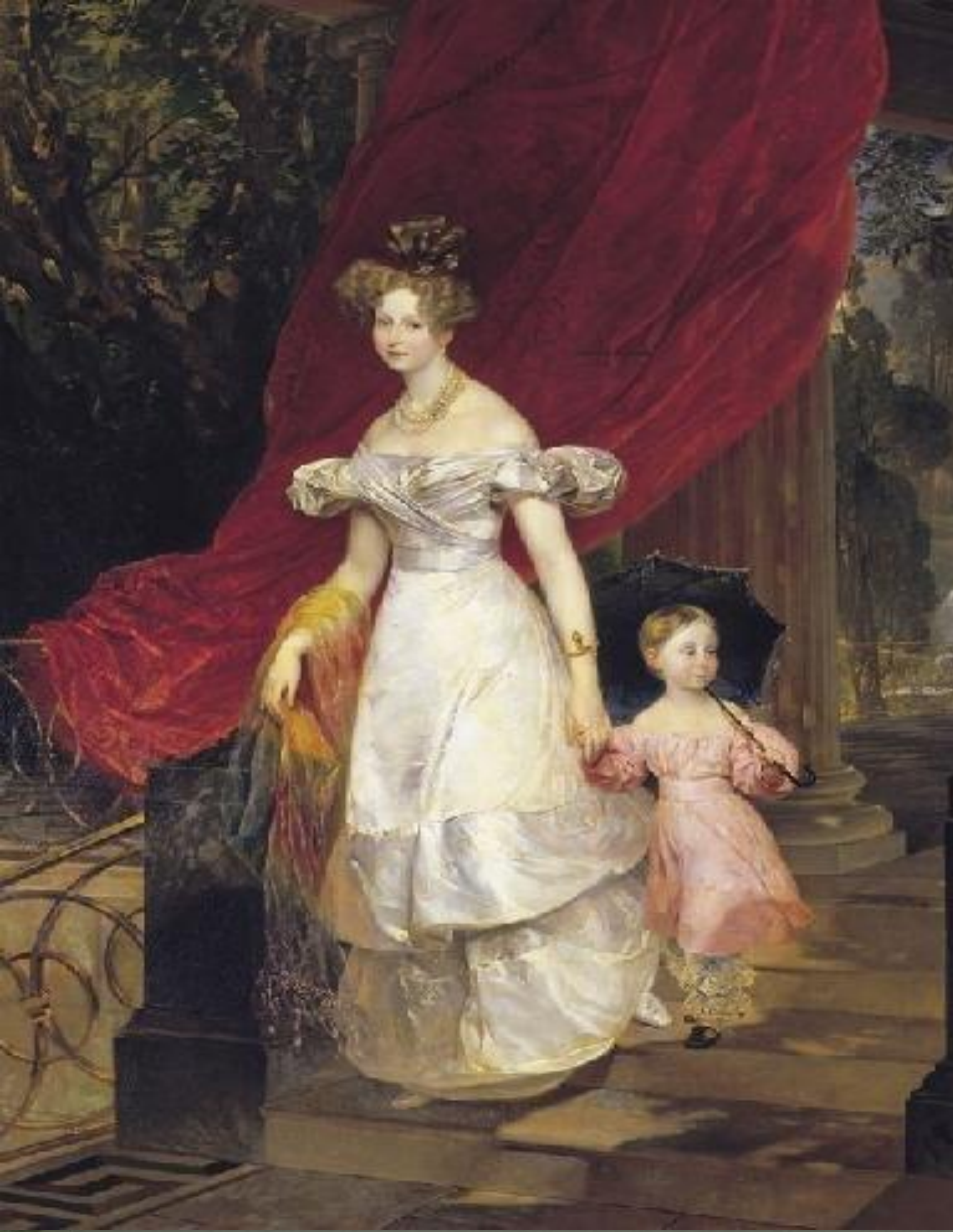
Портрет великой княгини Елены с дочерью Марией