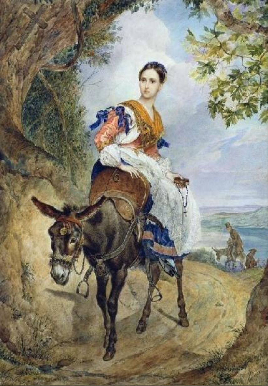
Портрет графини О.П. Ферзен на ослице