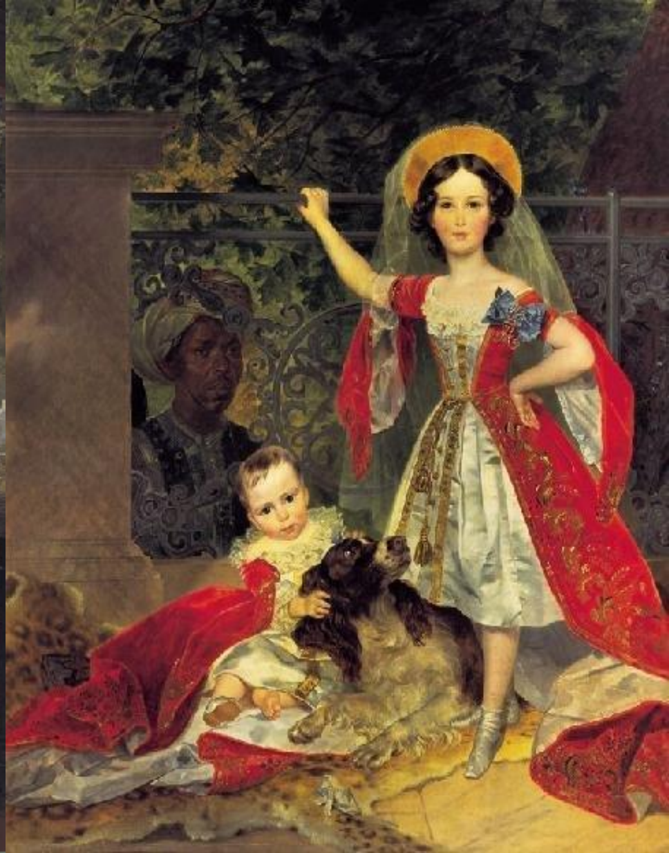
Портрет Волконских с арапом