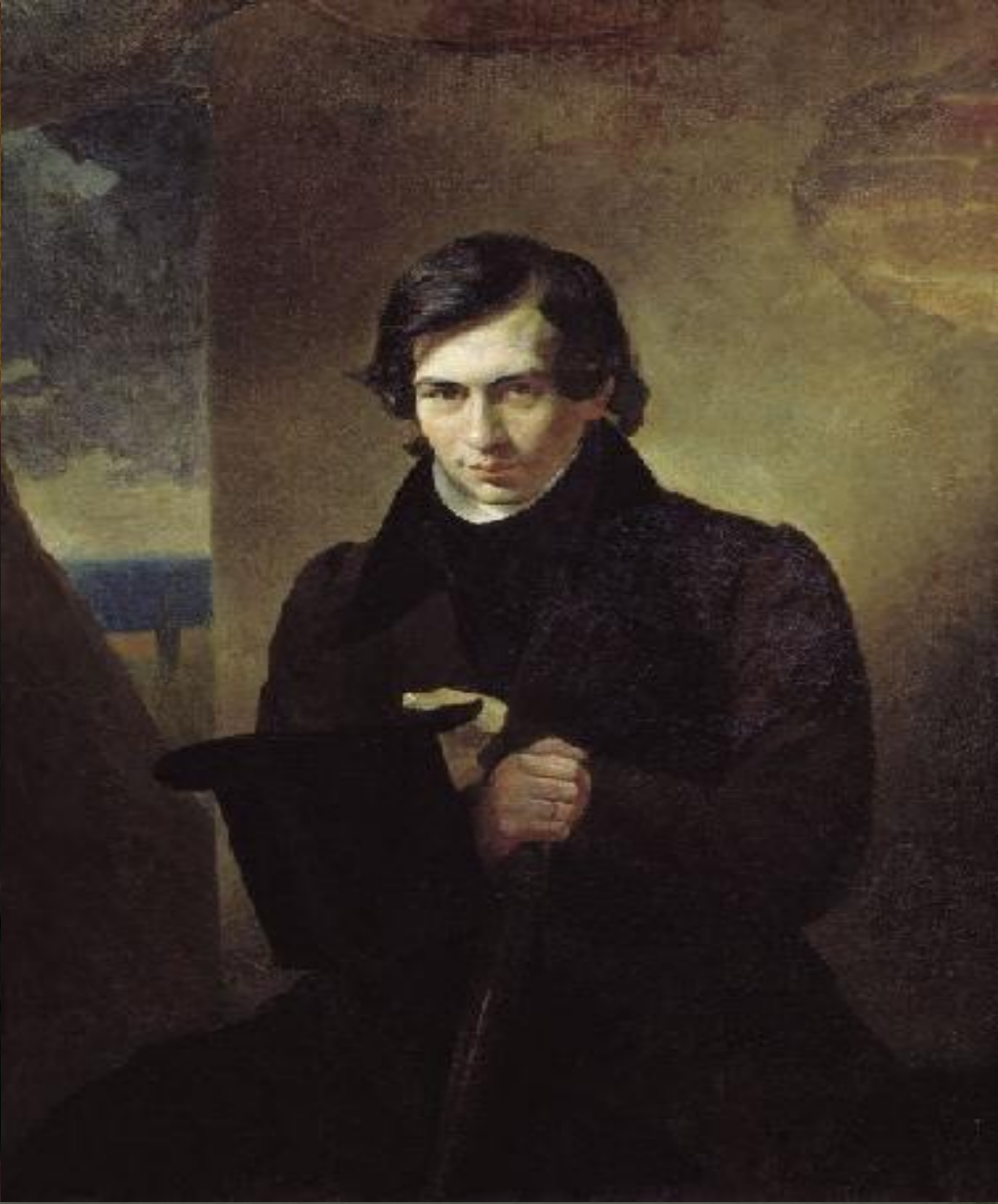
Писатель Нестор Васильевич Кукольник