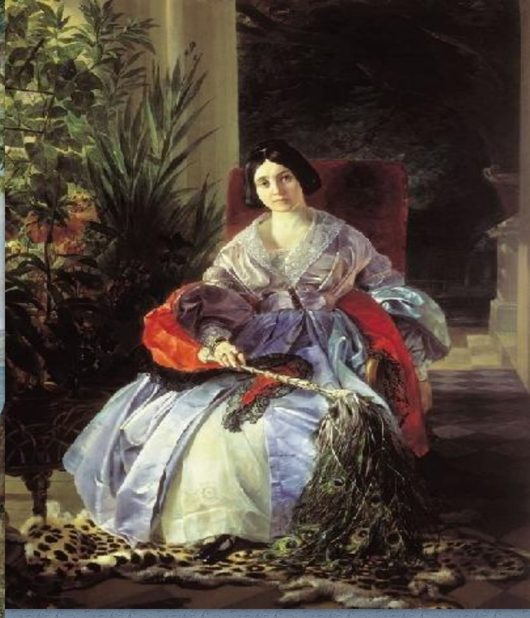
Портрет княгини Елизаветы