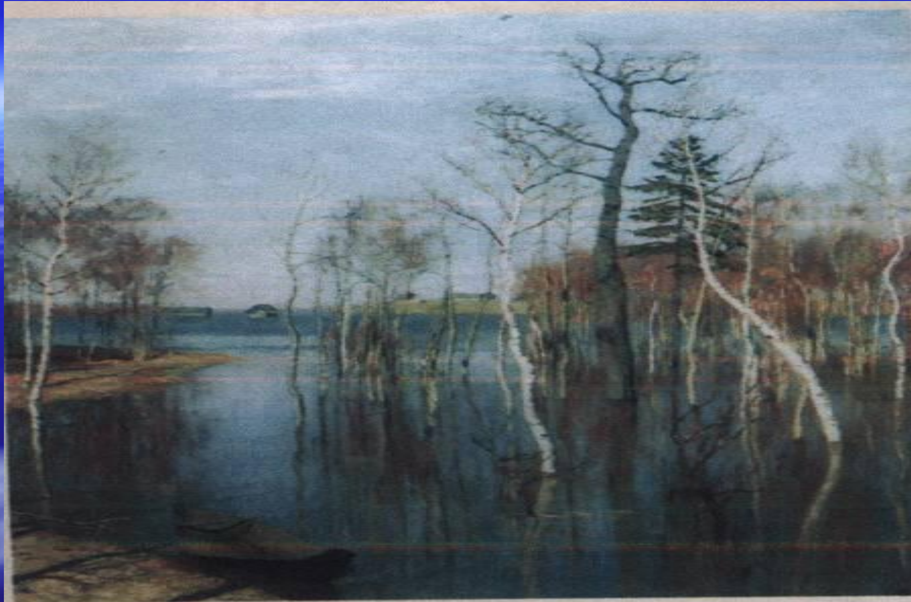
Весна. Большая вода