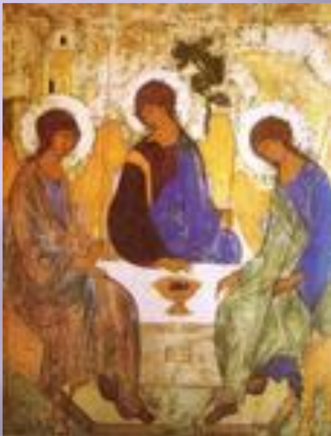
«ТРОИЦА» РУБЛЁВА 14 ВЕК