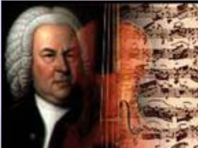
Иоганн Себастьян Бах « Хоральная прелюдия фа минор»

«Каждое произведение Иоганна Себастьяна Баха - открытие и откровение как для самого композитора, так и для исполнителя и слушателя ВЕЛИКОЙ БОЖЕСТВЕННОЙ ИСТИНЫ, заложенной в Священном писании. Каждая глава – это тональность и мысль, дух и философия. Тональность фа минор – отражение притчи о Блудном сыне» .