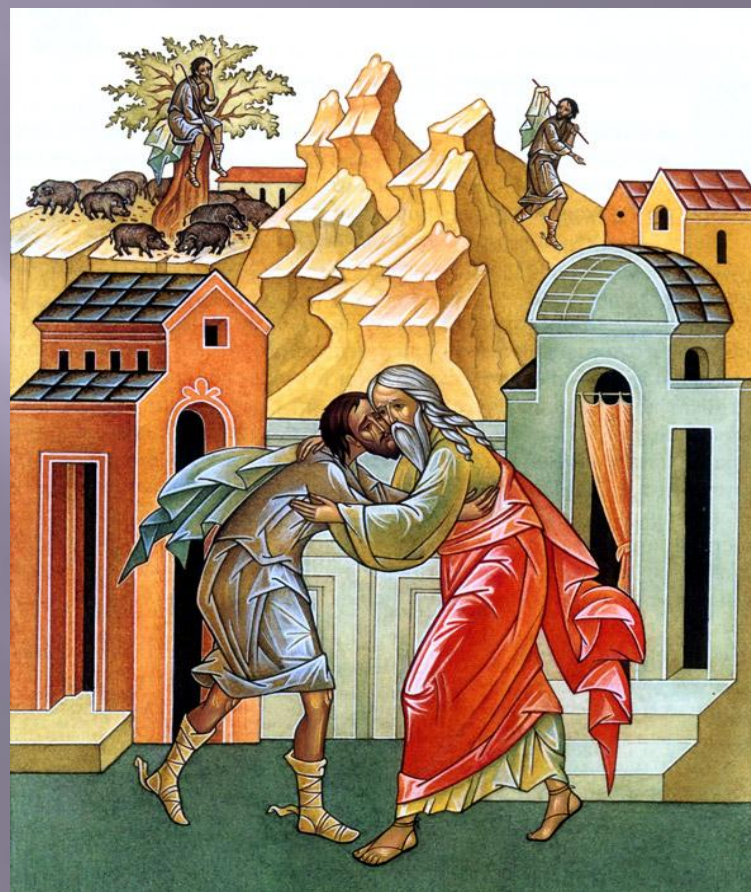
«ВОЗВРАЩЕНИЕ БЛУДНОГО СЫНА» 17 ВЕК