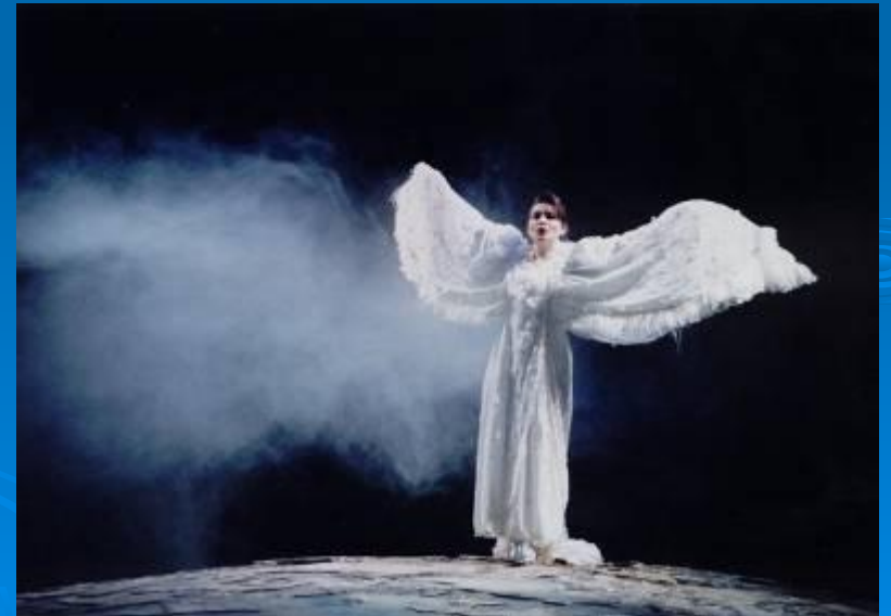
Опера "Сказка о царе Салтане"