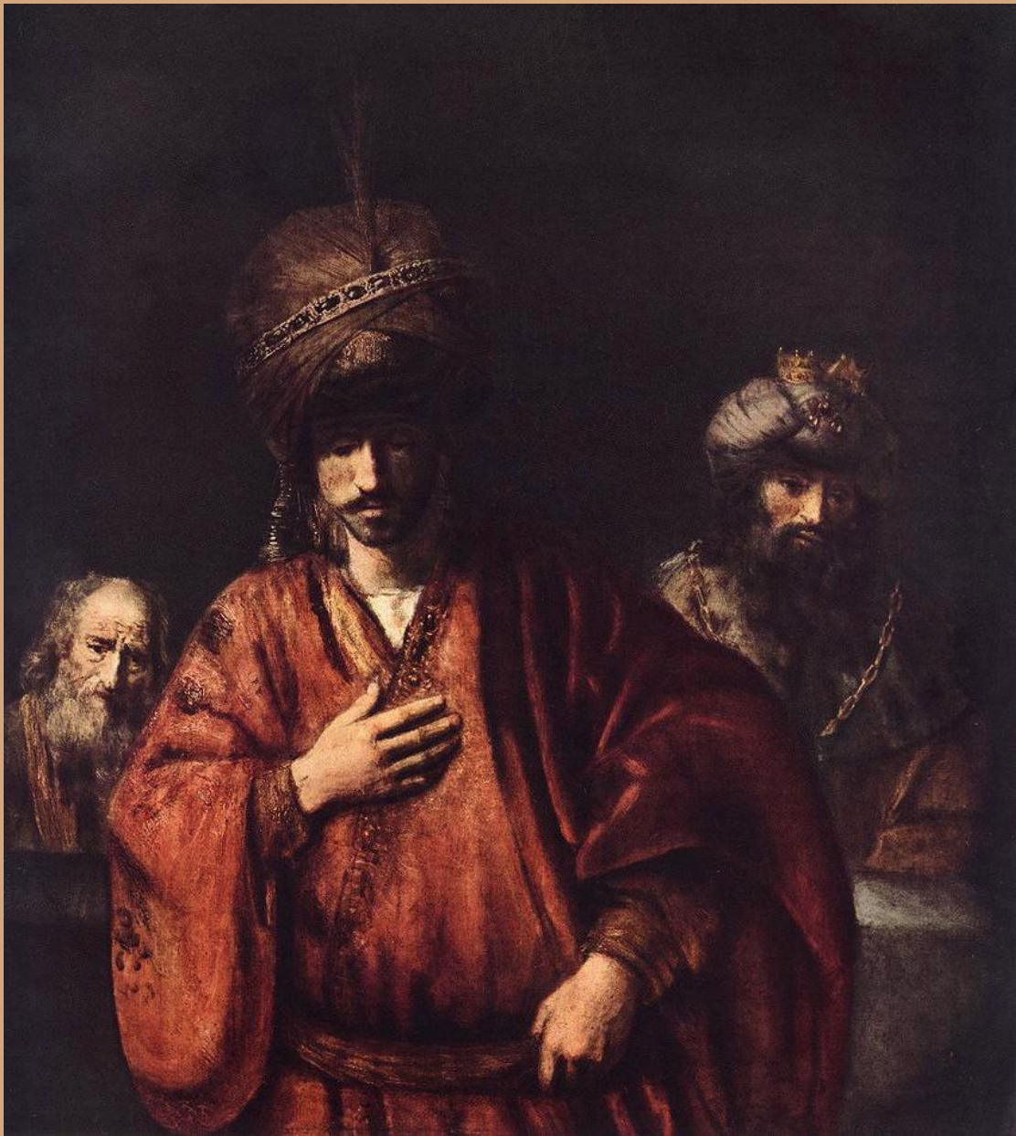
«Давид и Урия», 1665. Холст, масло, 127х117. Эрмитаж