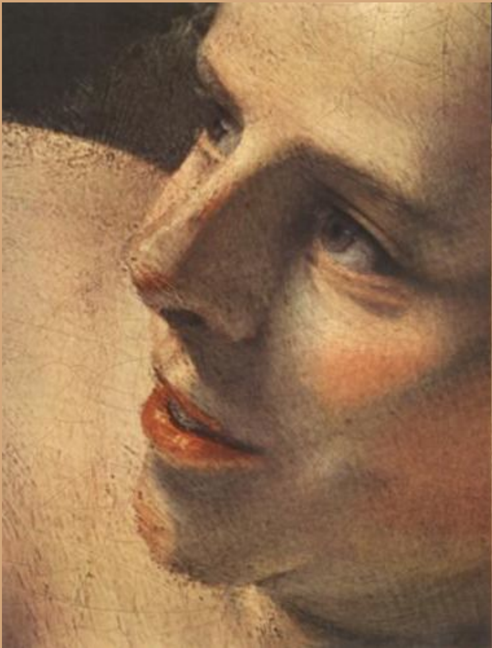
«Даная», деталь, 1636-47. Холст, масло, 165х203. Государственный Эрмитаж, Санкт- Петербург