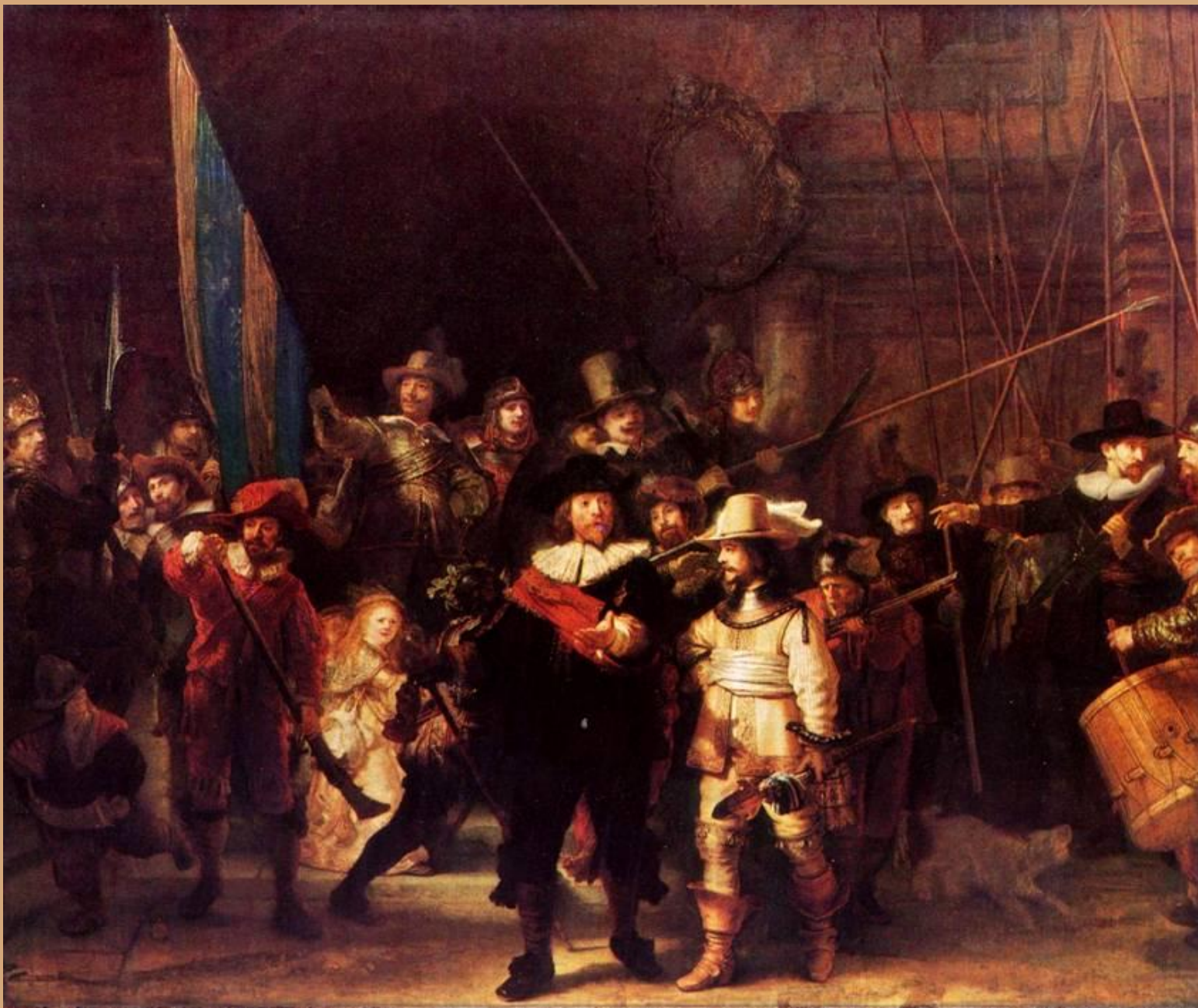
Рембрандт. «Выступление стрелковой роты капитана Баннинга Кока» («Ночной дозор») 1642. Холст, масло. 359 x 438. Рейксмузеум, Амстердам