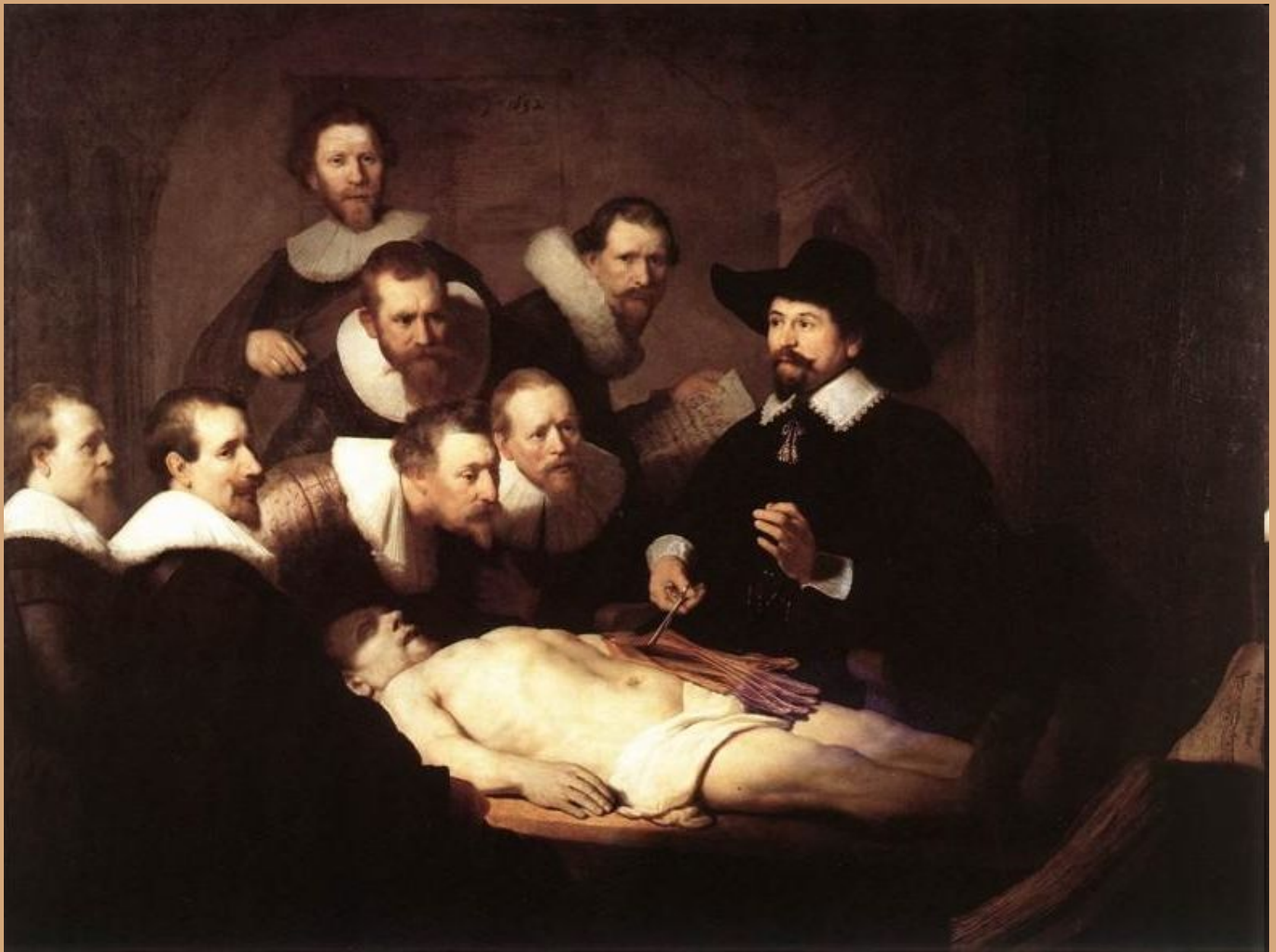
Рембрандт. «Урок анатомии доктора Тульпа»» 1632 Холст, масло. Маурицхёйс, Гаага