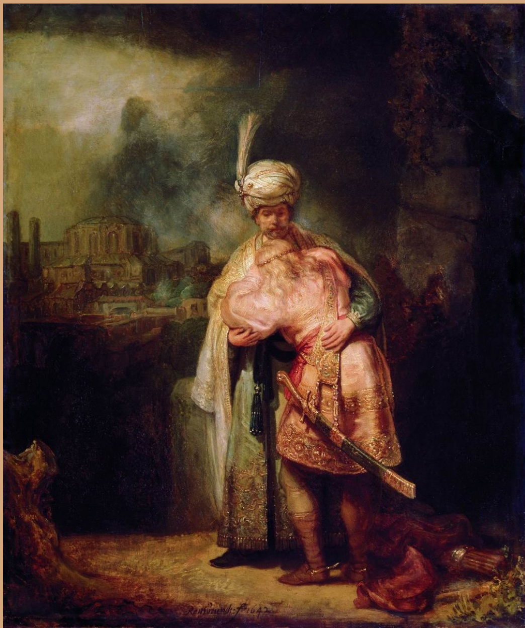
Рембрандт «Давид и Ионафан» . 1642 Дерево, масло. 73 x 61,5 см Эрмитаж,

Сюжет картины заимствован из Библии. Царь Саул ненавидел своего оруженосца Давида; он завидовал славе Давида и боялся, что тот взойдет на престол. Царь решил убить Давида, однако царевич Ионафан, друг Давида, предупредил его об опасности, и Давид решил бежать. На картине изображена сцена прощания Давида с Ионафаном у камня Азель, что означает «разлука». Ионафан суров и сдержан, лицо его скорбно. Давид в отчаянии припадает к груди своего друга, он безутешен. Давид одет в царские одежды, которые подарил ему Ионафан, по плечам распущены белокурые волосы. Вдалеке, за спиной Ионафана, видны развалины древнего города. Написанная вскоре после смерти Саскии, любимой жены Рембрандта, картина несет в себе отголосок безмерного горя художника, навеки расставшегося