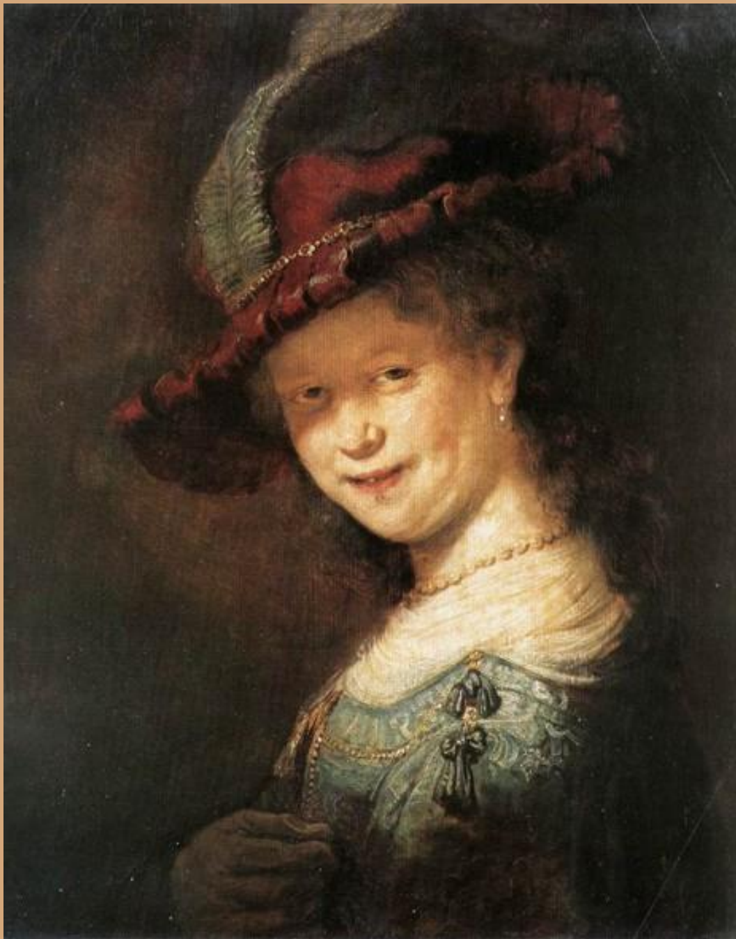
Рембрандт «Улыбающаяся Саския» . 1633 Картинная галерея, Дрезден