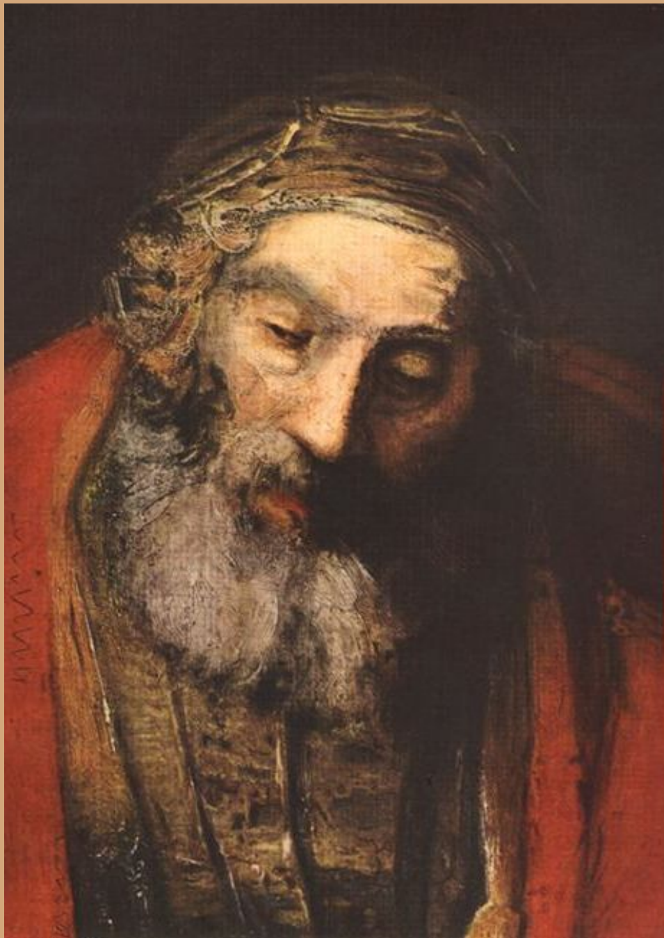
«Возвращение блудного сына». Деталь, 1669.