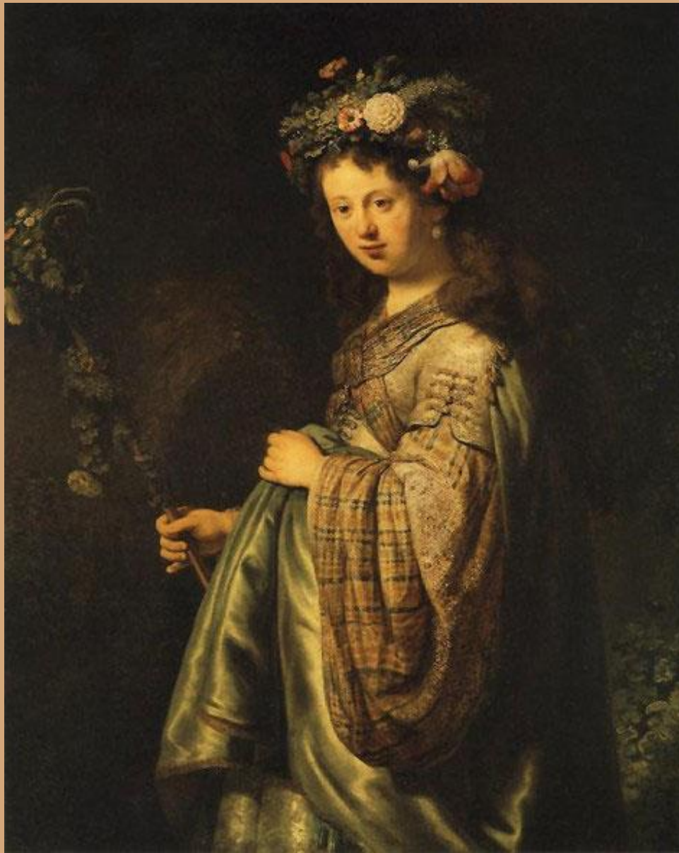
Рембрандт «Флора» 1634. Холст, масло. 124,7 x 100,4. Государственный Эрмитаж