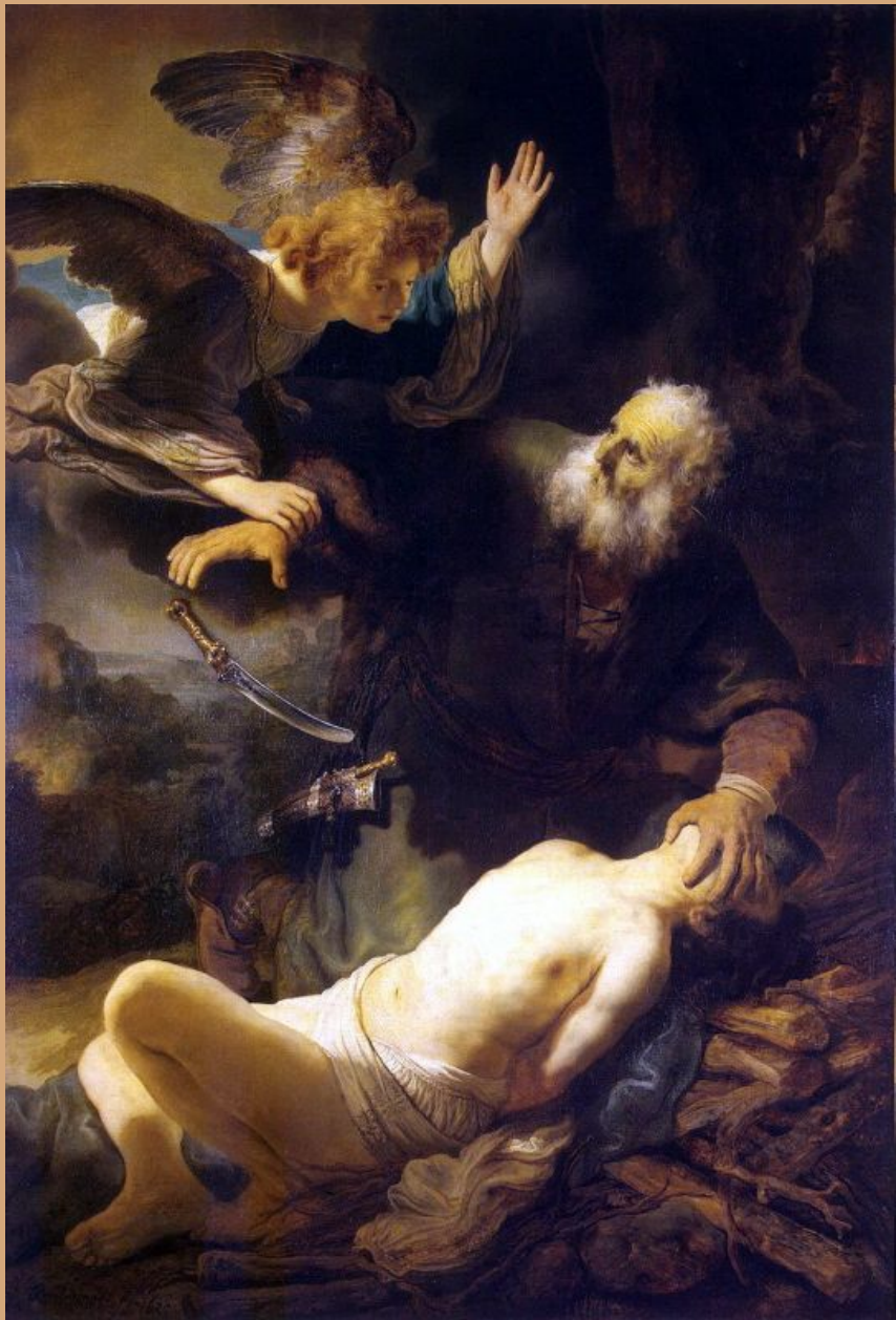
«Жертвоприношение Исаака». 1635. Санкт- Петербург, Эрмитаж

Это один из самых драматических моментов в Ветхом Завете. Авраам по велению свыше готов принести своего единственного сына Исаака в жертву Богу и уже занес над ним, связанным, нож, чтобы заколоть его для всесожжения. На картине Исаак лежит на жертвеннике поверх дров. В Священном Писании ангел Господень взывает к Аврааму, прошедшему испытание на покорность Богу, и велит ему остановиться. Рембрандт усиливает драматизм происходящего: на картине ангел схватил Авраама за кисть и нож падает. Сцена выигрывает в убедительности еще и потому, что большая ладонь Авраама закрыла сыну лицо, голова Исаака запрокинута и кажется, что в горло вот-вот вонзится нож.