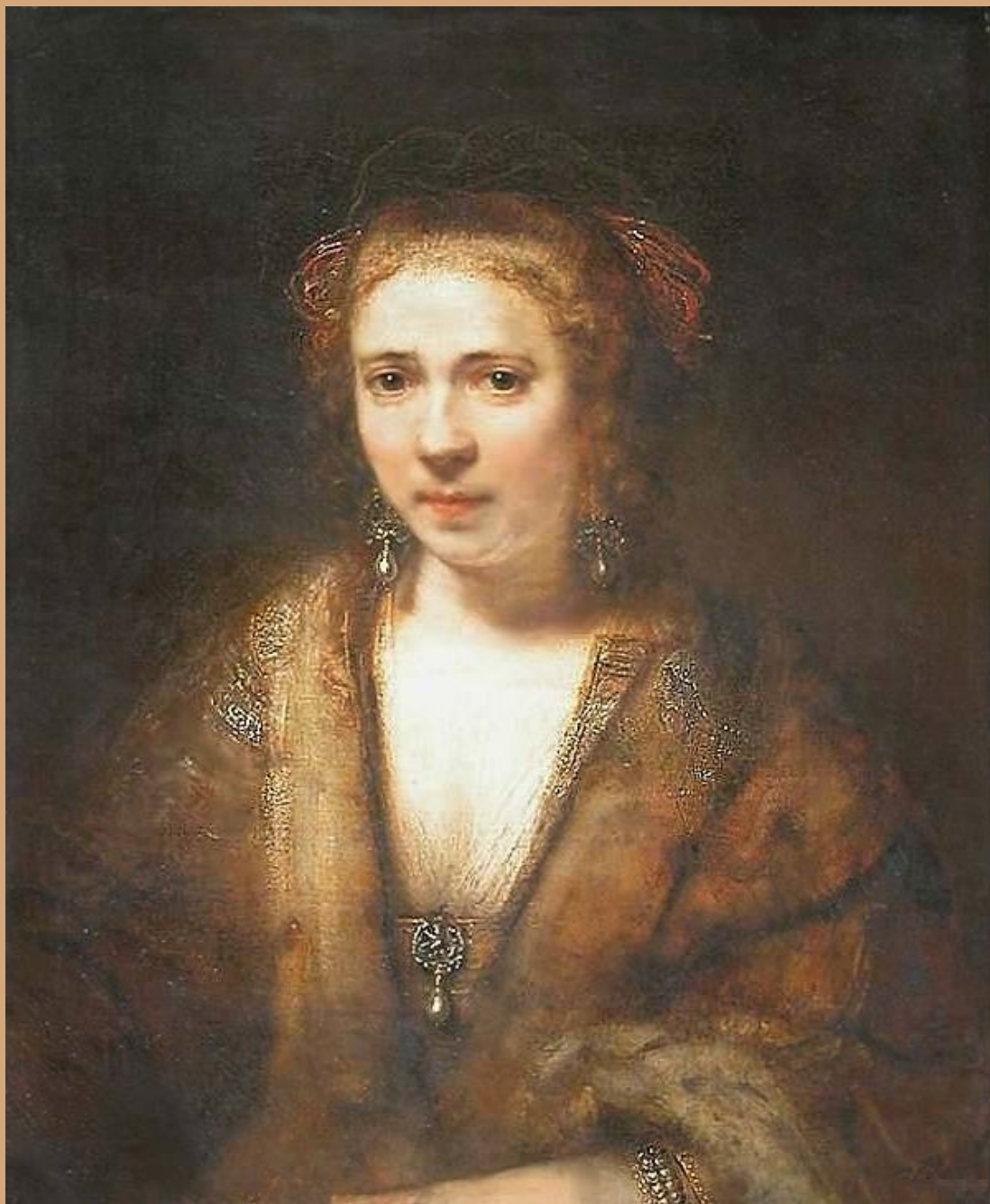
Рембрандт ван Рейн (1606-1669) Портрет Хендрикье Стоффельс (1625-1663) 1652 г, пастель, 61 x 74 см Лувр, Париж, Франция