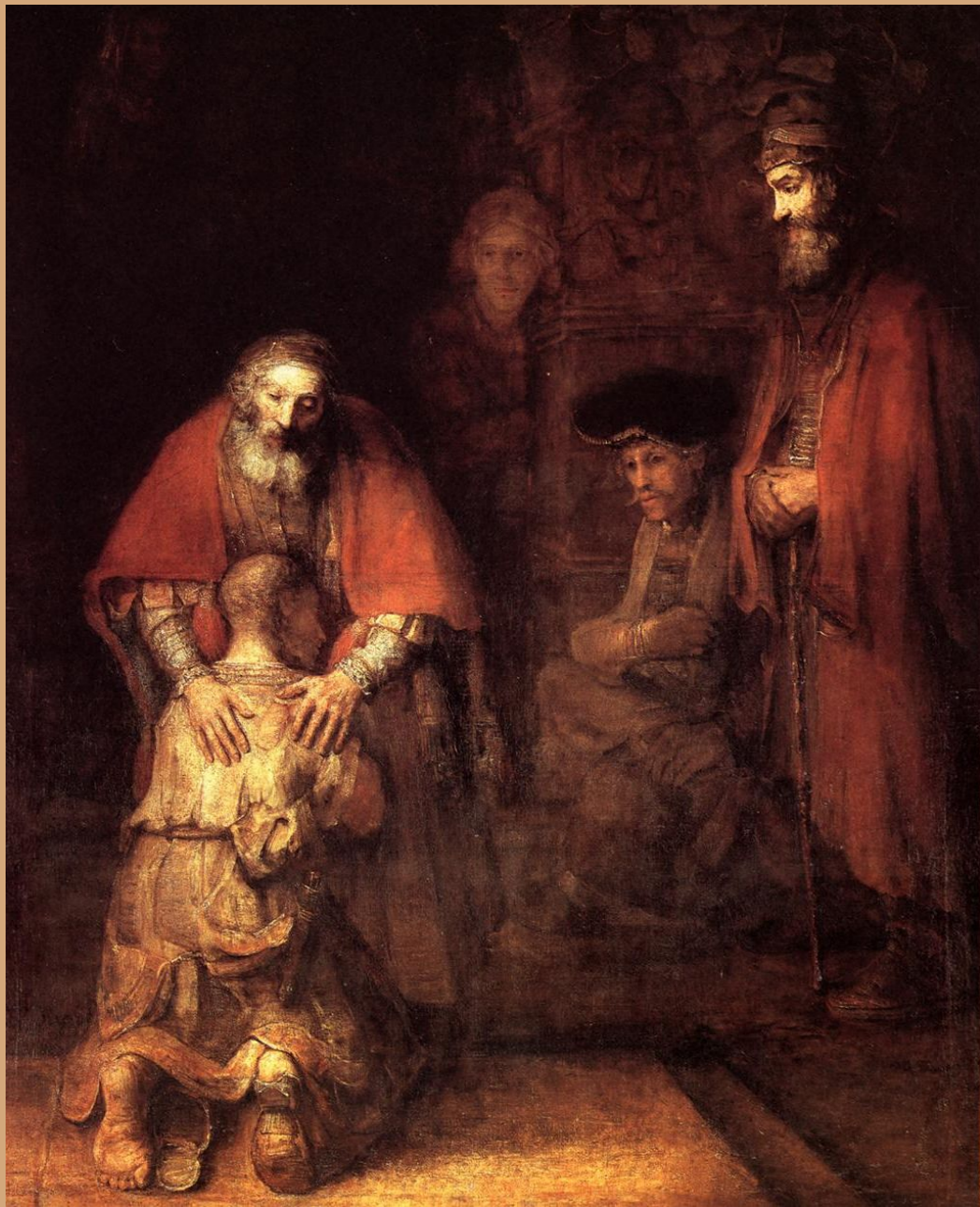
Рембрандт «Возвращение блудного сына»