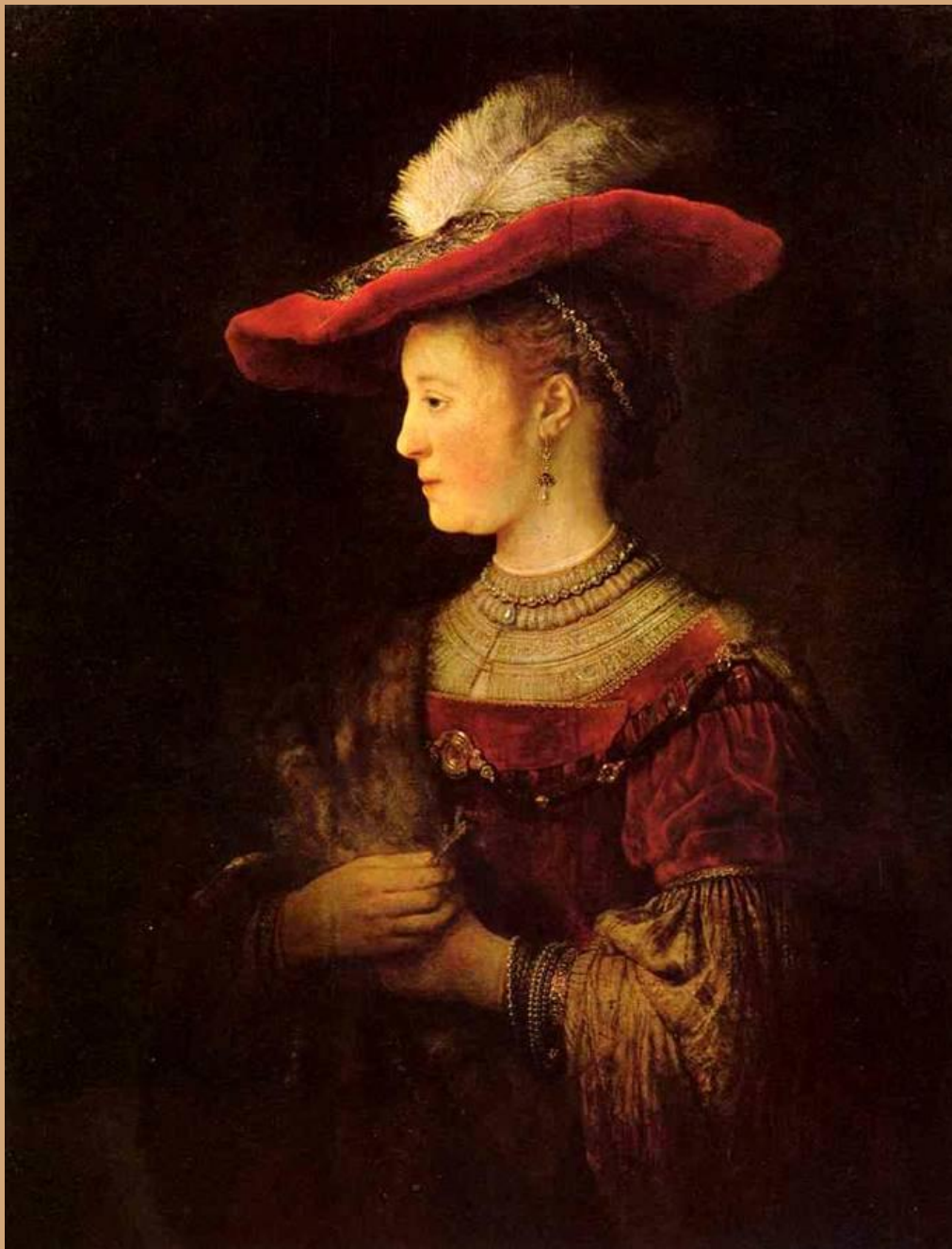
«Саския» Год создания 1634