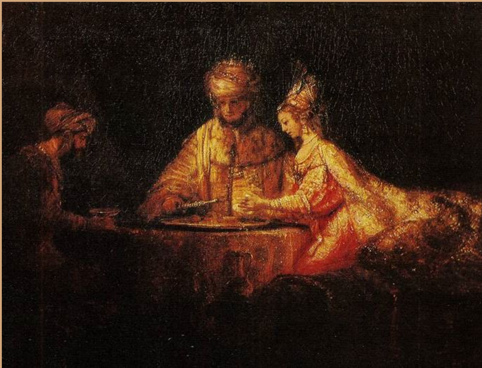
Харменс-ван-Рейн Рембрандт «Ассур, Аман и Эсфирь» [1660] Холст, масло. Москва. ГМИИ им. А.С. Пушкина