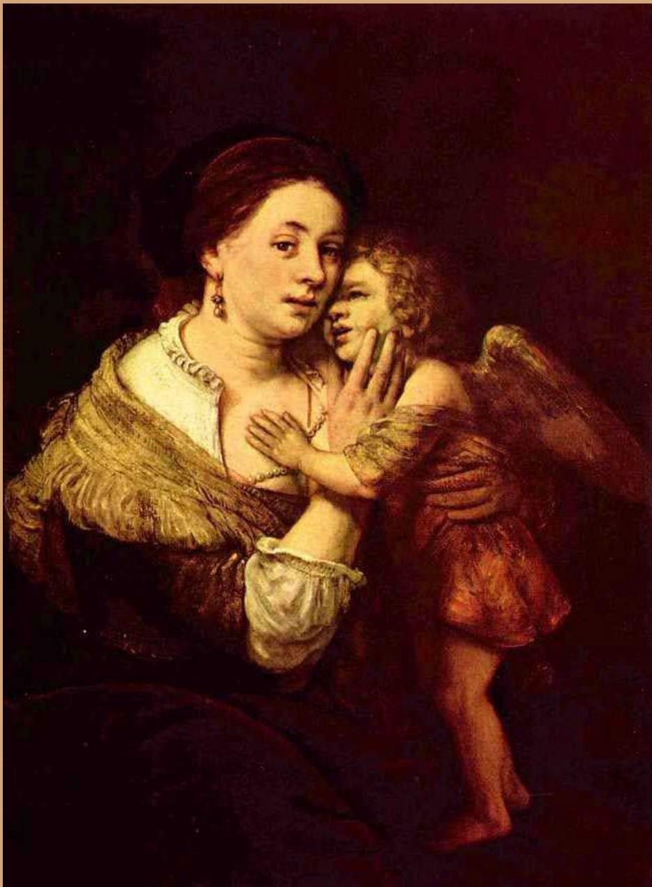
«Венера и Амур». 1642