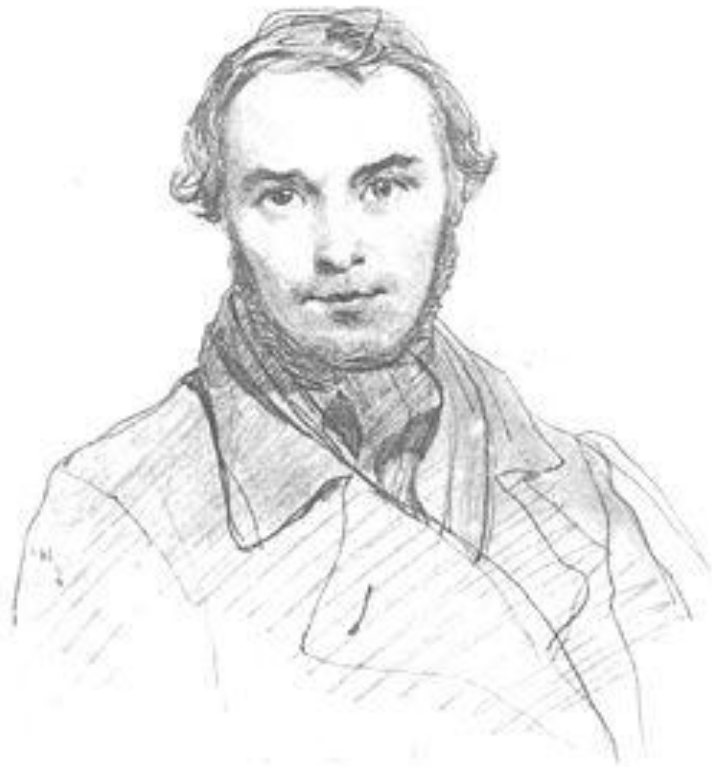
124. АВТОПОРТРЕТ. Олівець. [Київ, серпень 1845].