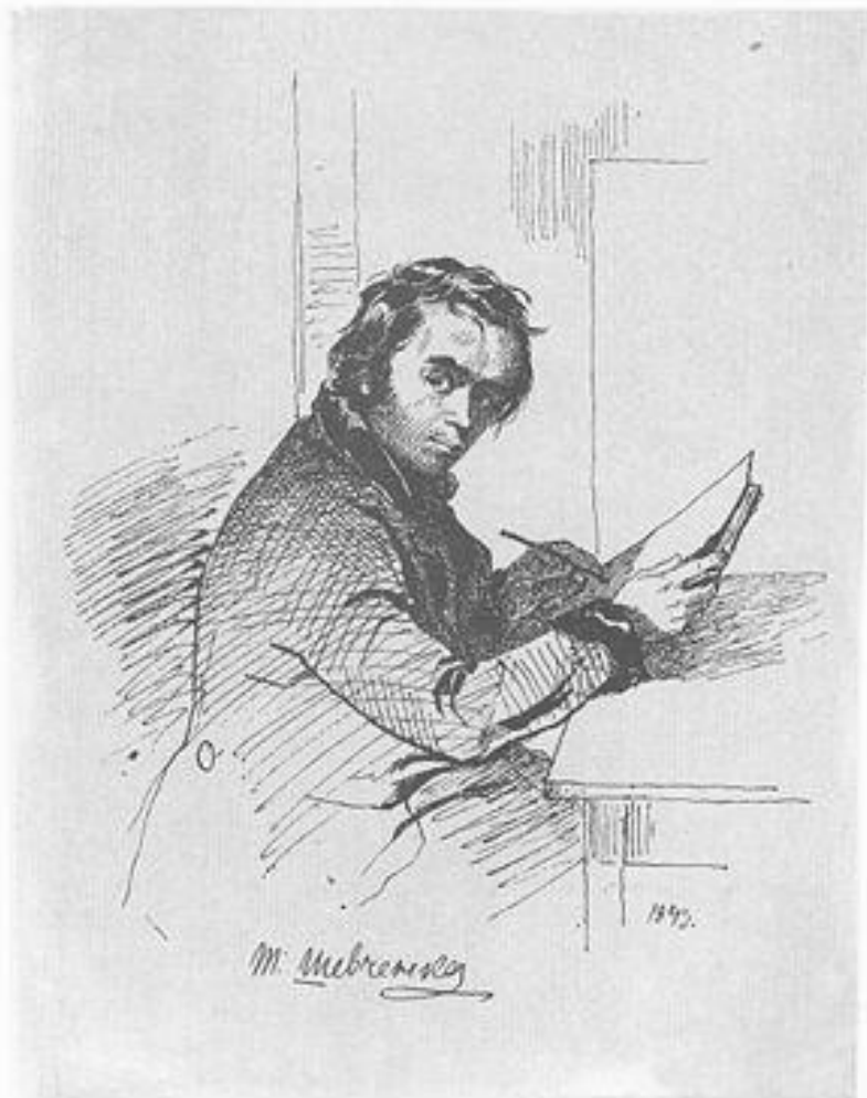
85. АВТОПОРТРЕТ, Тира. [23—28.XI] 1843.