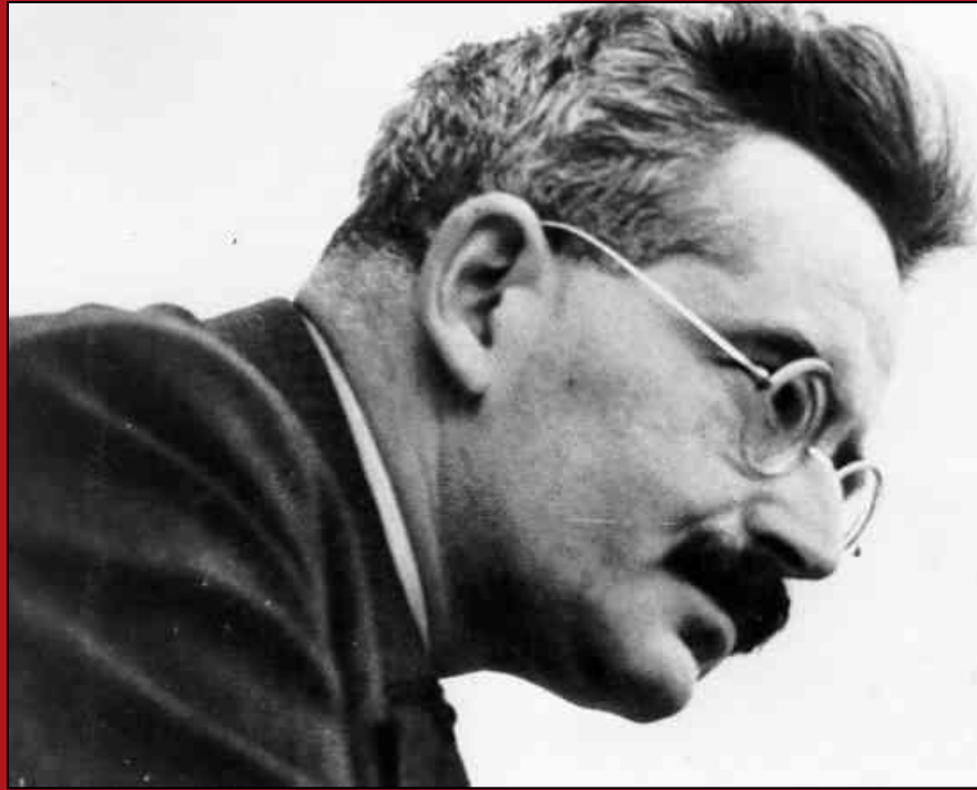
Вальтер Беньямин (1892—1940)