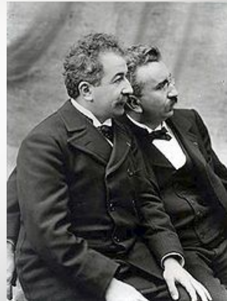
Братья Люмьер (Огюст слева, Луи справа)

Одним из первых Мельес сделал попытку перейти от черно-белого к цветному кино.