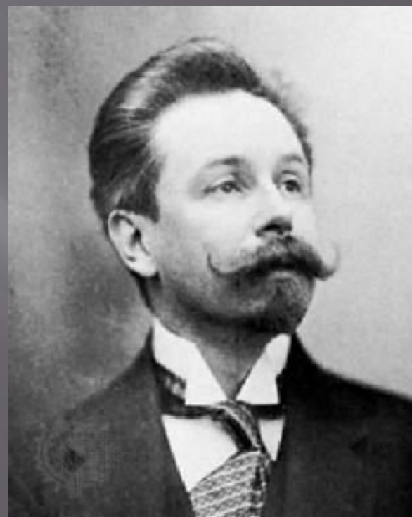
А. Н. СКРЯБИН