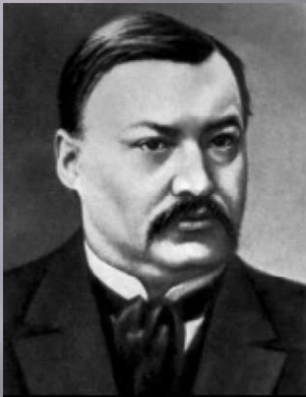
А. К. ГЛАЗУНОВ