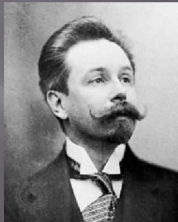
А. Н. СКРЯБИН