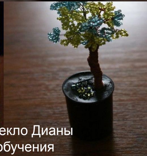
Работы Пекло Дианы 2 год обучения