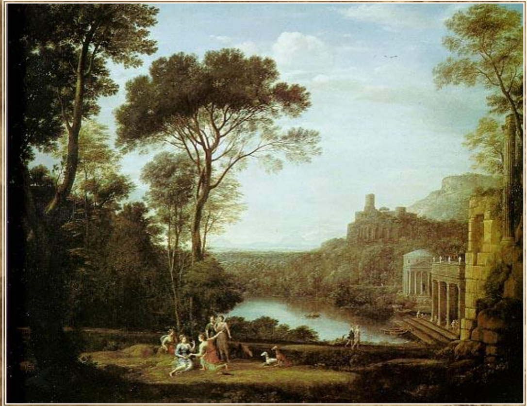
Пейзаж с нимфой Эгерией которая оплакивает Нуму Помпилия. 1669 г

При всей типичности применяемых композиционных приемов, свойственных пейзажной живописи классицизма, художнику удалось как бы вдохнуть новую жизнь в старую классицистическую схему, что привело к обновлению жанра в XIX в. Лоррену удалось создать картины, наполненные удивительным живописным обаянием, в которых при некоторой театральности, свойственной произведениям классицизма, ощущается живое дыхание природы, воздушной среды.