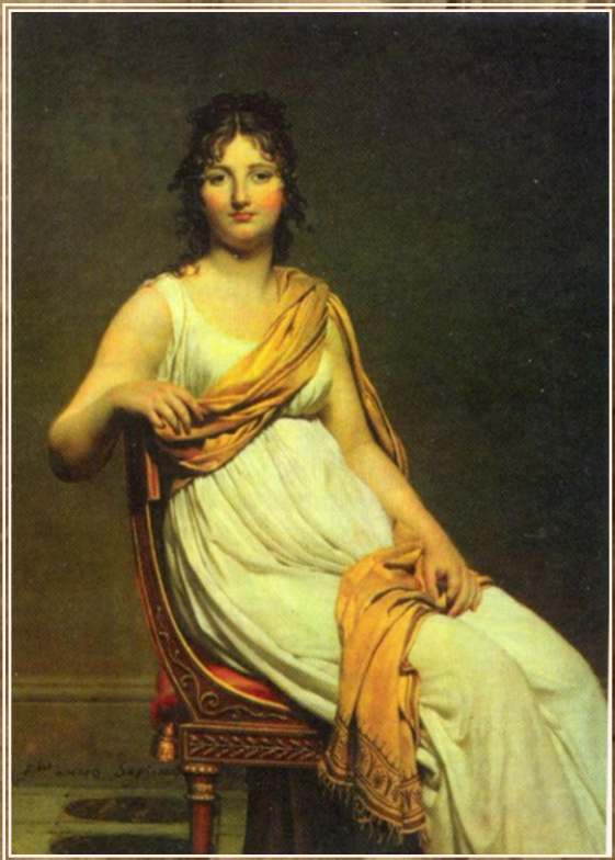
Жак-Луи Давид Портрет г-жи Верниак. 1777 г.

Обращение к идеалам античного искусства вносит новое в понимание образа идеального человека, а также ясность, простоту, соразмерность в его одежду. Первоначально парижские модники и модницы старались точно копировать античные одежды. Мужчины носили короткую тунику, доходившую до колен и схваченную на талии поясом, поверх туники надевали плащ, также носили сандалии с завязанными вокруг ноги лентами. Женщины надевали длинную, разрезанную по бокам легкую тунику, перехваченную под грудью поясом и красиво задрапированную. Всем своим обликом женщина должна была напоминать мраморную скульптуру. Вот почему одежды носили исключительно белые. В моду в большом количестве вошла пудра, которой модницы покрывали не только лицо, но и шею, грудь, спину, руки.