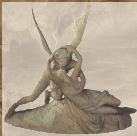
Психея, разбуженная поцелуем Амура. 1797 г.

Итальянский скульптор Антонио Канова (1757-1822)-один из главных представителей классицизма. Он старается усовершенствовать античную скульптуру и часто выбирает мифологические сюжеты, как, например, в своем шедевре, иллюстрирующем миф об Амуре и Психее.