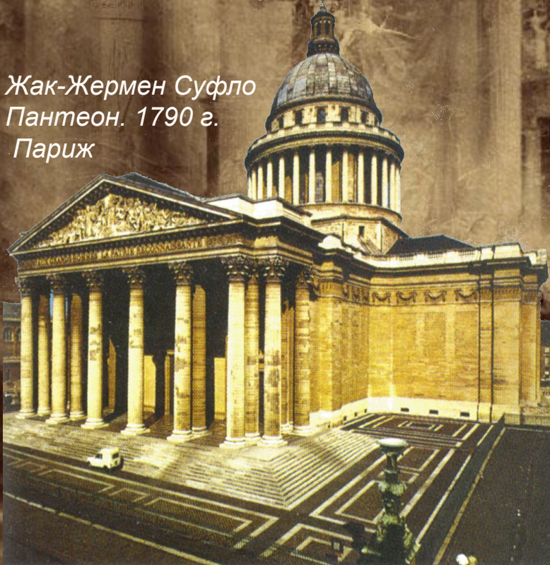
Жак-Жермен Суфло Пантеон. 1790 г. Париж

Широко используются античные ордер и орнаментика. Творческое заимствование форм, композиций и образцов искусства античного мира возвращает в архитектуру колонный портик, являющийся доминирующей композиционной частью здания. Завершают фасад с двух сторон выступы-ризалиты или маленькие портики. Такой прием не только подчеркивает величие и доминанту главного портика, но и помогает восприятию здания как пластического целого, утверждающего себя в окружающем пространстве.