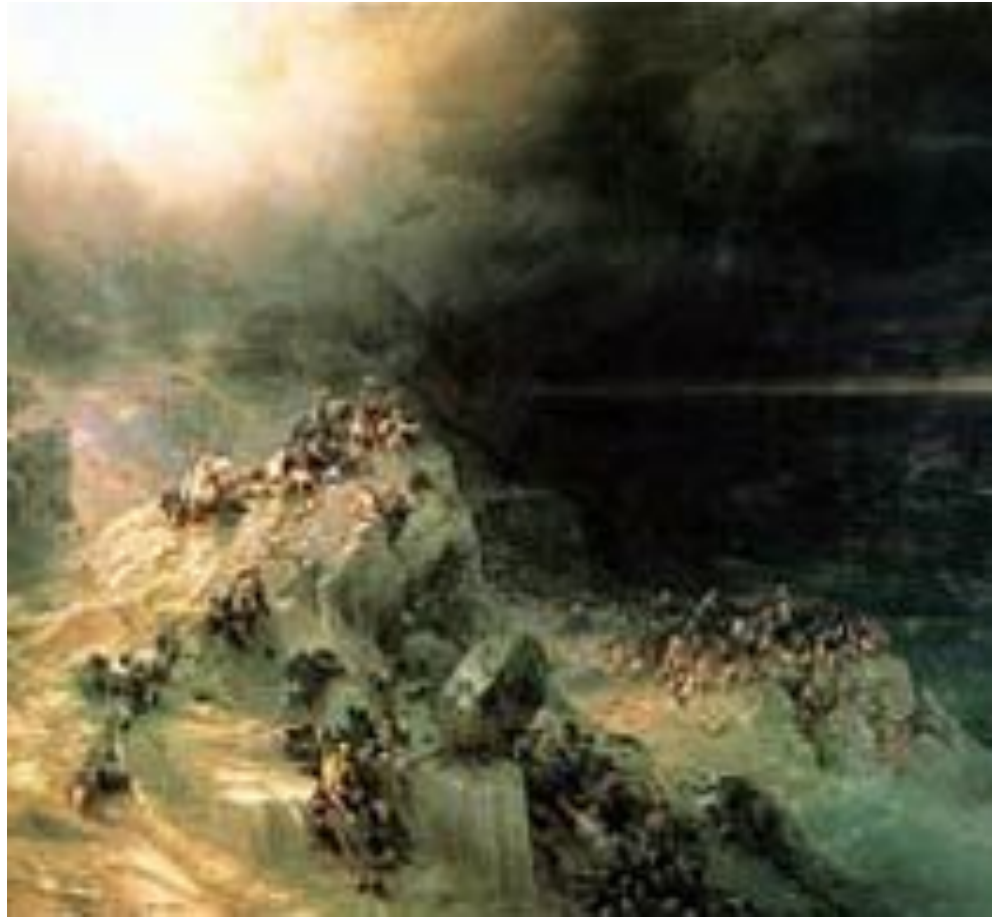
"Всемирный потоп" 1864