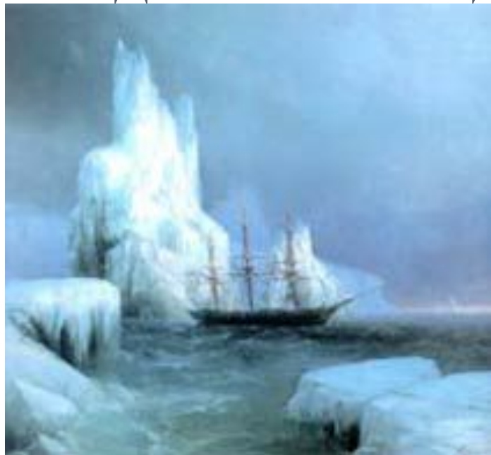
"Ледяные горы" 1870

АИВАЗОВСКИЙ, КАК НИКТО ДРУГОЙ СУМЕЛ ПОКАЗАТЬ ЖИВУЮ, ПРОНИЗАННУЮ СВЕТОМ, ВЕЧНО ПОДВИЖНУЮ ВОДНУЮ СТИХИЮ.