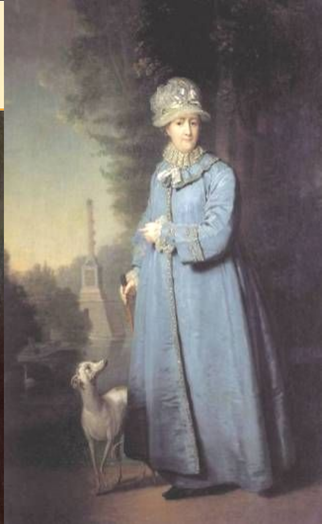
В.Л.Боровиковский Портрет великой княжны Александры Павловны