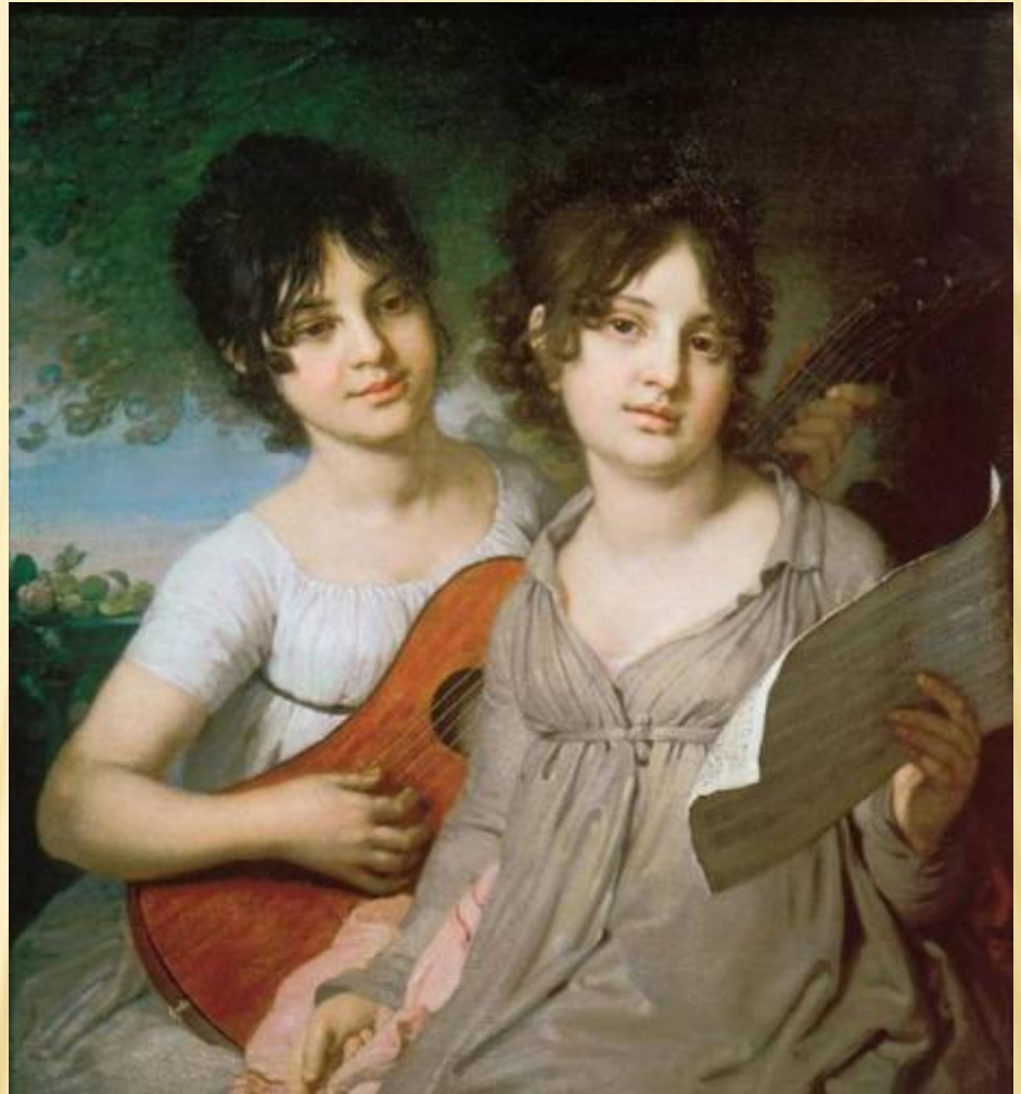
В. Л. БОРОВИКОВСКИЙ ПОРТРЕТ А. Г. И В. Г. ГАГАРИНЫХ. 1802 Г.

Живопись сентиментализма показывала “человека чувствительного”. Человек был примечателен не воинскими подвигами или государственными делами, а богатством души и сердца.