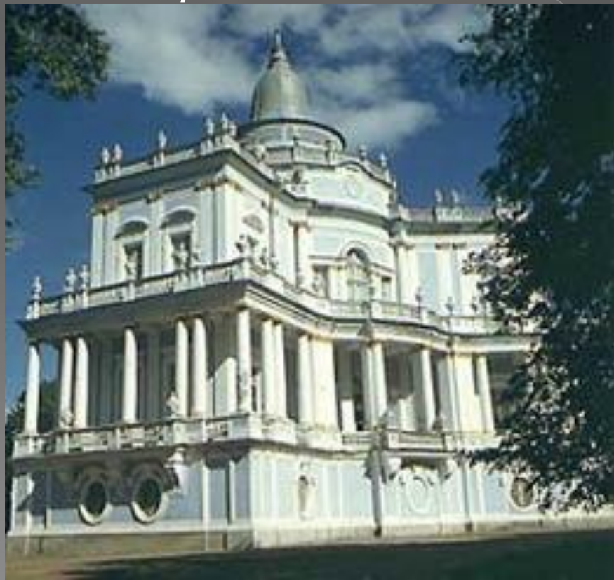
Антонио Ринальди. Павильон Катальной горки