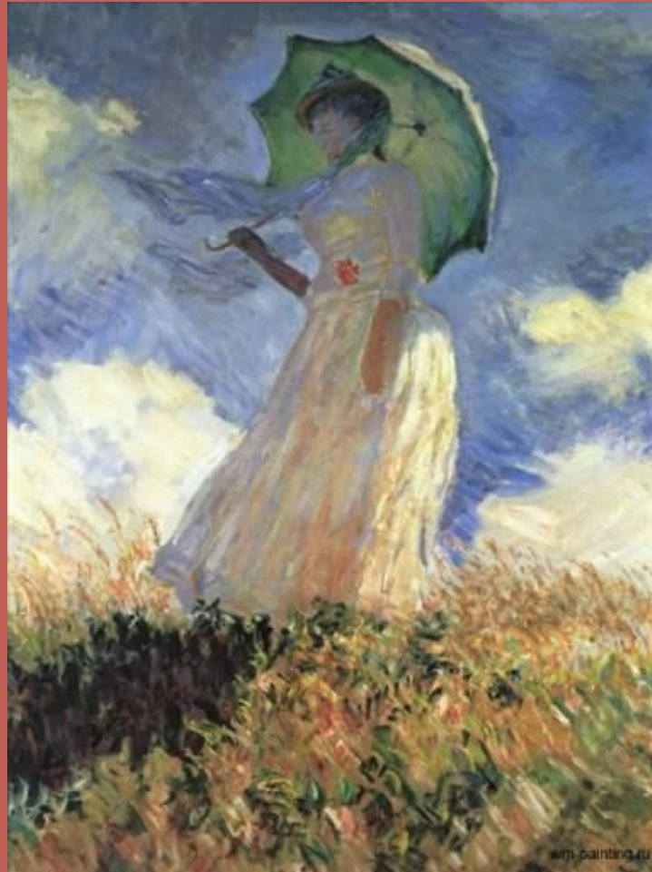
Женщина с зонтиком.