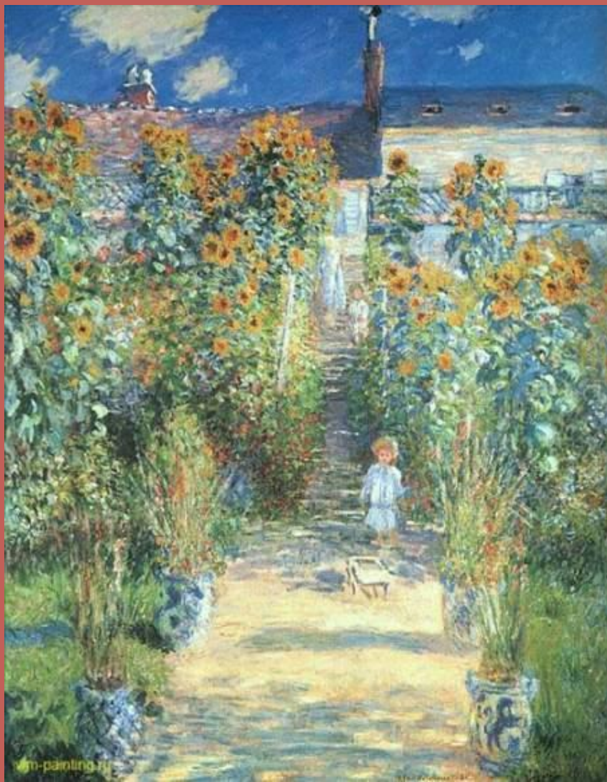
Сад художника в Живерни