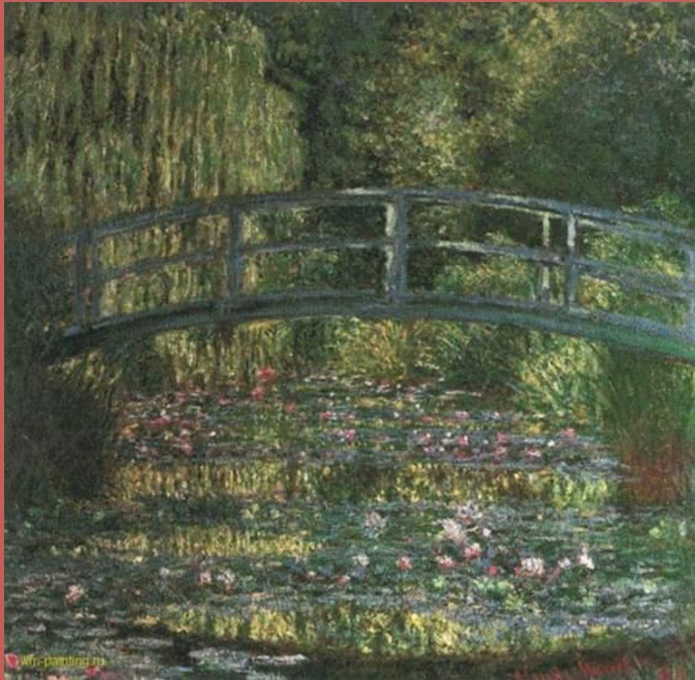
Пруд с водяными лилиями (зелёная гармония)