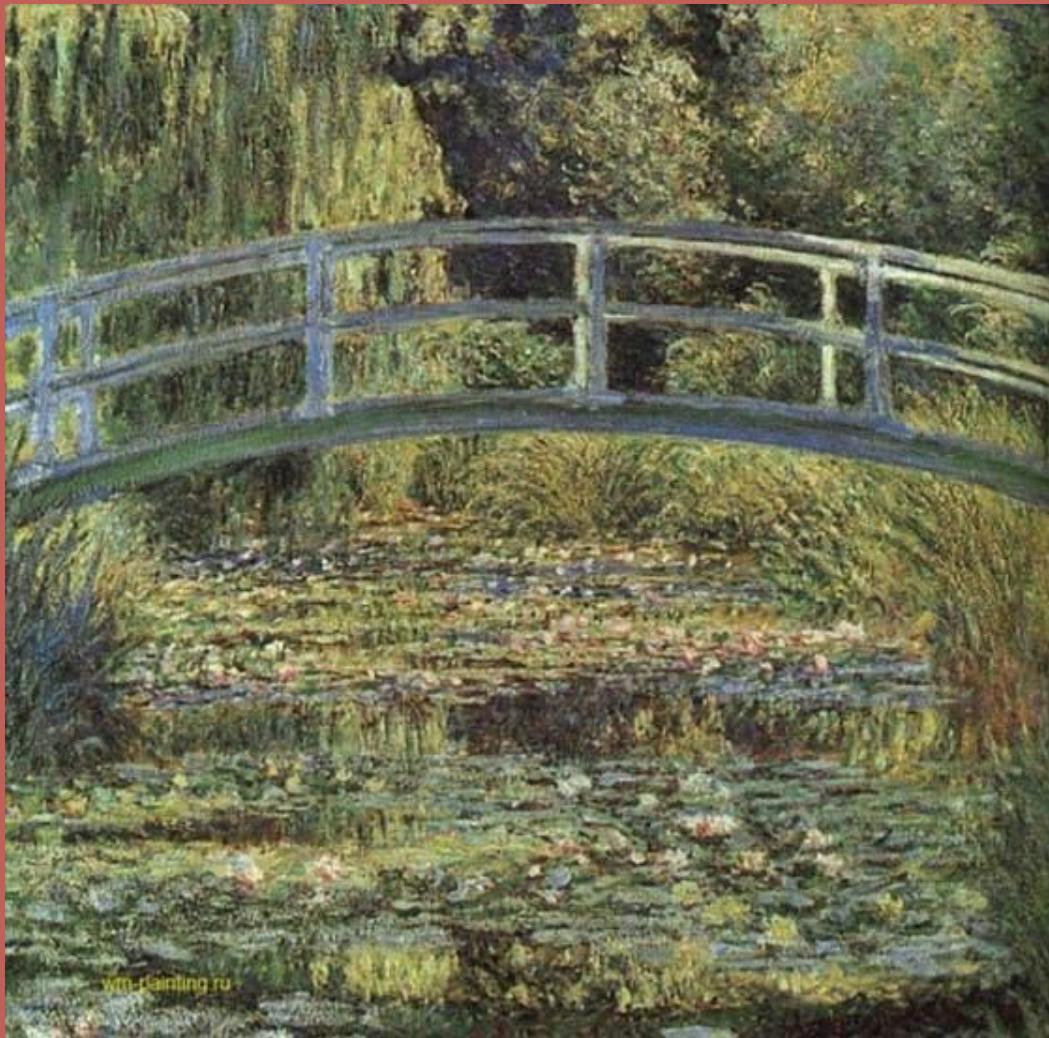
Пруд с водяными лилиями