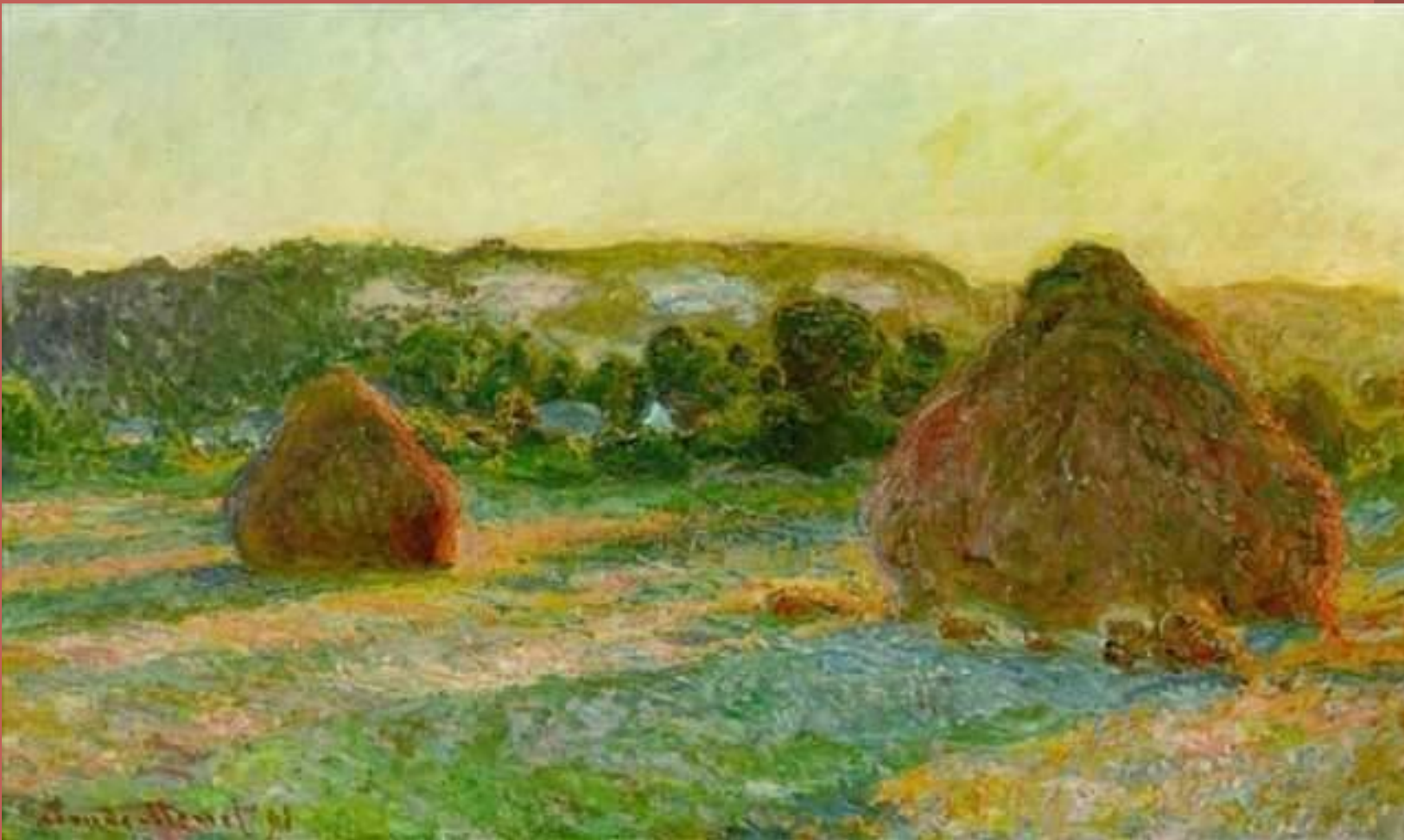
Стога сена. Конец лета 1890 года