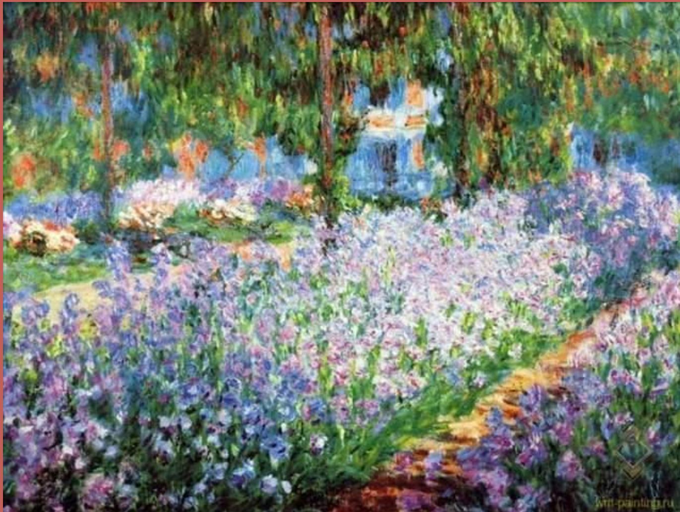
Клумба с ирисами в саду 1900 год