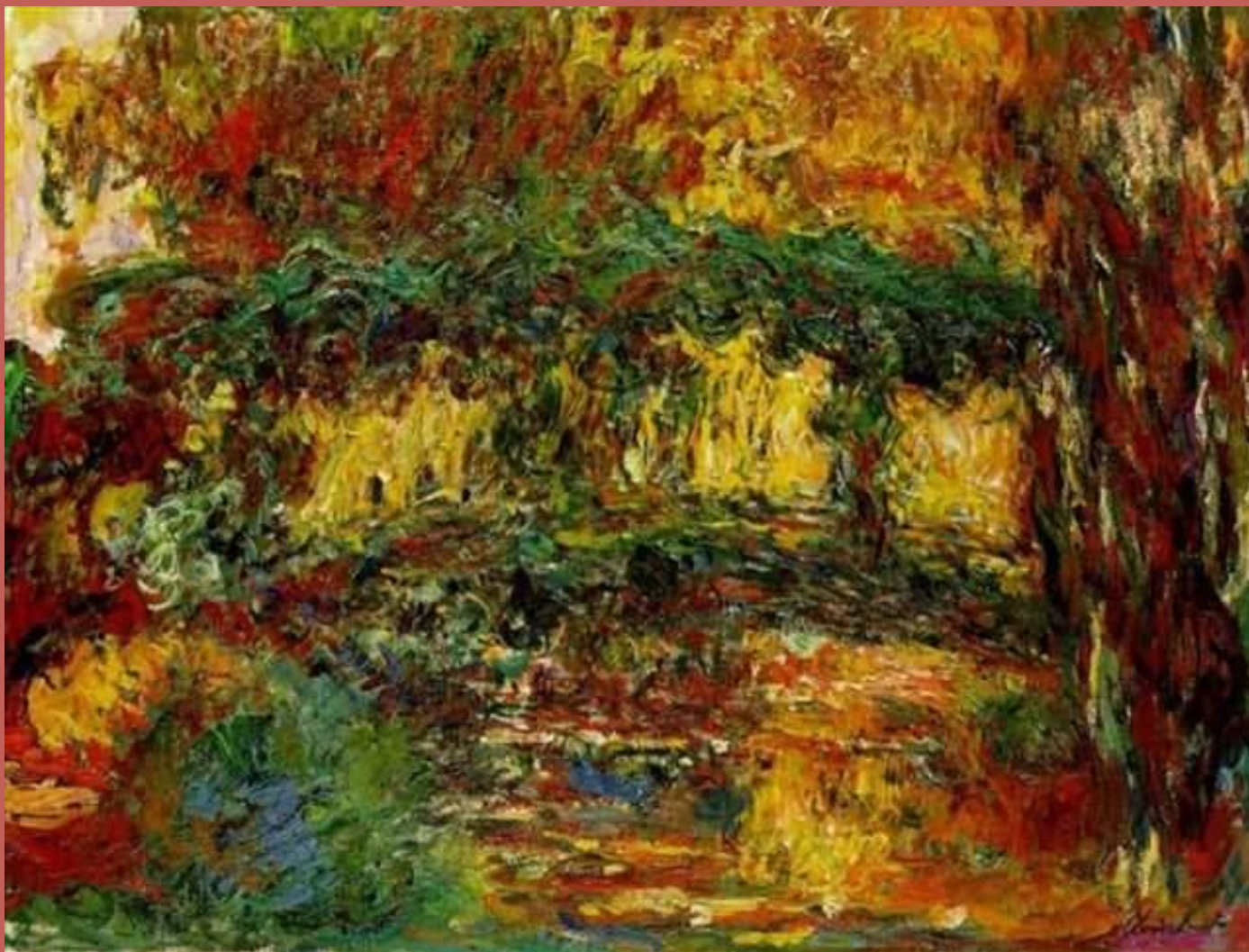
Японский мостик в Живерни