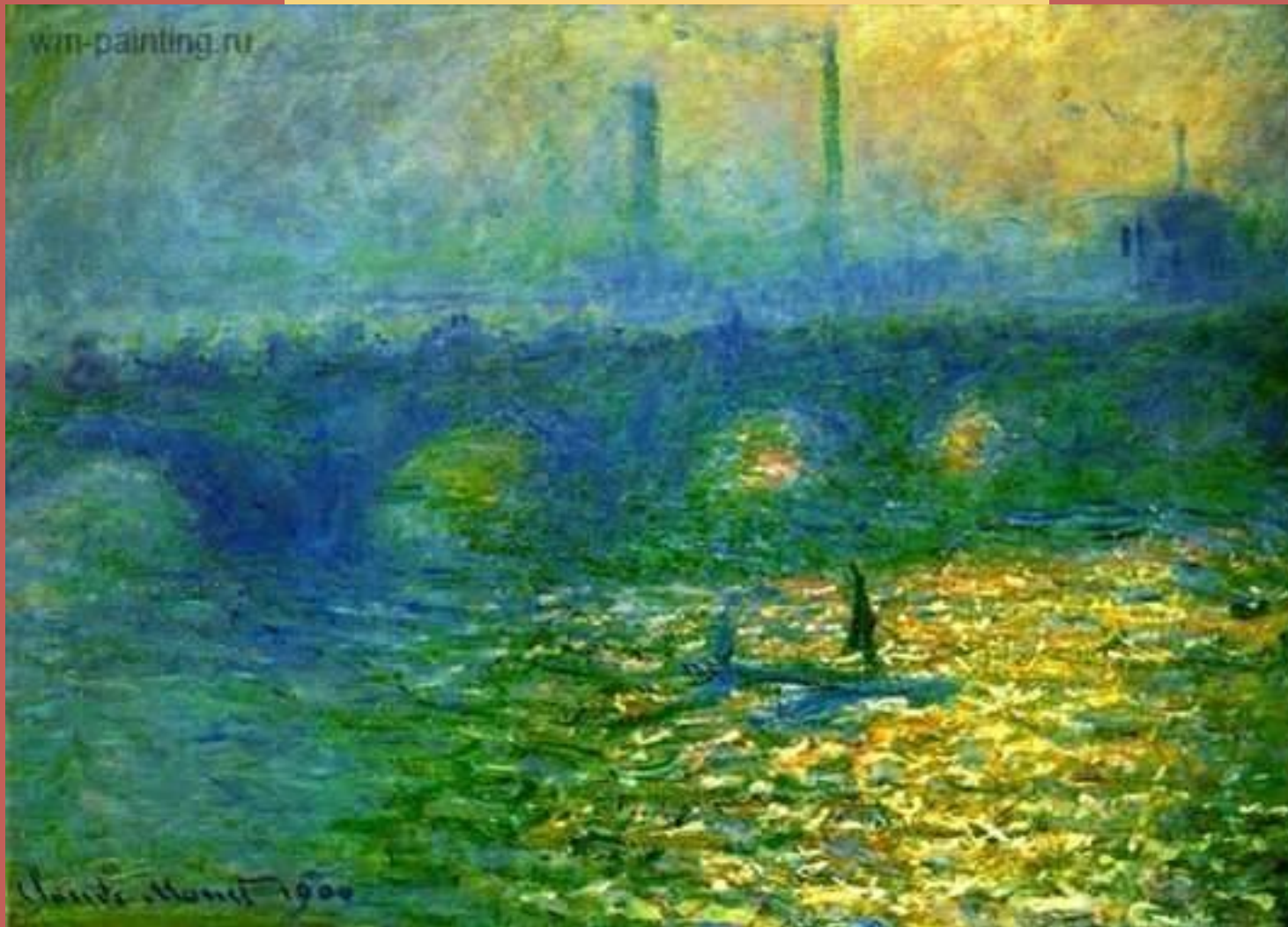
Мост Ватерлоо 1902 год