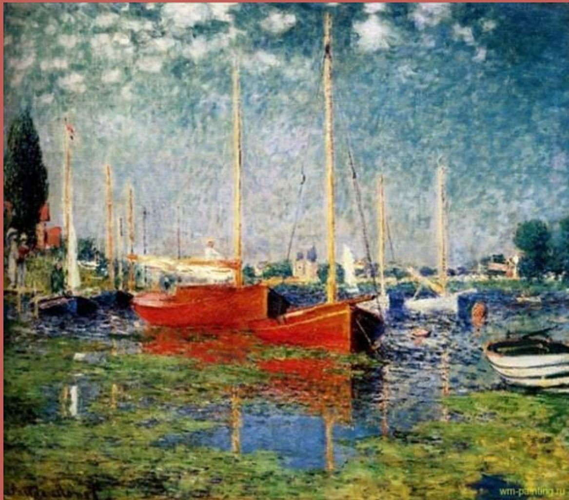
Красные лодки в Аржантей