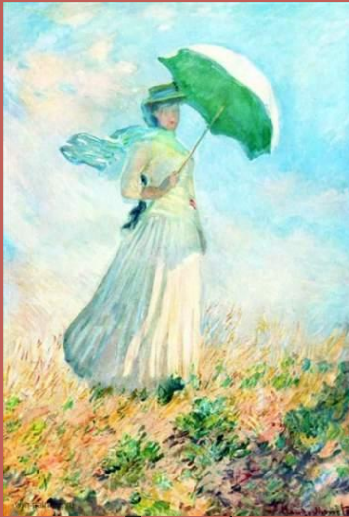
Дама с зонтиком. Этюд (поворот направо)