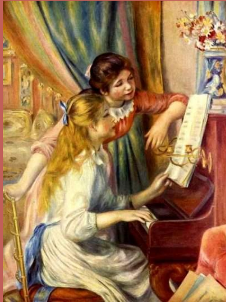
Ренуар (Девушки за фортепьяно)