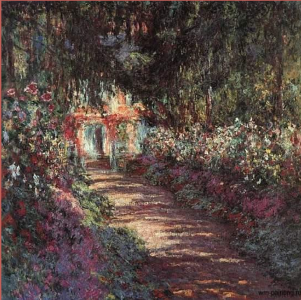
Сад в цвету 1901-1902