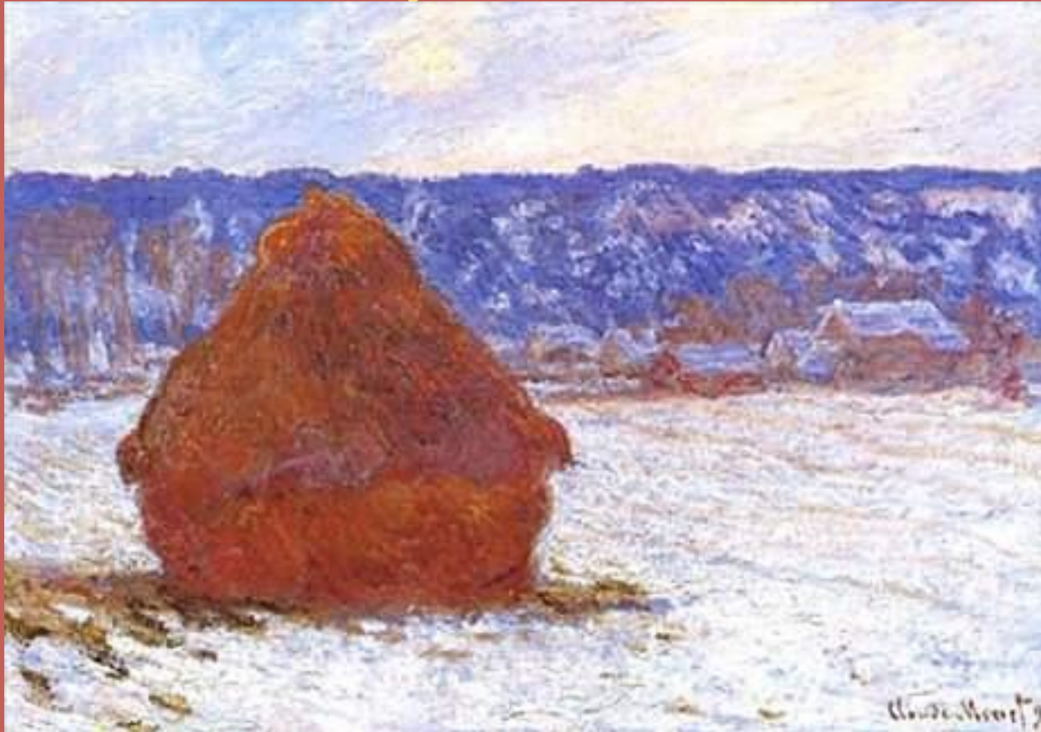
Стога сена. Иней.