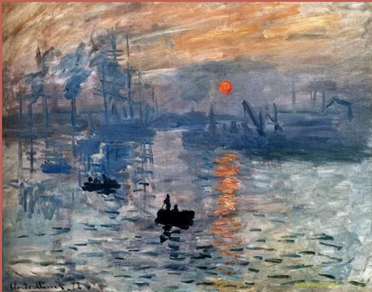
Впечатление. Восход солнца.