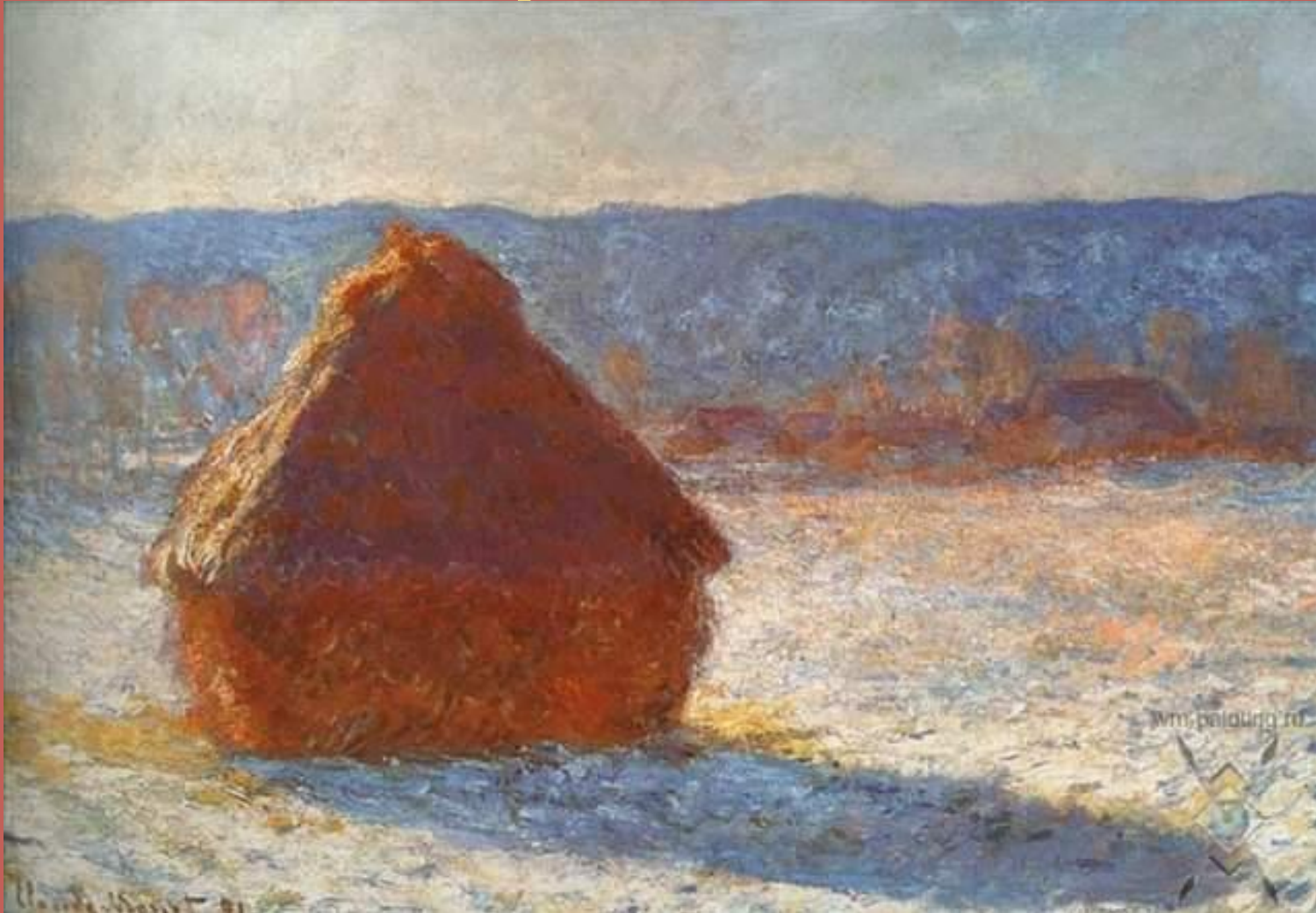
Стога сена. Эффект снега. 1891 года