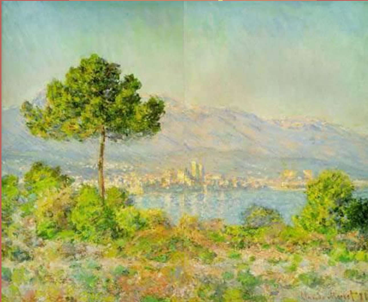
Пиния в Антибе 1888 год