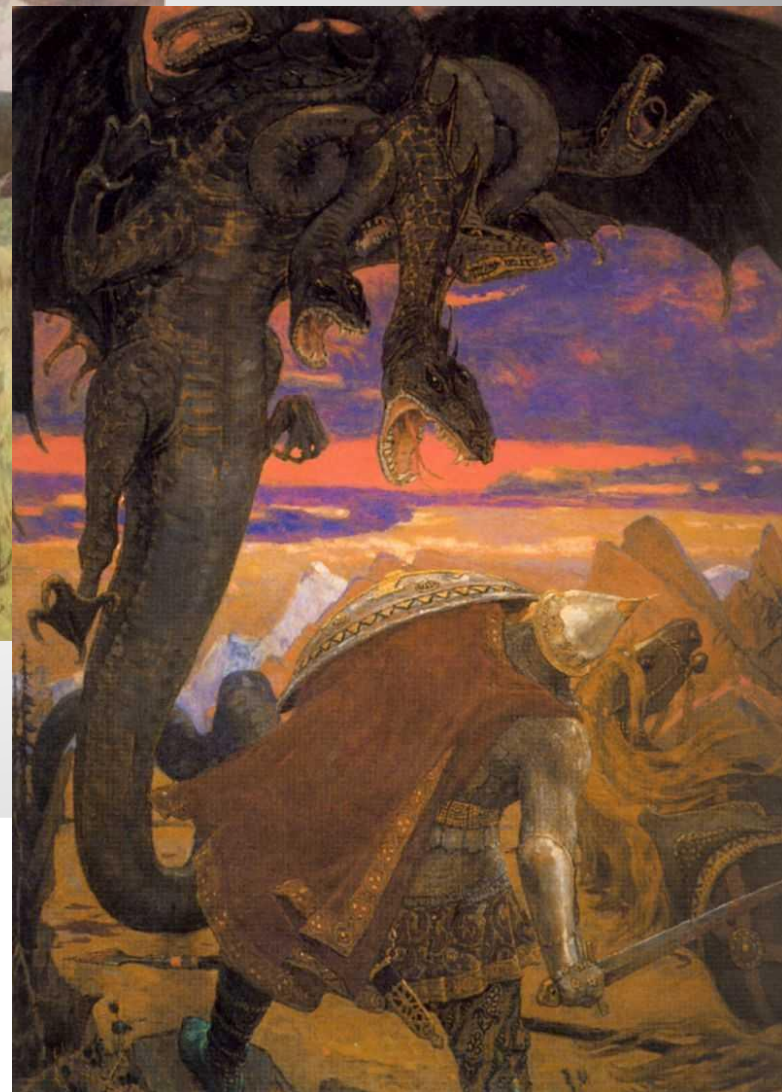
Битва со змеем