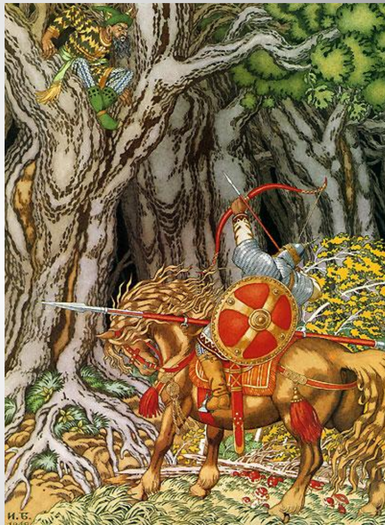
Илья Муромец и соловей-разбойник