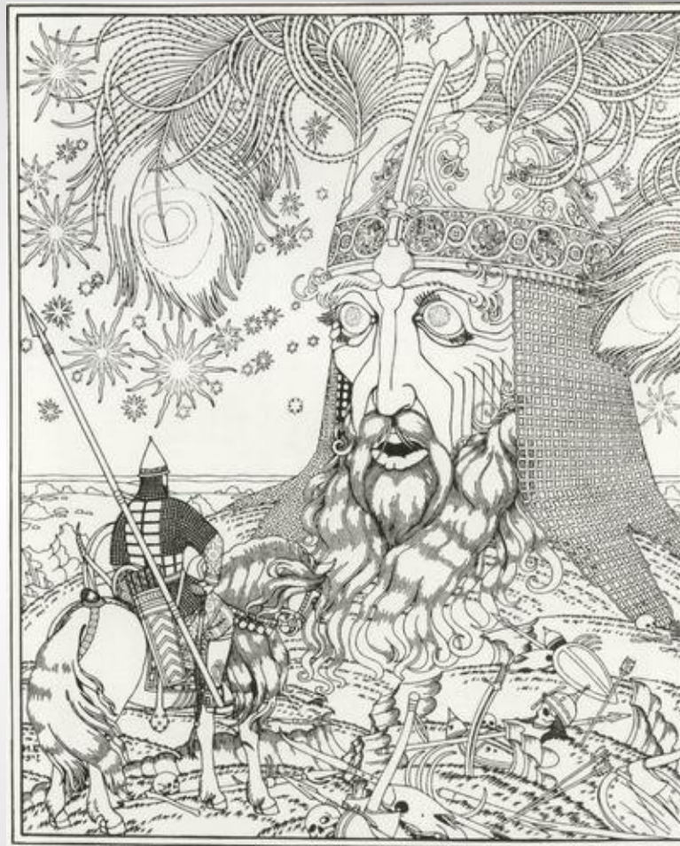
Руслан и Людмила