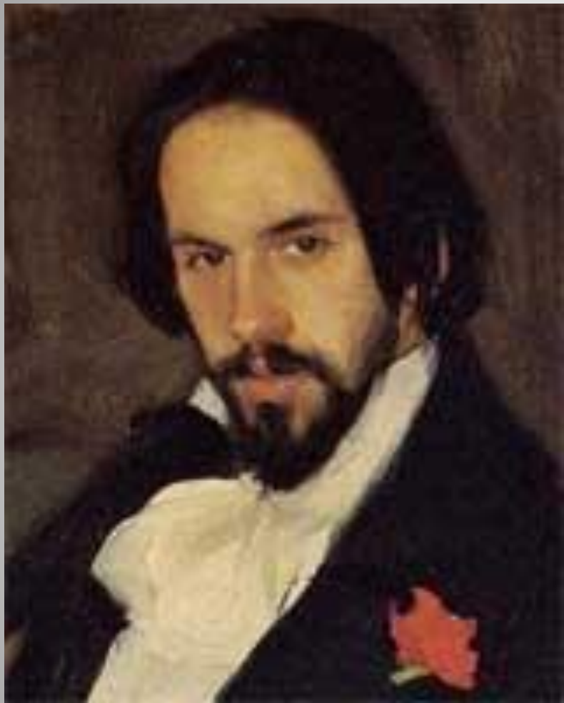
Иван Яковлевич БИЛИБИН (1876-1942)

И. Я. Билибин – иллюстратор русской сказки, один из самых своеобразных и оригинальных мастеров графики, создатель особого типа иллюстрированной книги. Художник является не только автором рисунков, но и всех декоративных элементов книги – обложки, инициалов, особого вида шрифта и орнаментальных украшений.