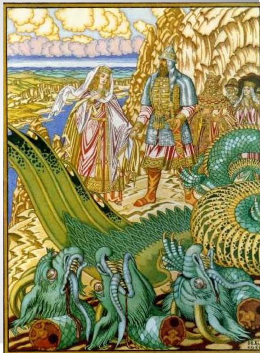
Добрыня и змей