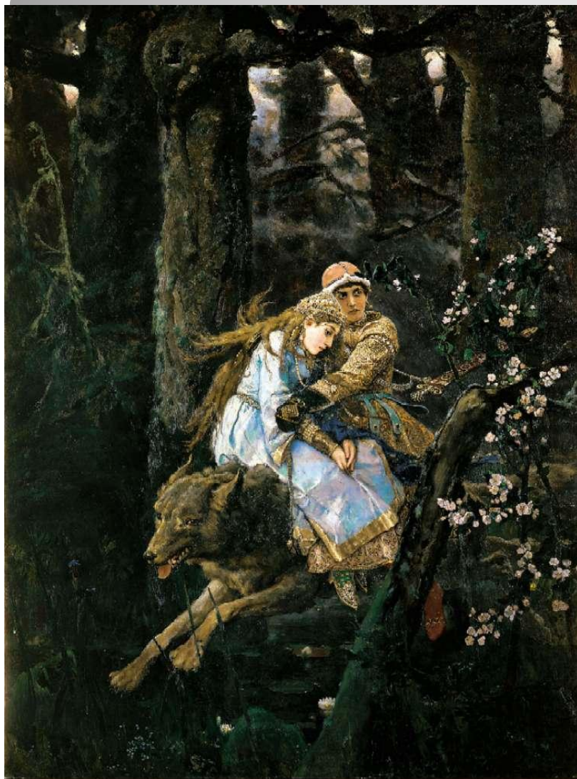
Иван-царевич на сером волке