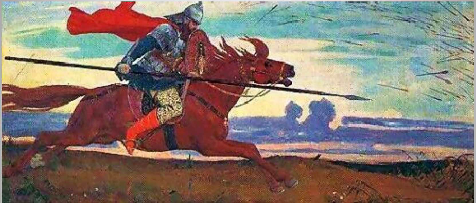
Один в поле воин