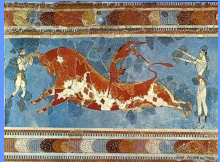
Фреска "Акробаты с быком",