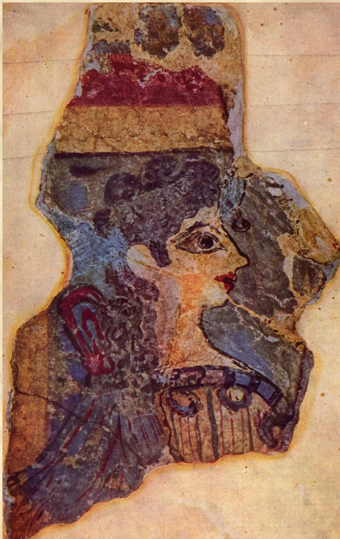
Фреска «Парижанка», жрица божества, XV век до н. э.