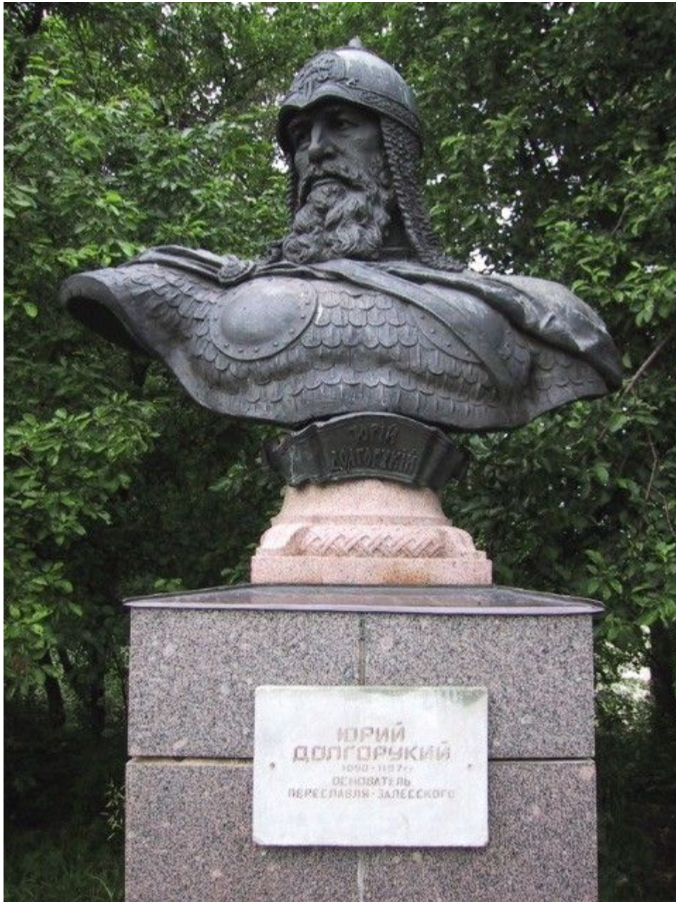
Памятник Юрию Долгорукому – основателю Переяславля-Залесского.