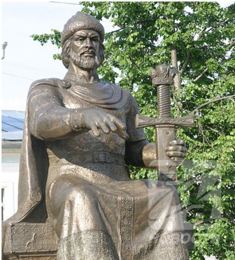
Памятник Юрию Долгорукому – основателю Костромы.