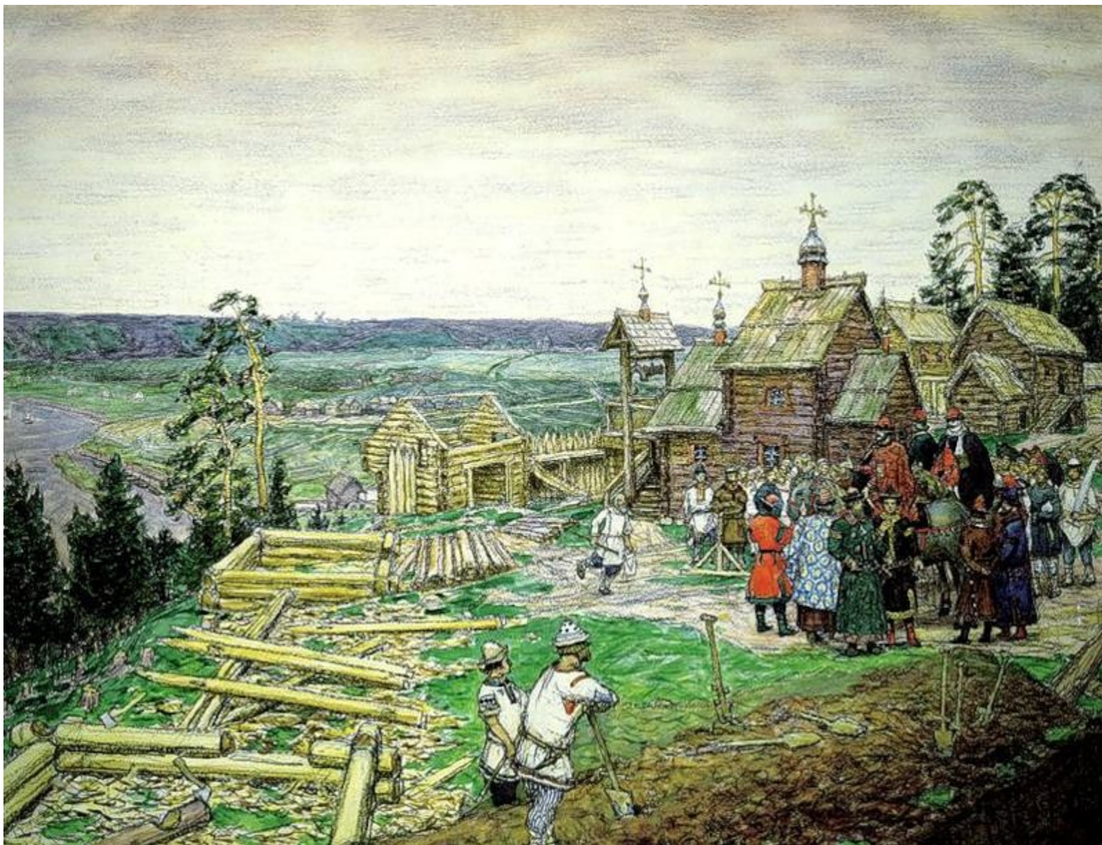
Юрий Долгорукий называет село Кучково Москва.