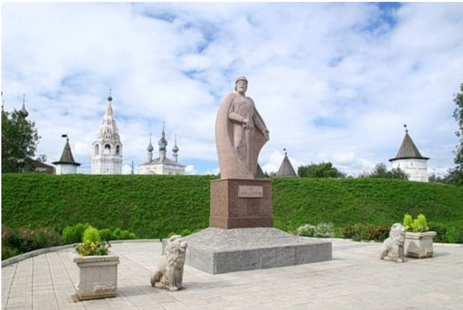
Памятник Юрию Долгорукому - основателю Юрьева-Польского