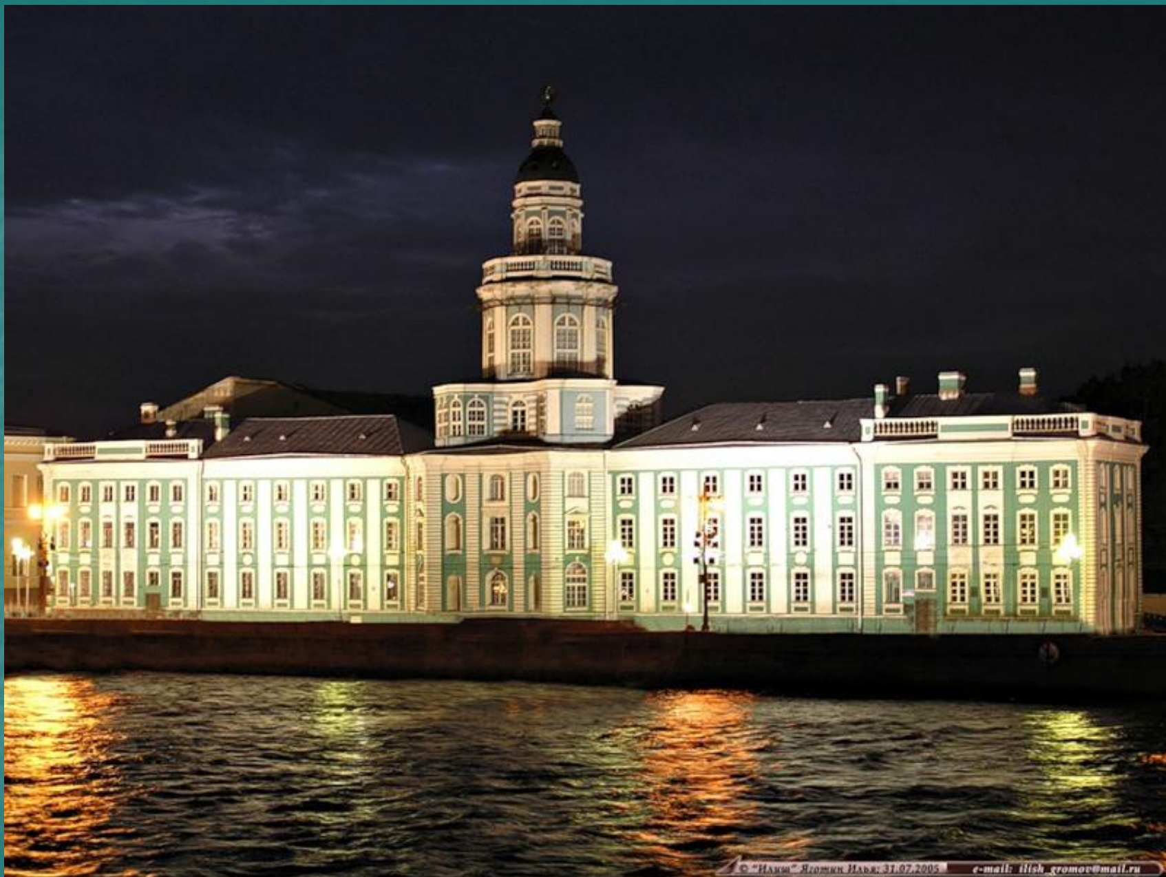
Васильевский остров, Кунсткамера