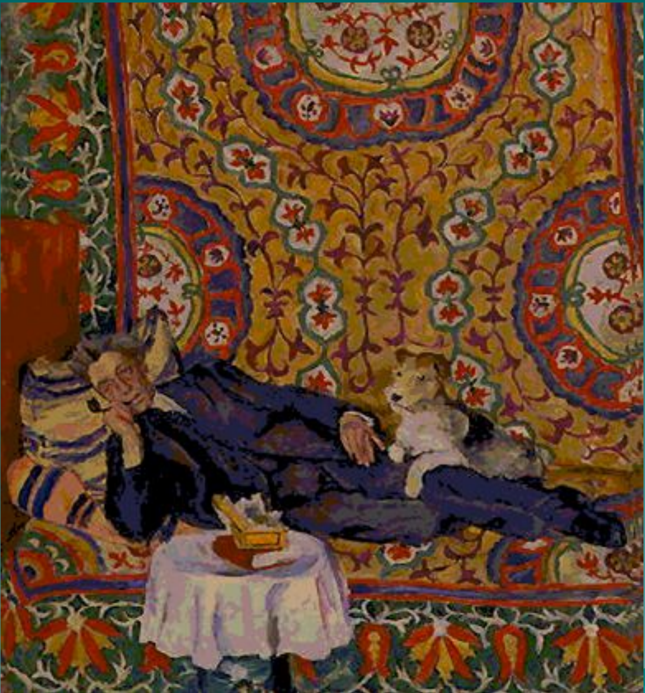
Портрет Ш. Ш. Коңчаяловского