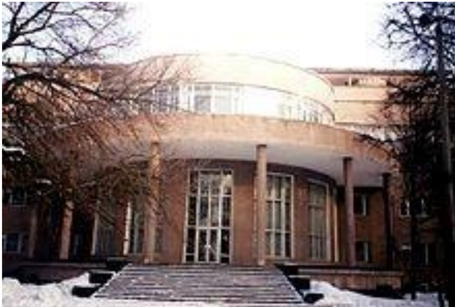
Дом Культуры ЗИЛ. Арх. братья Веснины