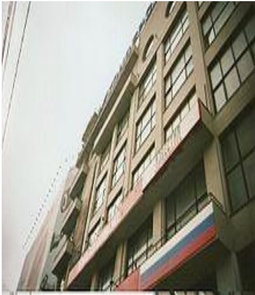
Здание газеты «Известия»