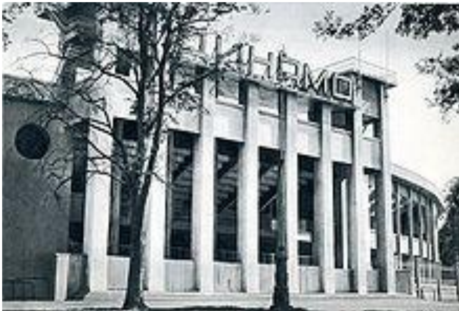
Стадион «Динамо», Москва