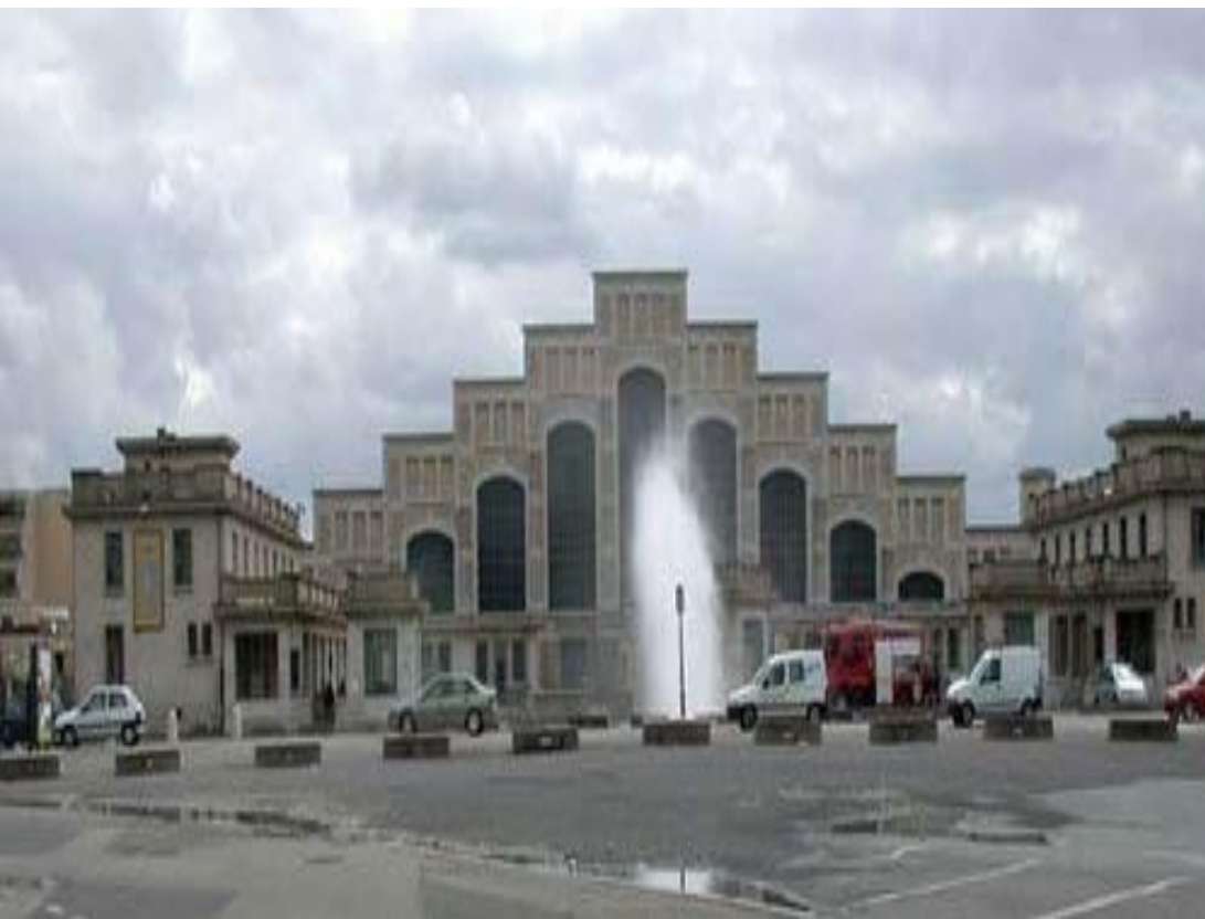
Олимпийский стадион. Лион. Архитектор Тони Гарнье