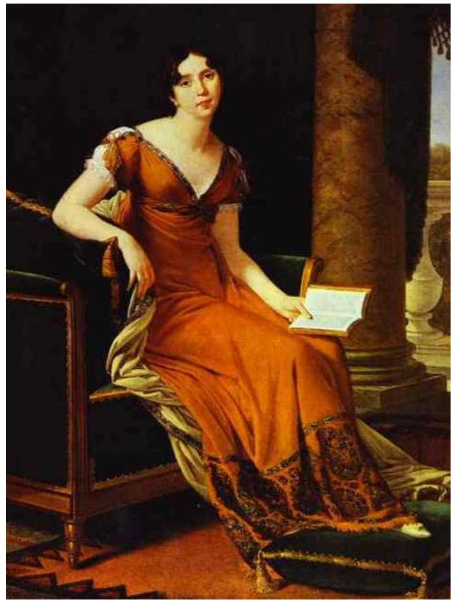
Портрет Елизаветы Демидовой (Строгоновой ) Художник Роберт Лефевр