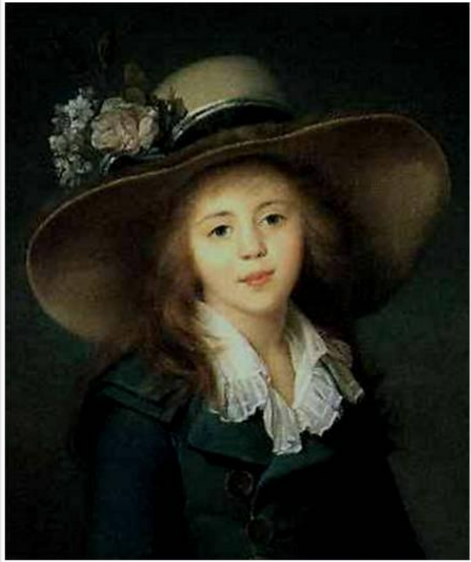
Жан – Луи Вуаль Портрет девочки в шляпе.