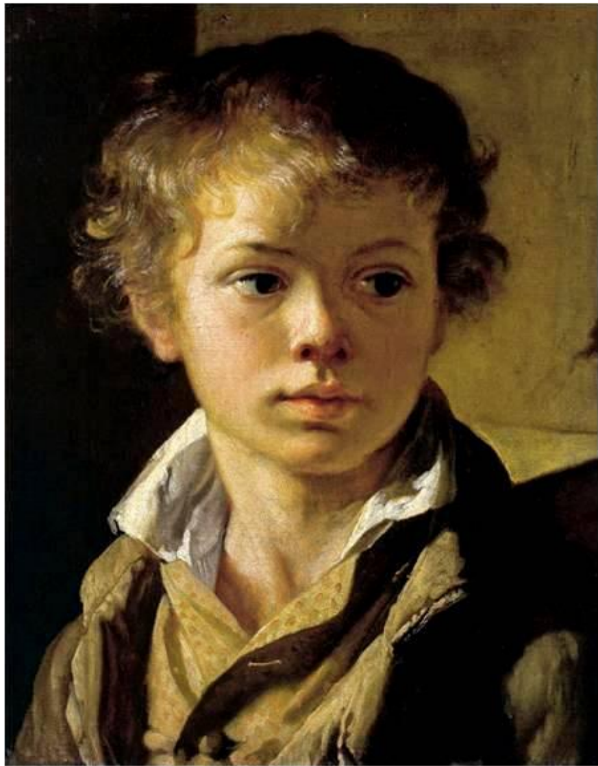
В. А. Тропинин Портрет сына.