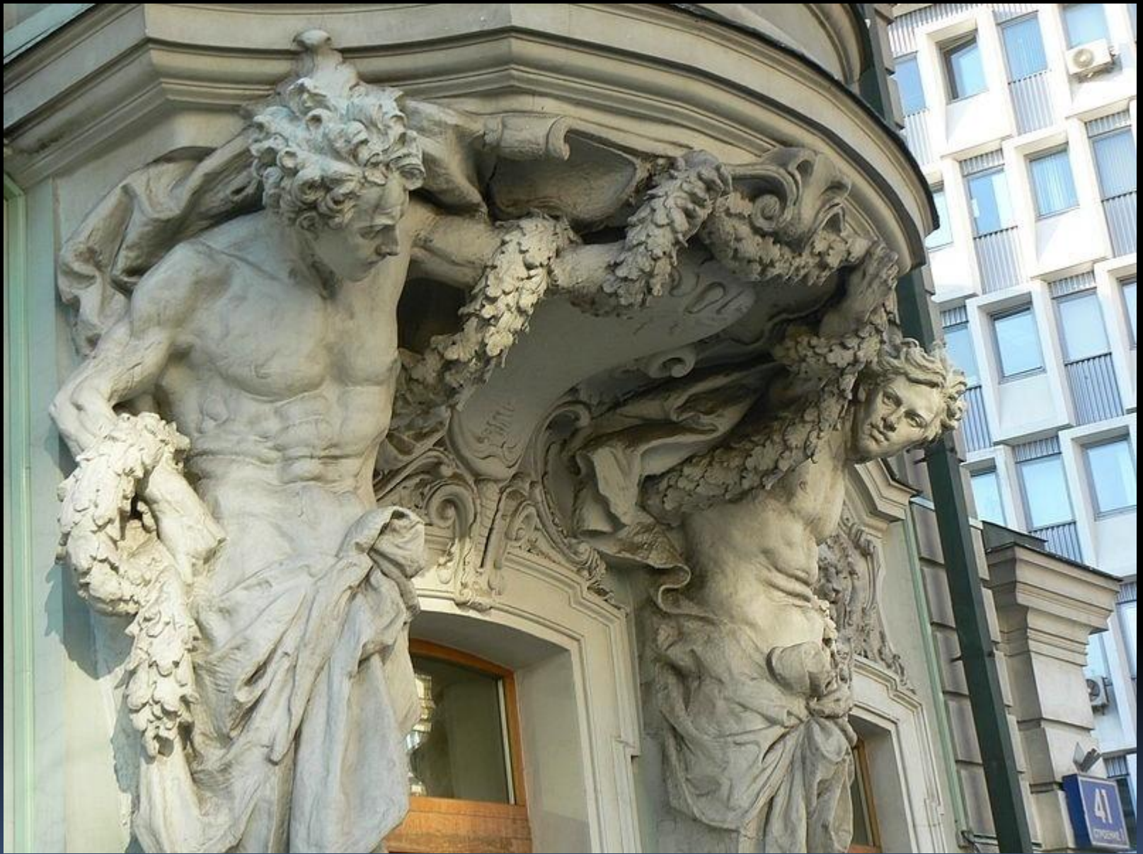
■ Атланты, 1893