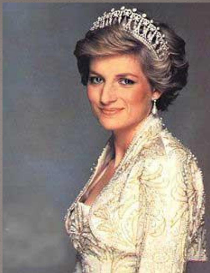
Диана Спенсер. Родилась в 1961г. Принцесса Уэльская. Первая жена принца Чарльза. Погибла в 1997г. в авткатастрофе.