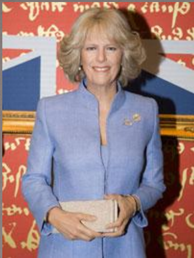
Камилла Паркер Болз. Родилась в 1947г. Герцогиня Корнуольская. Вторая жена принца Чарльза.