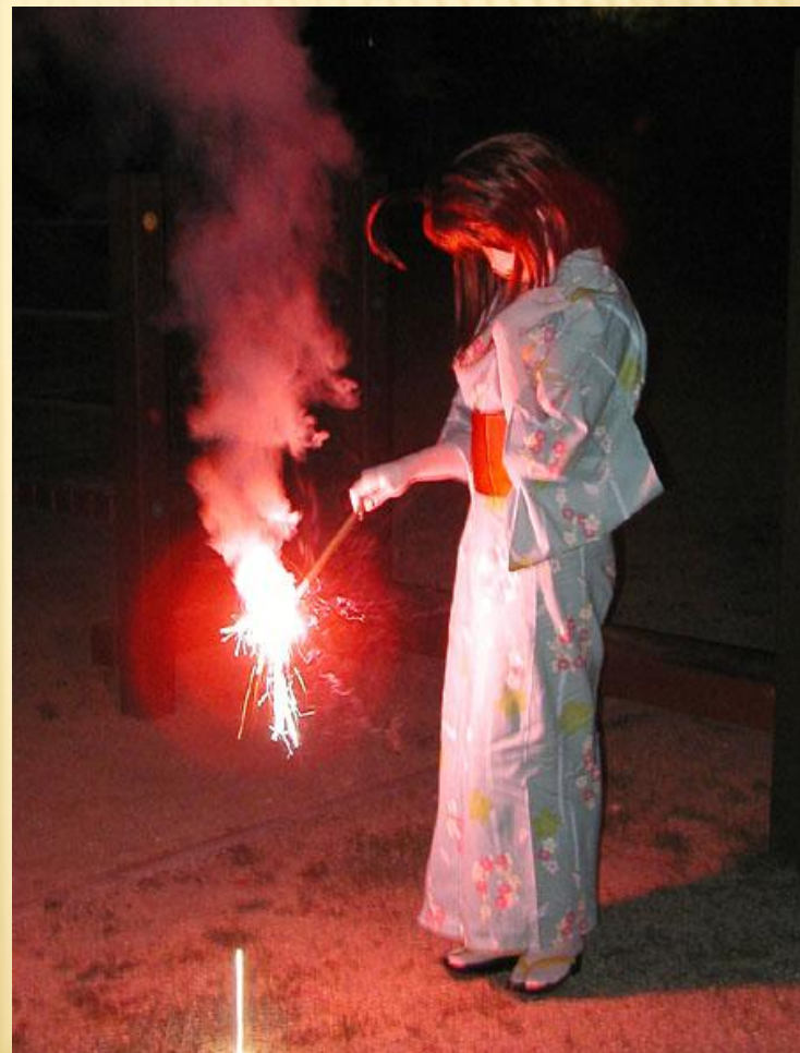
Юката-традиционный японский костюм