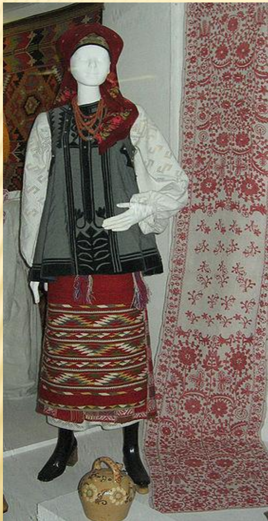
Женский центральноукраинский костюм

Костюм (от лат. costume) — может означать одежду в общем или отличительный стиль в одежде.