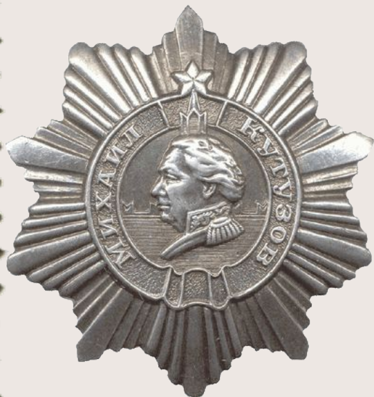
Орден Михаила Кутузова 3-й степени