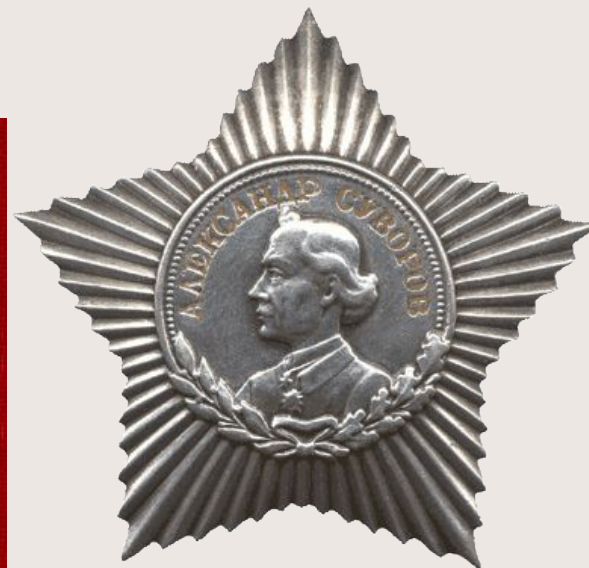
Орден Александра Суворова 3-й степени