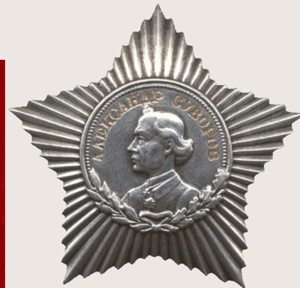
Орден Александра Суворова 3-й степени