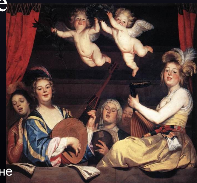
Г.Хонтхорст. Концерт на балконе