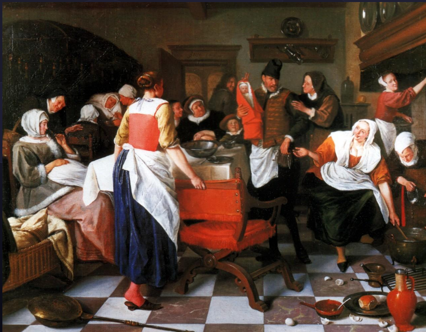
Ян Стен. Крестины.