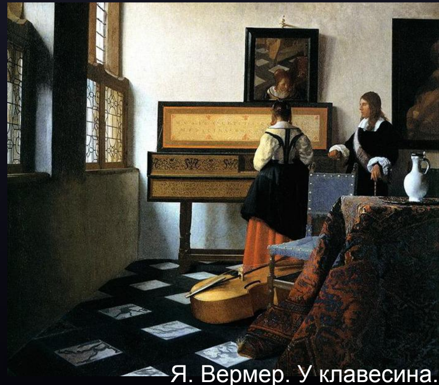
— Я. Вермер. У клавесина.