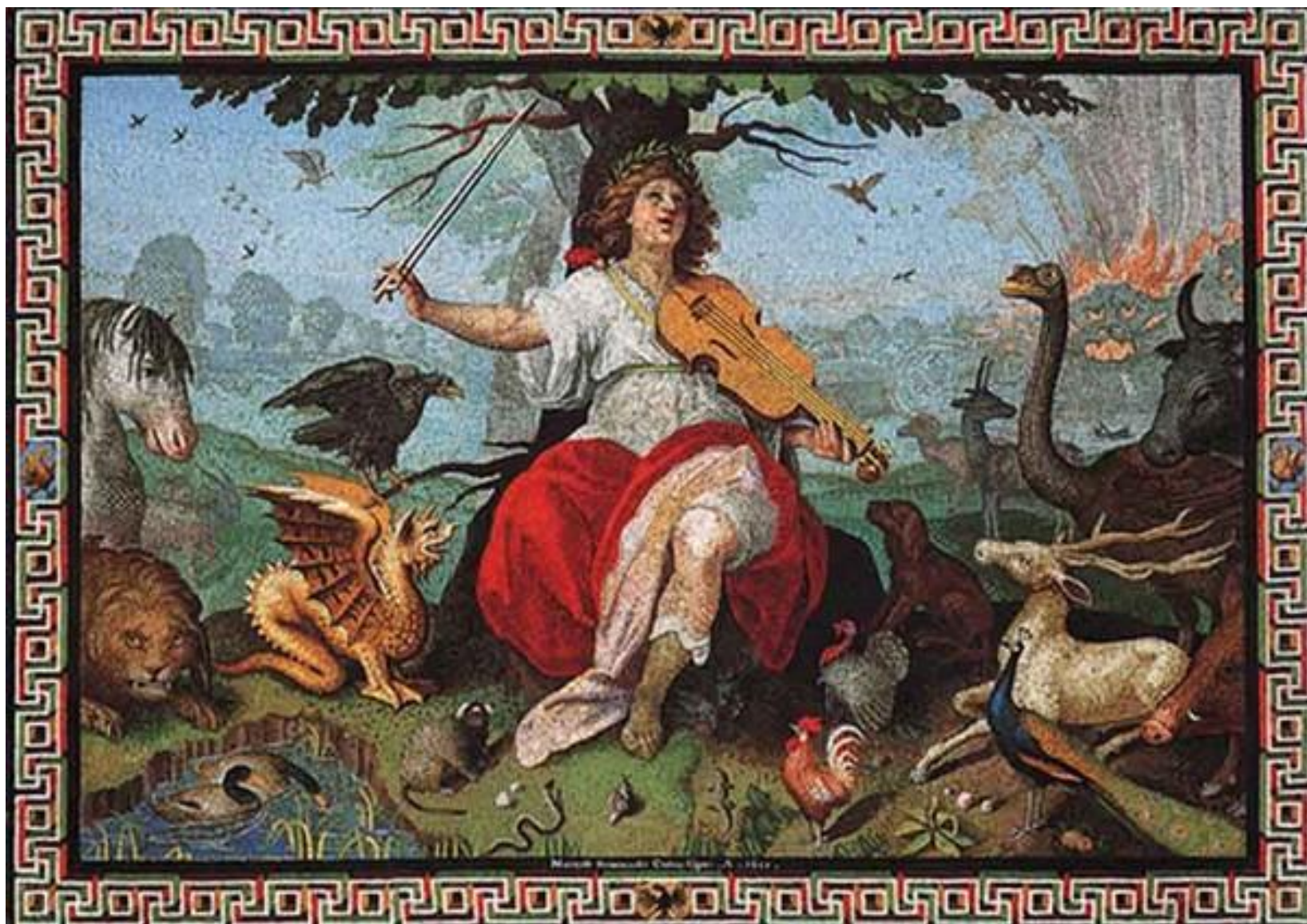
Опера « Орфей и Эвридика»