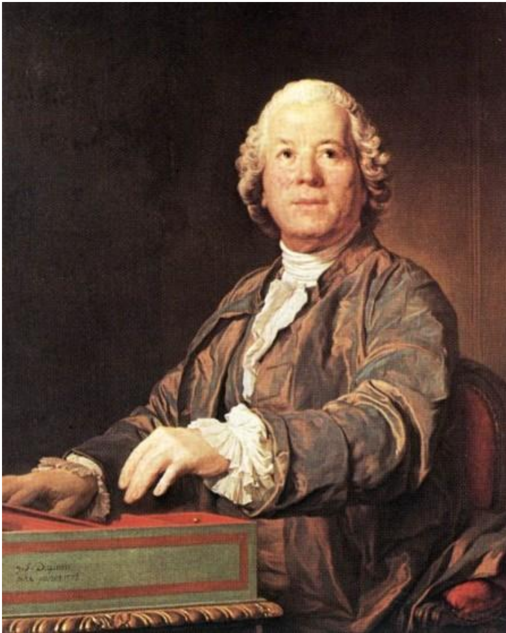
Кристоф Виллибальд Глюк