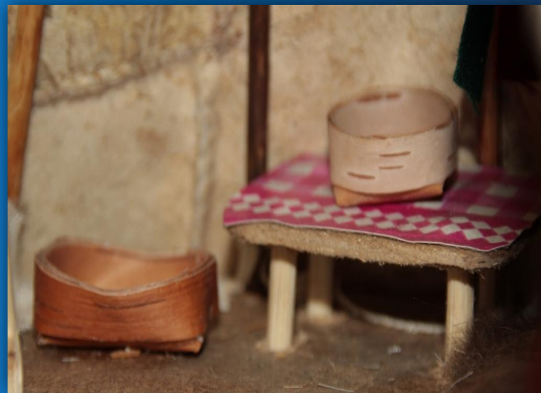
Берестяная утварь и традиционный столик внутри кукольного чума. Экспонат ГУ «ЯНОМВК им. И. С. Шемановского»