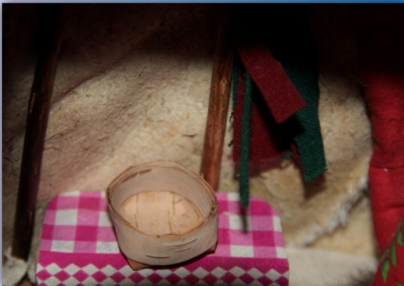
Полог внутри кукольного чума. Экспонат ГУ «ЯНОМВК им. И. С. Шемановского»