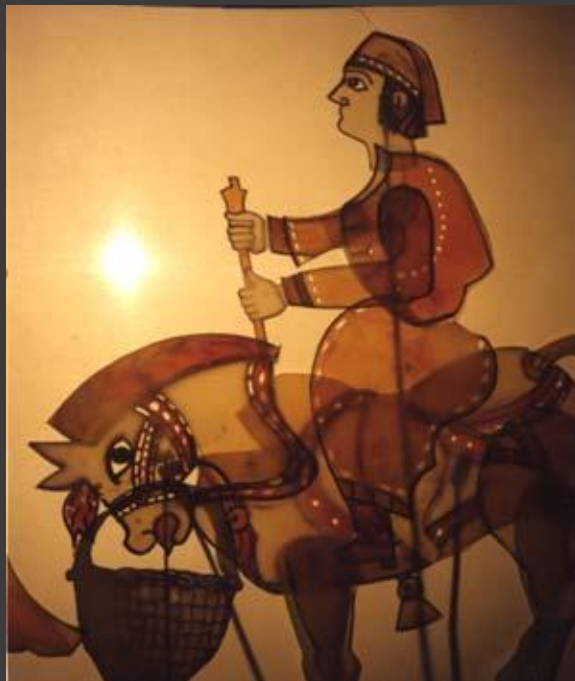
6. Куклы театра теней