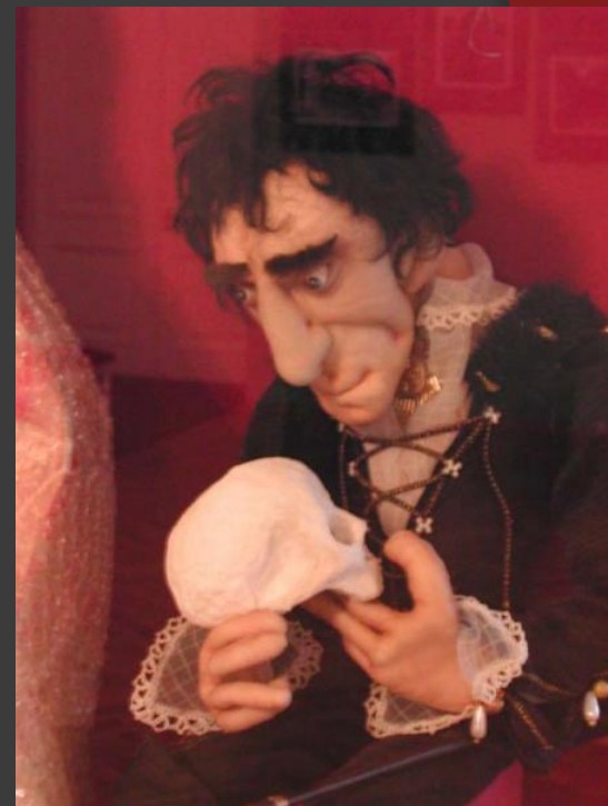
7. Мимирующая кукла