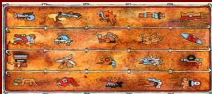
Рисунок на коже календаря ацтеков