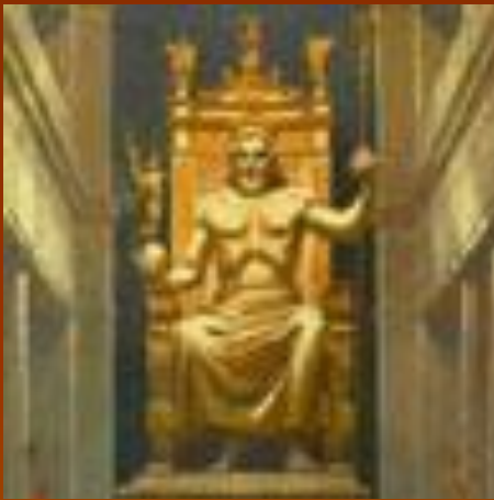
Статуя Зевса Олимпийского

Греческие скульпторы дали миру произведения, которые вызвали восхищение многих поколений.