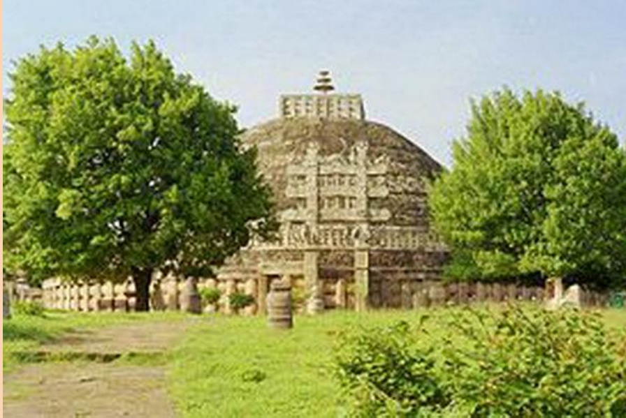
Большая ступа №1 , где хранятся реликвии Будды

Развитие древнеиндийской архитектуры имеет некоторые особенности. Памятники существовавшие до III века до н. э., не сохранились до наших дней, так как строительным материалом служило дерево. С III века до н. э. в строительстве используют камень.