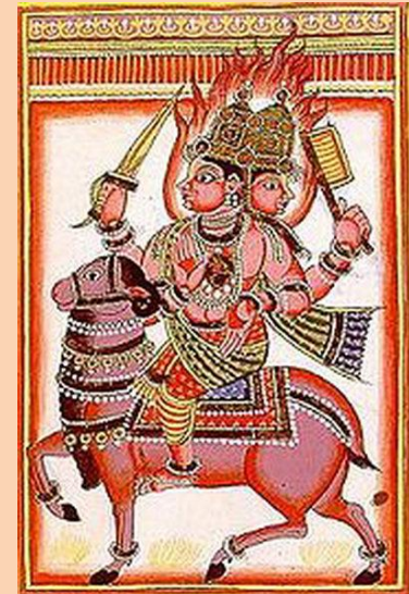
Агни – бог огня