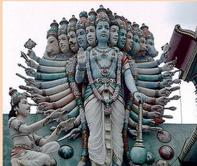
Вишну и 12 аватар - хранитель мироздания