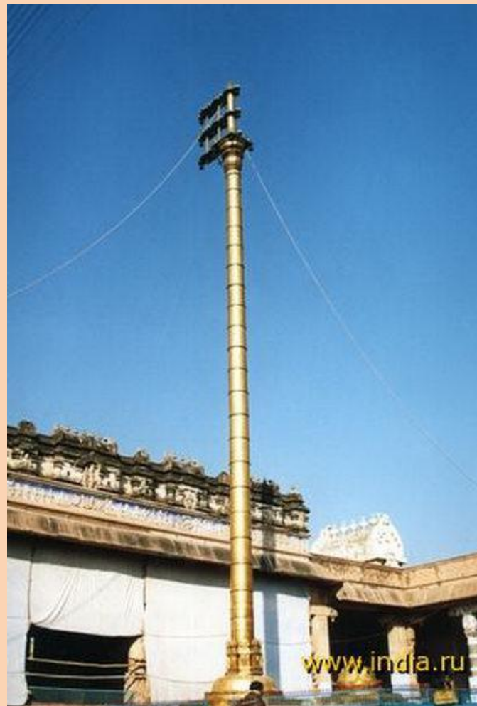
Золотая стамбха – башня со священным животным (500 кг золота)