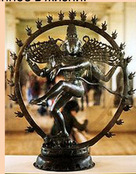
Шива - разрушитель