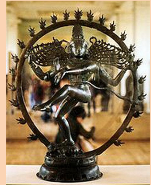
Шива - разрушитель