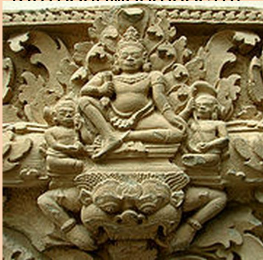
Индра- бог грозы, воитель

Первая религия Индии - ведизм — религия Вед. Для него характерно многобожие и наделение человеческими качествами животных, предметов (антропоморфность)