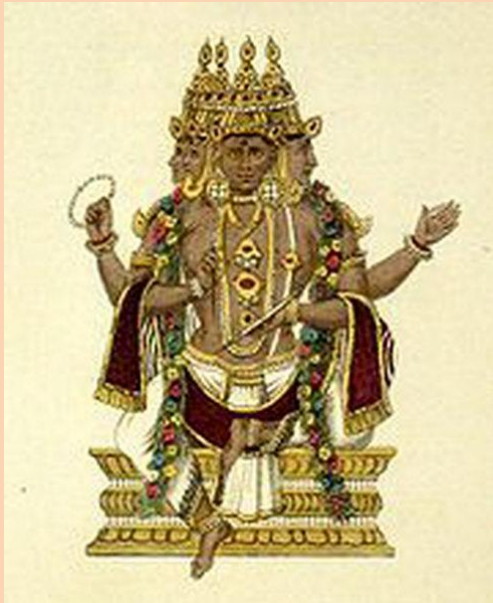
Брахма - создатель

Религия Брахманизм формируется I тыс. до н. э. Это более стройное учение о мире, множество богов сведено к троице . Постепенно брахманизм переходит в индуизм , которая является самой распространенной в Индии религией, охватывая более 80% верующих. Индуизм существует в виде направлений: вишнуизма, шиваизма, кришнаизма . В индуизм включены многие культы через концепцию аватары (воплощений) Вишны. То есть Вишна нисходит в мир, перевоплощаясь в различные образы (принимает облики Рамы, Кришны и Будды). " Бхагаватгита " - священное писание индуизма. Основу индуизма составляет учение о вечном переселении душ ( сансара ), происходящем в соответствии с законом воздаяния (карма) за все содеянное в жизни.