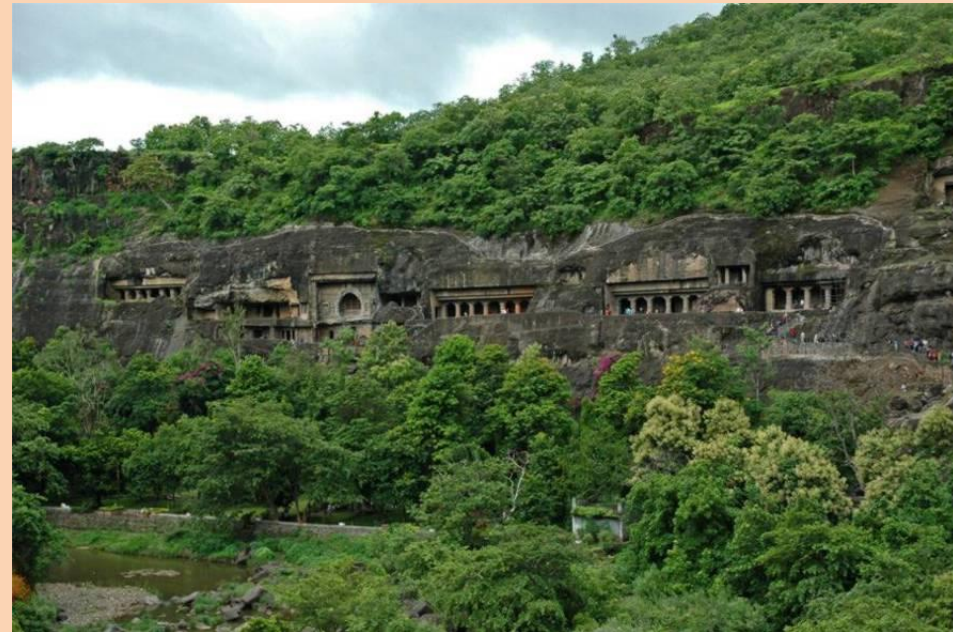
Пещерный храм в Аджанте (империя Гуптов)