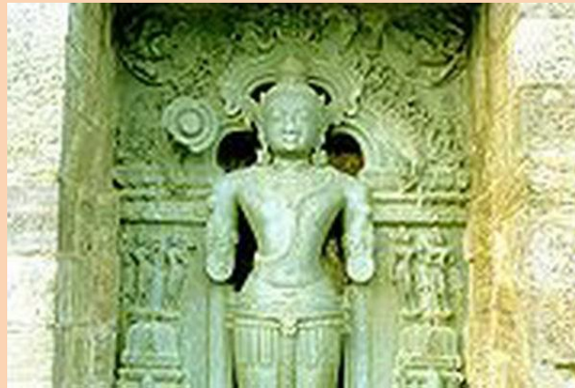
Сурья- бог солнца