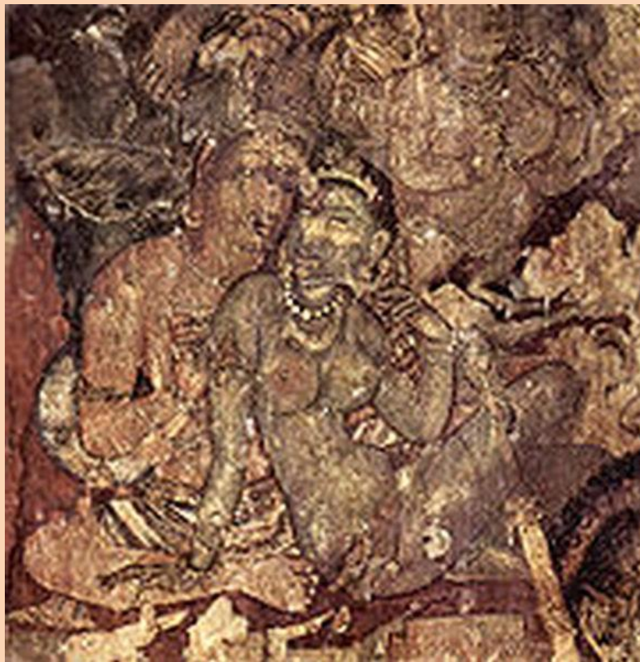
Древняя фреска из Храма Аджанты ( при Гуптах)