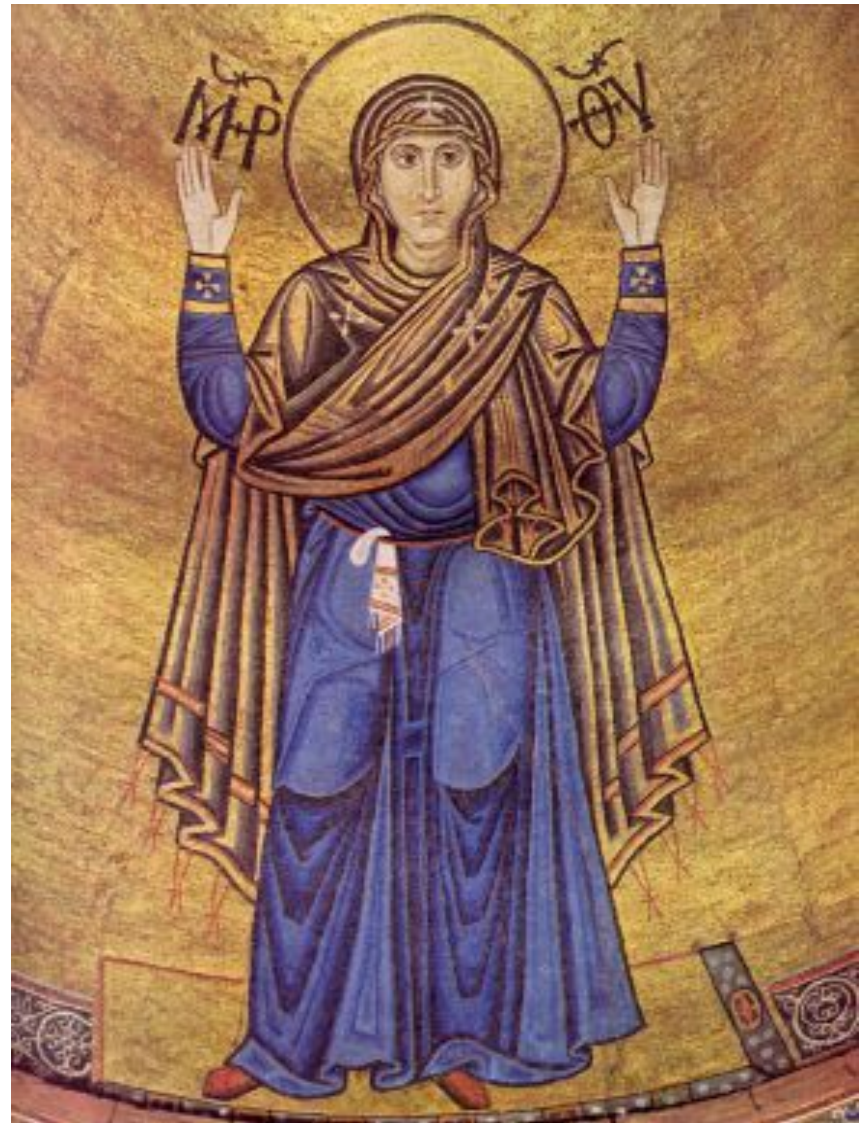
Интерьер Софии Киевской