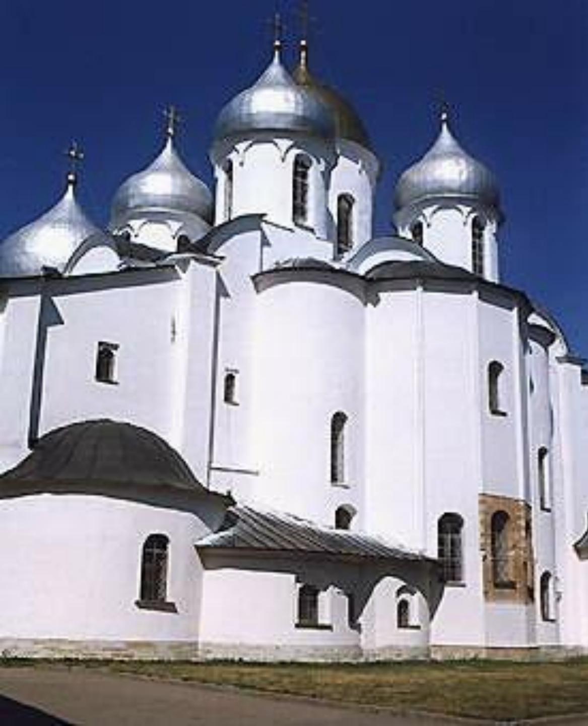
Софийский собор в Новгороде 1045-1050 гг.