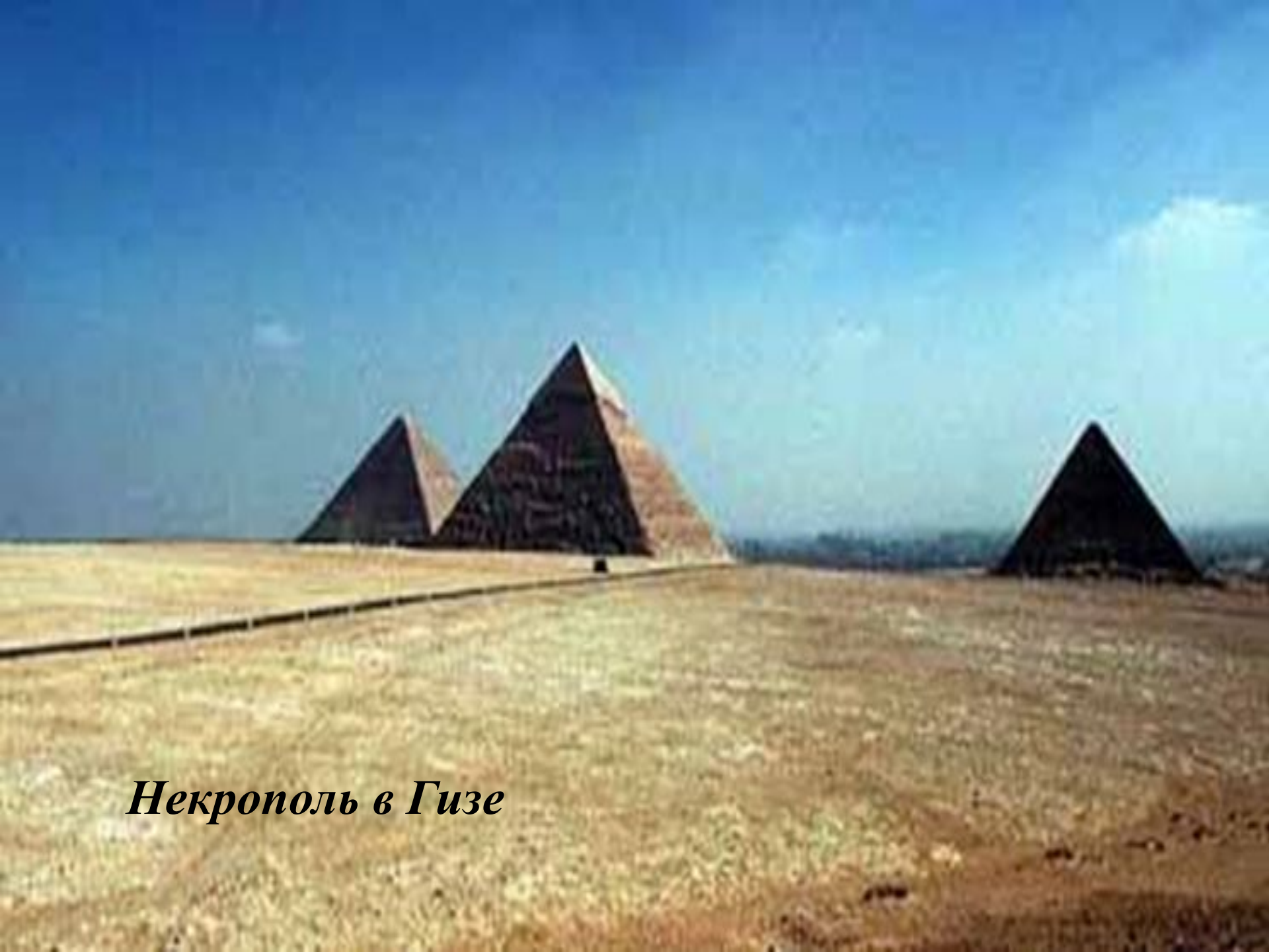
Некрополь в Гизе