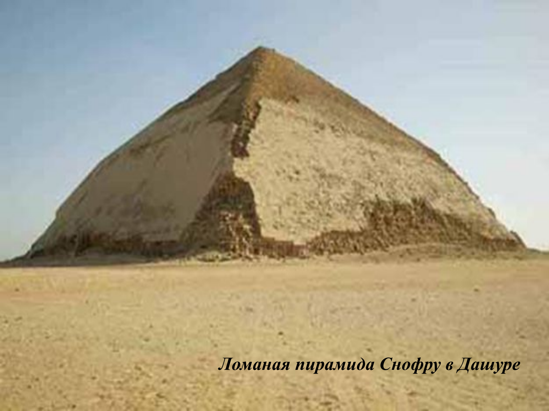
Ломаная пирамида Снофру в Дашуре