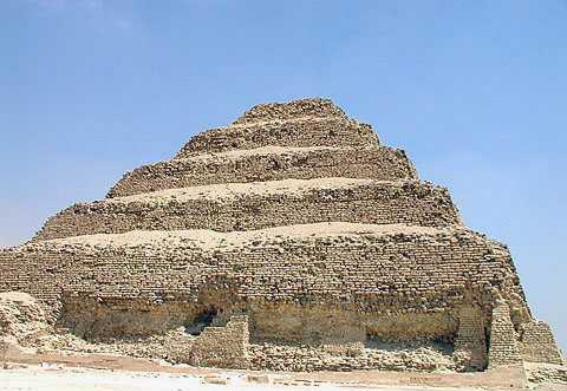
Пирамида фараона Джосера