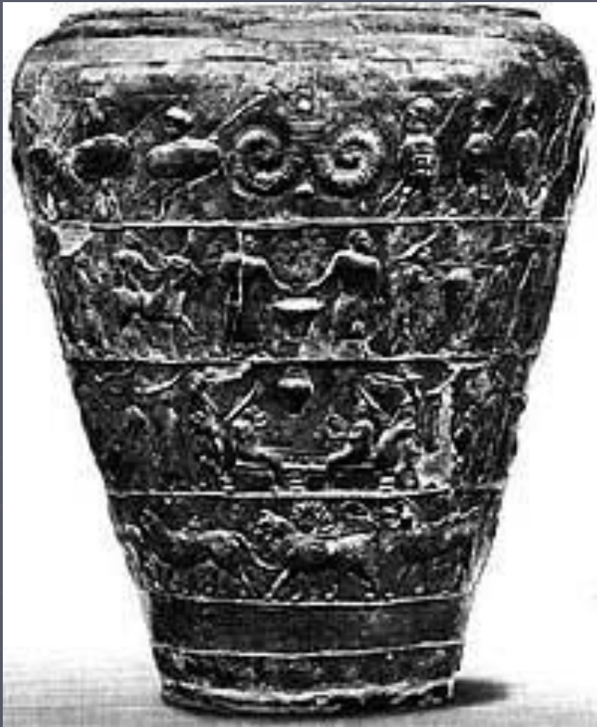
Могильник Чартоза. Ситула. Болонья. Археологический музей

В отличие от южной и западной частей Апеннинского полуострова, на севере влияние внешней торговли ощущалось слабее. Даже на Адриатическом побережье импортные предметы были довольно редкими вплоть до IV в. до н. э. Однако и здесь наблюдалась тенденция к образованию локальных центров, вокруг которых группировались более мелкие поселения. Процесс ориентализации пришел на север Италии с запозданием на столетие, через вторые руки из Этрурии. Появились новые мотивы в декоративном искусстве, в виде фриз из изображений животных, человеческих фигур и сцен из повседневной жизни. Эти приемы использовались, главным образом для украшения больших бронзовых сосудов-ведер, которые известны под латинским названием "ситула" .