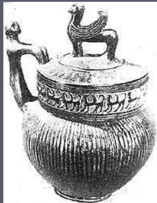
Сосуд стиля "букери" из погребения Роджолини-Галаси в Черветери. VII в. до н.э.