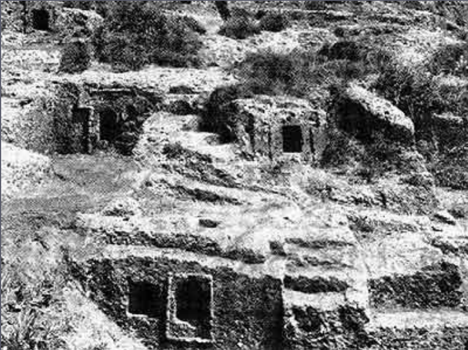
Блера. Могильник Весково. V в. до н.э.

В глубинных районах Этрурии были распространены гробницы, устроенные в склонах речных террас.