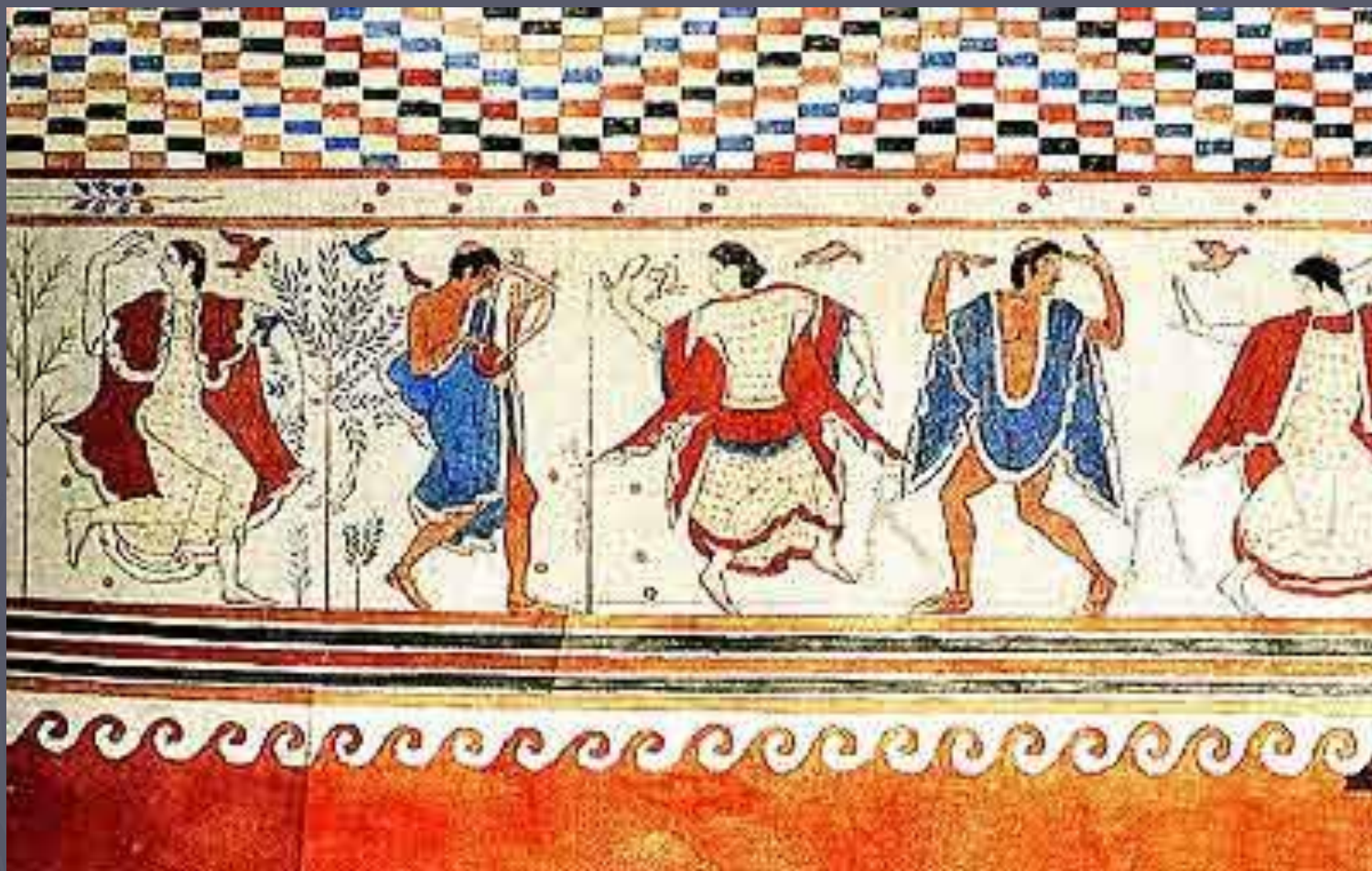
Этруски. Тарквиния. Томба делла Триклинио. (Steingraber 2000, p.15)

. Далее на север предпочитали строить наземные погребальные усыпальницы, в Тарквинии – в прибрежной зоне – широко известны богатые могильные склепы с расписанными стенами , на которых изображались сцены охоты , спортивные состязания или фестивали, по которым можно судить о жизнерадостном характере этрусков.