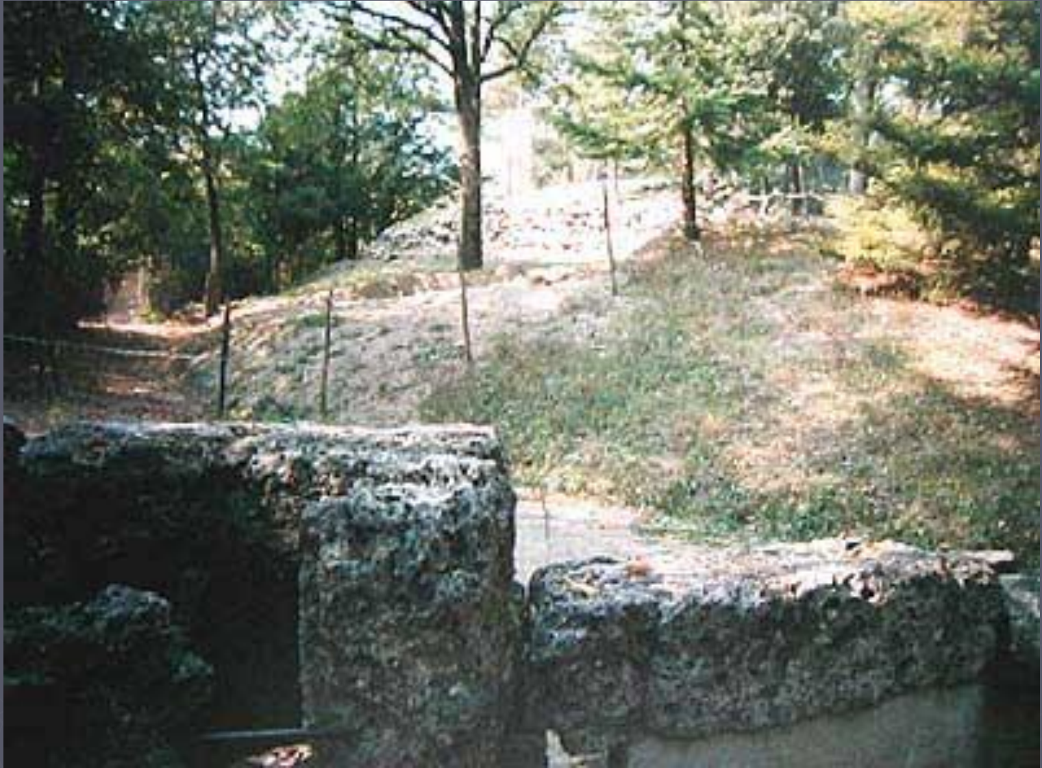
Этрусски. Марцаботто. Остатки водовода.