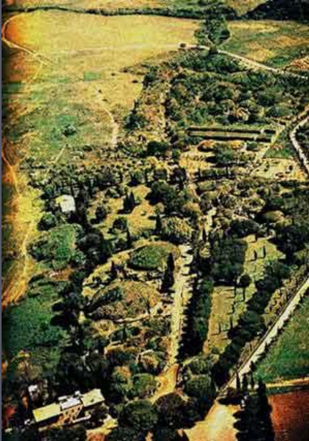
Черветери. Могильник Бандитакья. Общй вид.