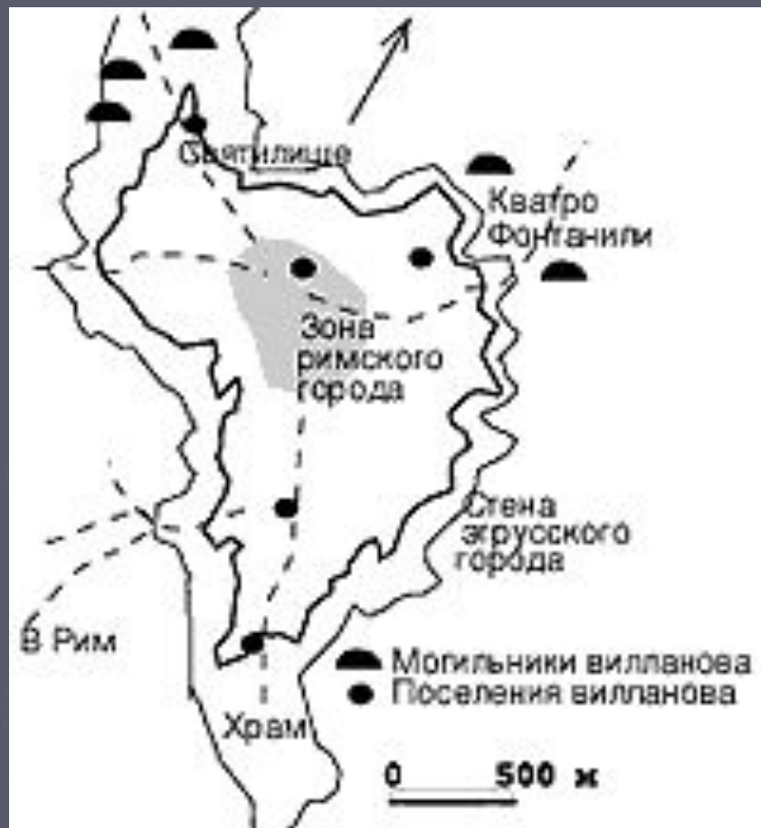
Схема расположения памятников в окрестностях г. Вей

На примере уже упоминаемого комплекса Вей , можно видеть, что города формировались из скопления маленьких деревень и кладбищ в рамках естественно укрепленных участков возвышенных плато. Однако примерно до VII или VI в. до н.э. в их планировке отсутствовала какая-либо регулярность. Позже – около V в. до н.э. – такие агломерации начали расширяться за счет включения новых земель и обноситься массивными каменными стенами. Внутренняя планировка имела уличный характер. В центре строились общественные и религиозные здания. Вне Этрурии – в долине р. По, занятой этрусками в период между VI и IV вв. до н.э., города имели несколько другой вид, развиваясь по заранее выработанному строгому плану.