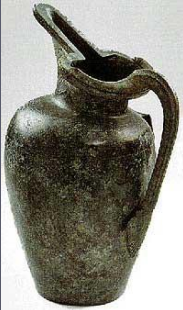
Сосуд из Безансона. 350 г. до н.э.

Многие предметы импортировались в Этрурию из стран Ближнего Востока и Африки через греческую или финикийскую торговые сети. Было очень распространено подражание греческой керамике геометрического стиля. Местное металлургическое производство достигло довольно высокого уровня развития, в нем стали употребляться новые технологические приемы, например, филигрань и зернь. Появилось много богато украшенных бронзовых сосудов, подобных широко распространенным к северу от Альп кувшинам с клювовидным сливом .