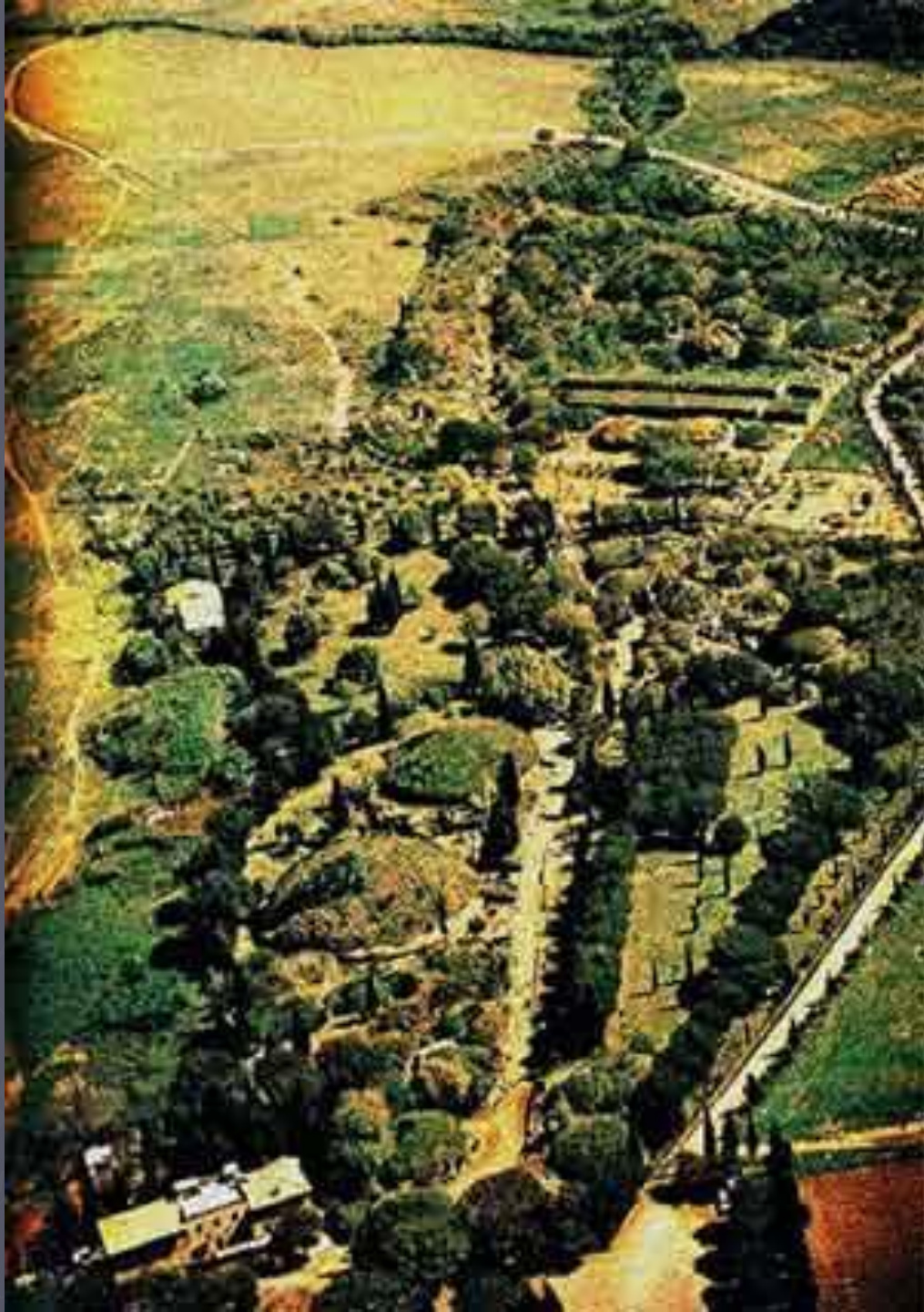
Черветери. Могильник Бандитакья. Общй вид.