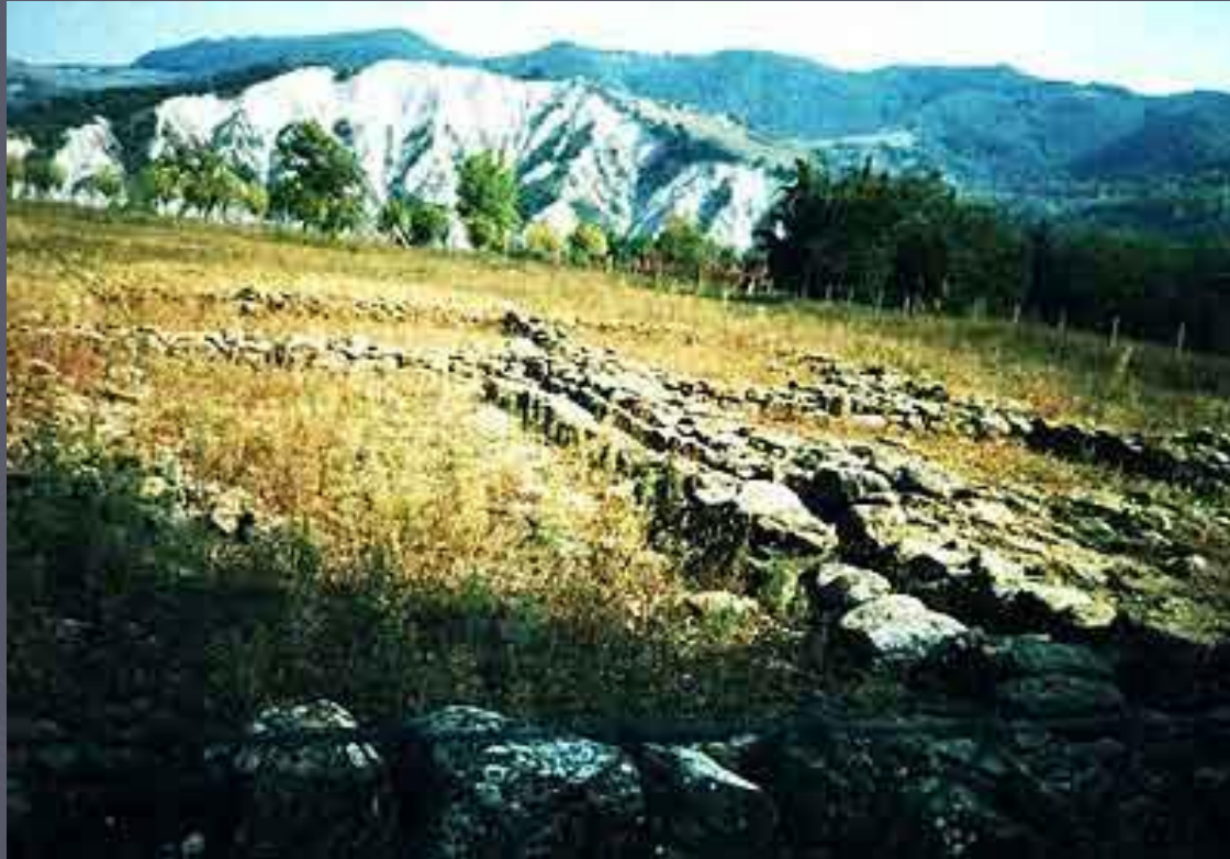
Марцаботто. Общий вид.

Одними из наиболее исследованных северных городов являются порт Спина на Адриатике и колония Марцаботто, контролировавшая торговый путь с севера на юг через Апеннины, связывавший Этрурию с Болоньей и долиной р. По. Марцаботто был основан в VI в до н.э., но формально его становление произошло в следующем столетии. Планировка города была удивительно регулярной.