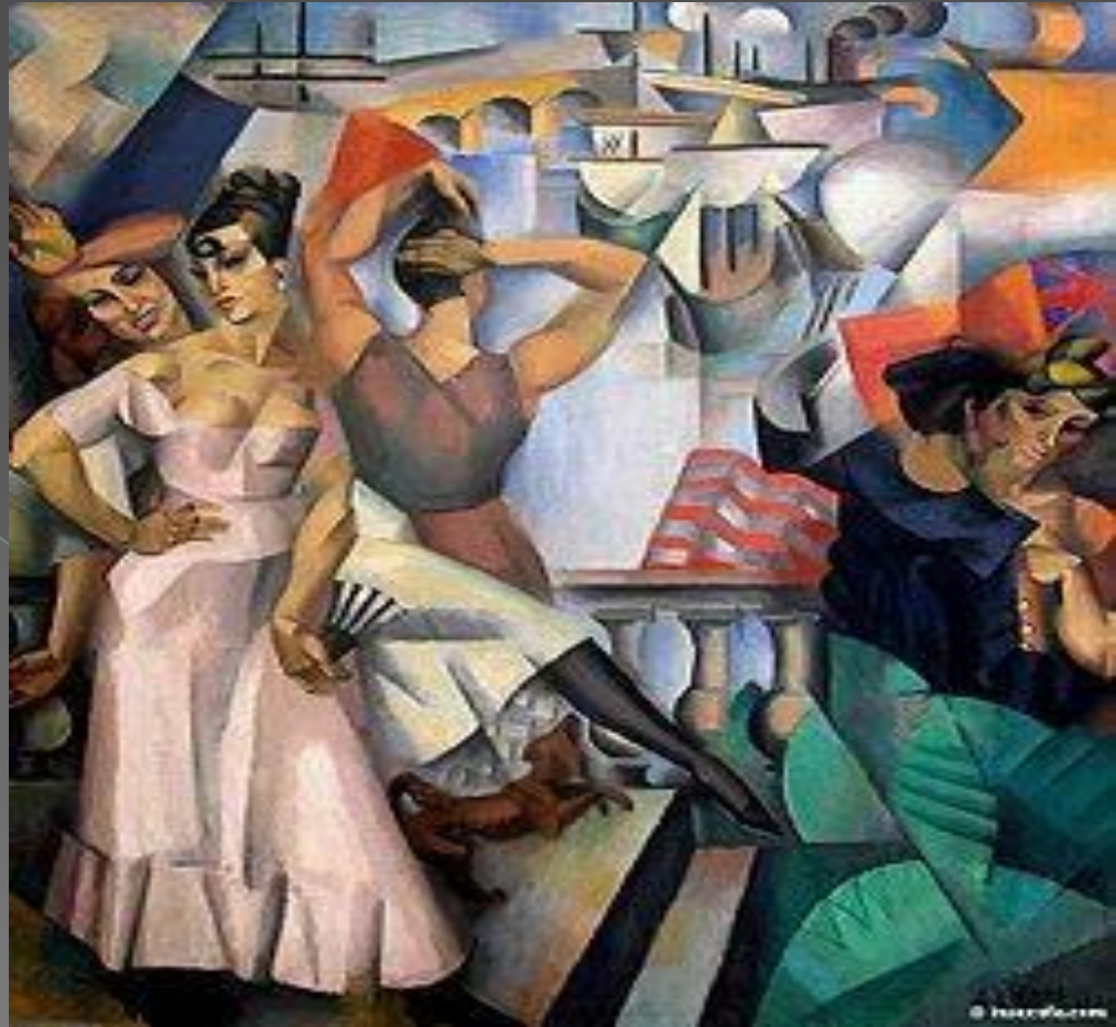
Андре Лоте «Париж»