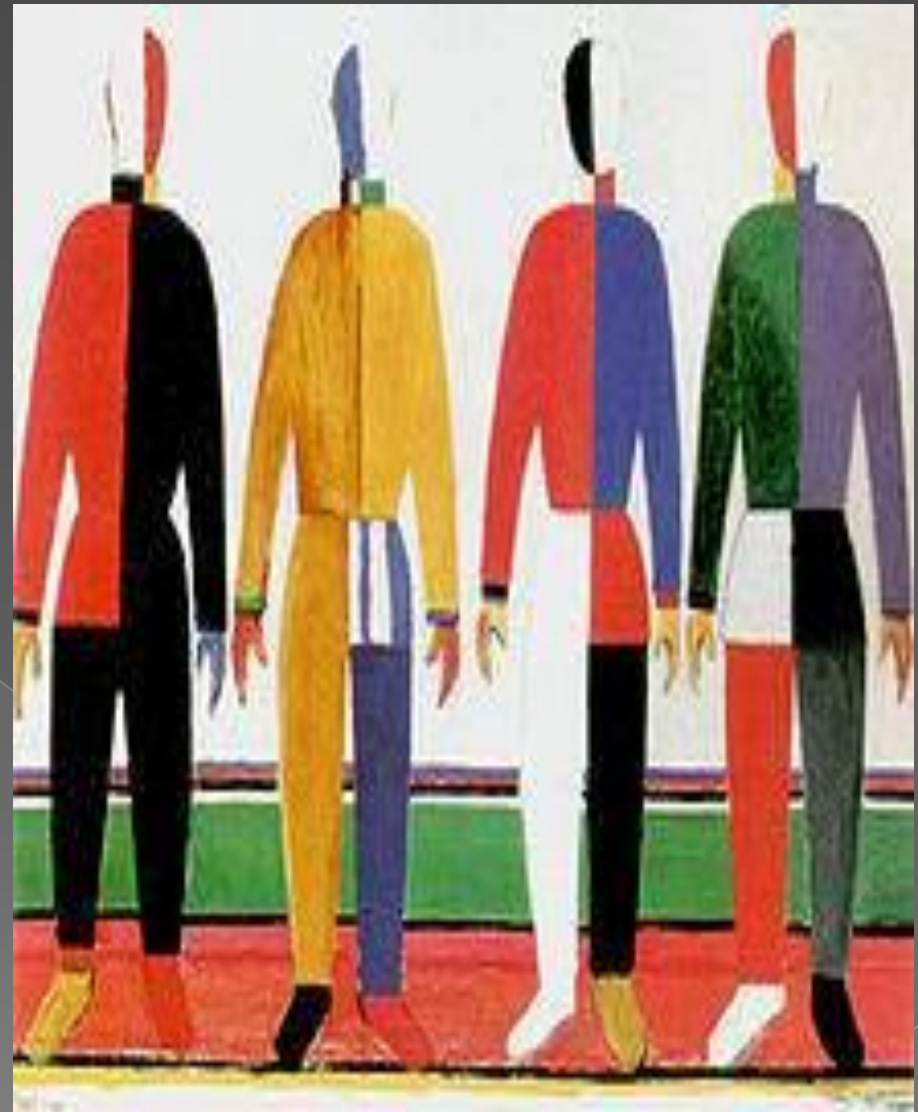
Казимир Малевич «Атлеты» 1933г.