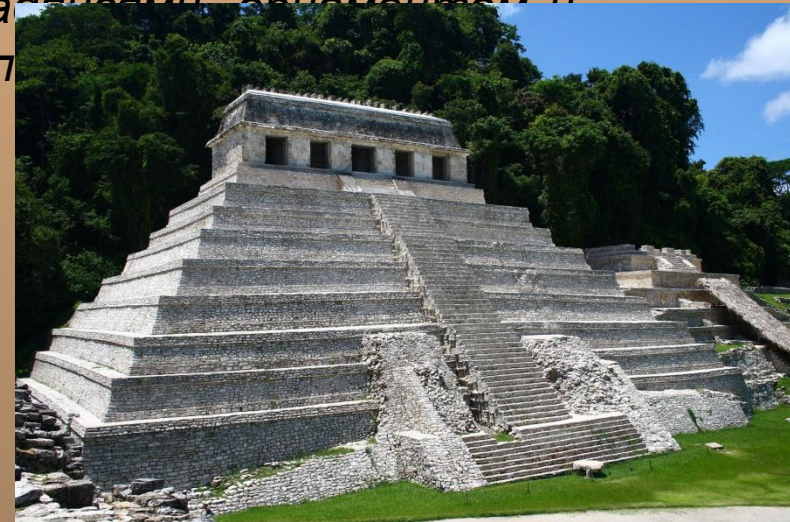
«Храм надписей» в Паленке

сооружения К типу церемониальных построек относились пирамиды, которые служили основанием храма, поднимая его как можно выше к небу; чаще всего храмы располагались именно на вершинах пирамид. Они были квадратными в плане, имели тесное внутреннее пространство (из-за толстых стен), украшались надписями, орнаментами и выполняли роль