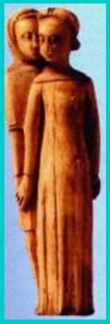
Петрарка и Лаура. Скульптура н. 15 в.

Основателем гуманизма считается знаменитый поэт Франческо Петрарка, мечтавший о возрождении былой славы Рима