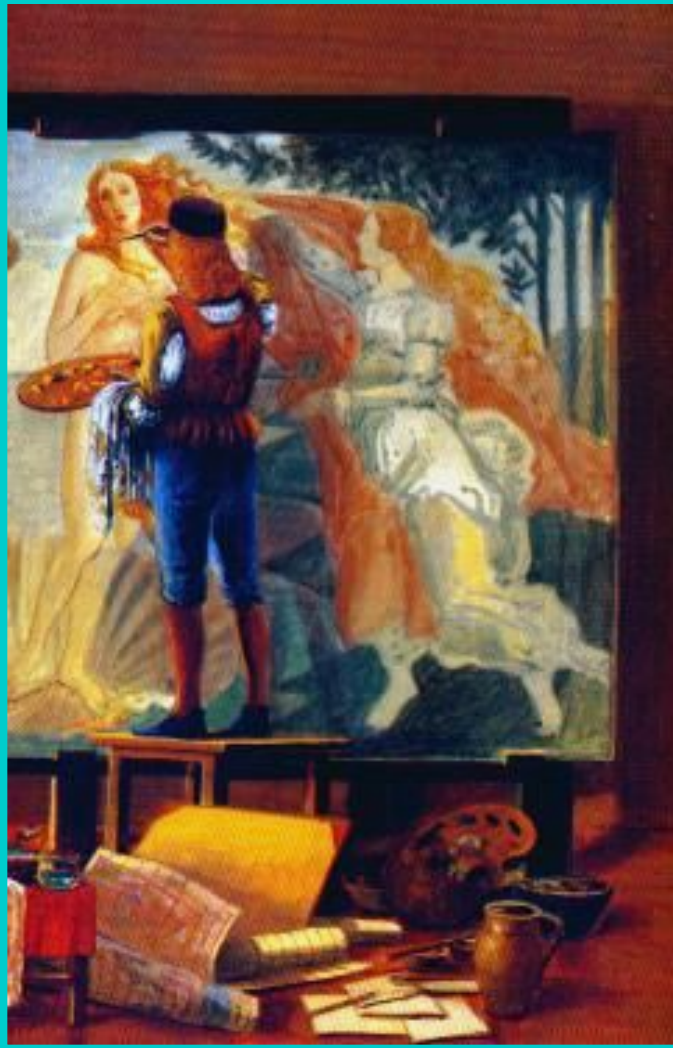
С.Боттичелли работает над «Венерой».

Одним из самых замечательных живописцев Раннего Возрождения был Сандро Боттичелли.