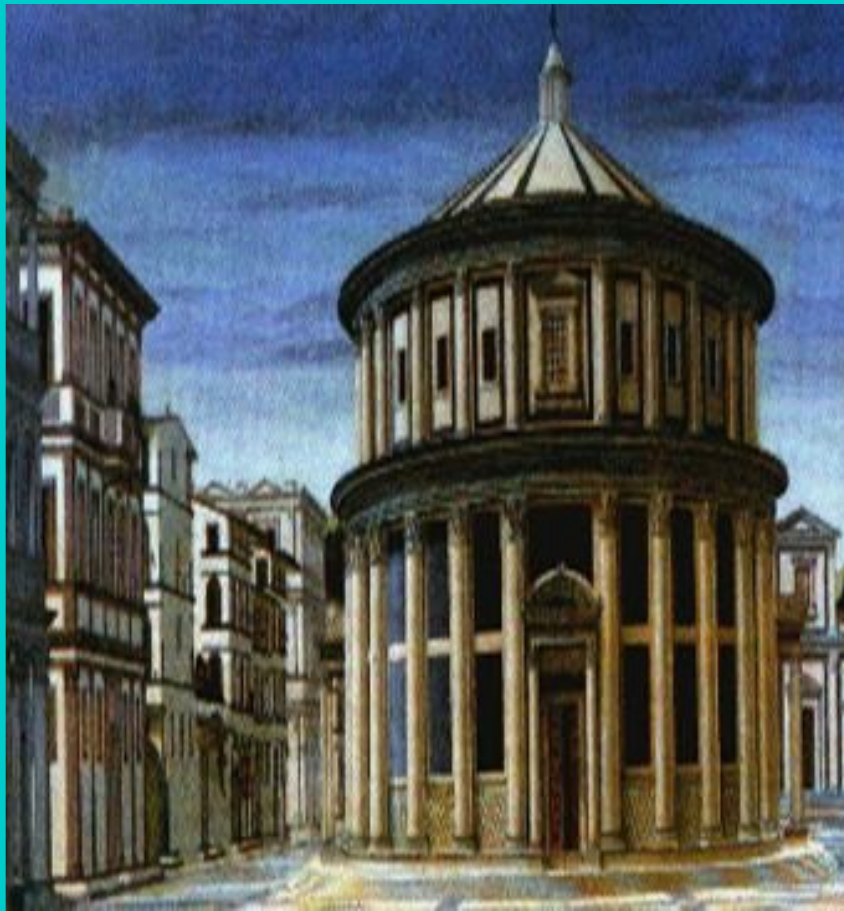
Банк Медичи в Милане. Рисунок со средневековой гравюры.

Огромный интерес гуманисты проявляли к античности, считая древнегреческую культуру идеалом.