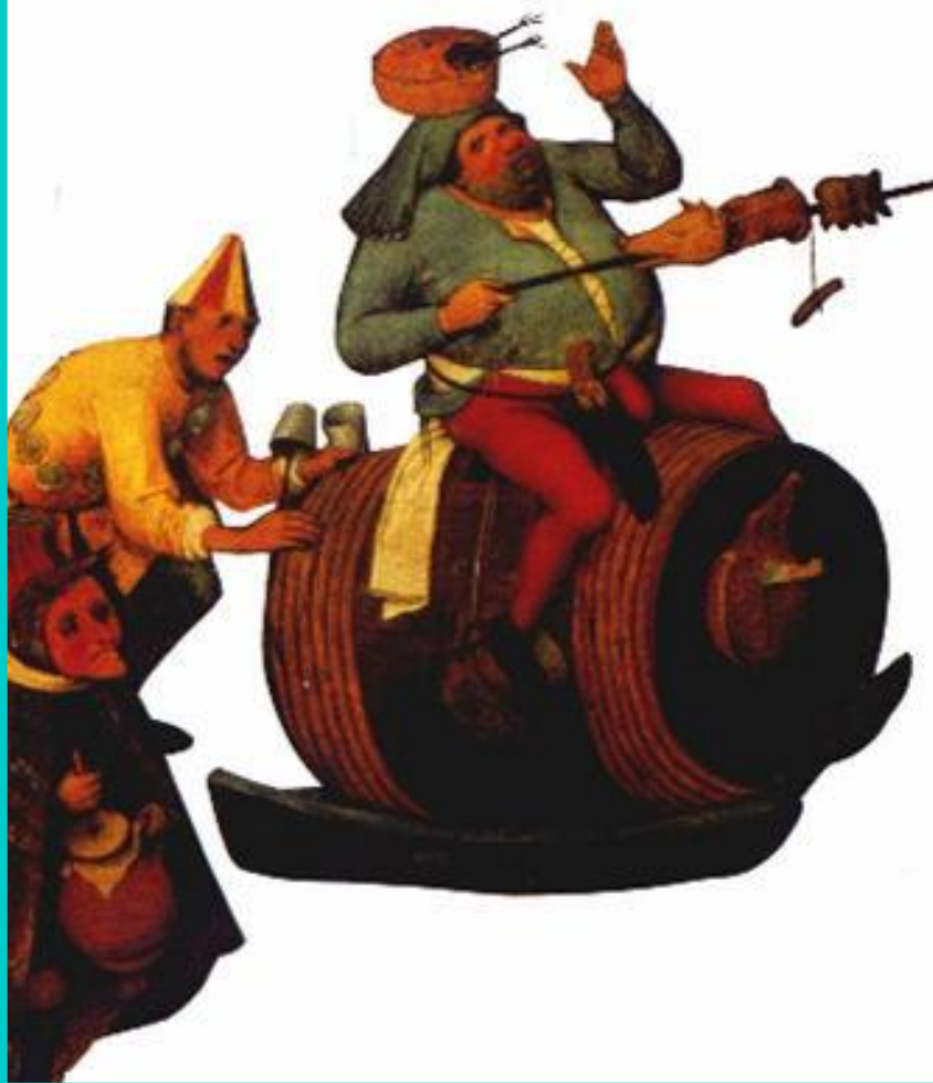
Карикатура на монахов. Рисунок со средневековой гравюры.

Гуманисты выступали с резкой критикой церкви и феодалов, осуждали сословное деление общества.