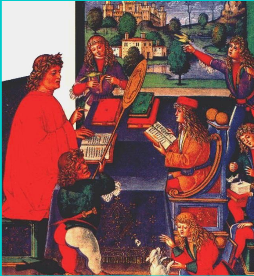
Иллюстрация к «Декамерону». Средневековая миниатюра.

Другим основоположником Возрождения стал Джованни Боккачо. Он написал сборник новел «Декамерон».