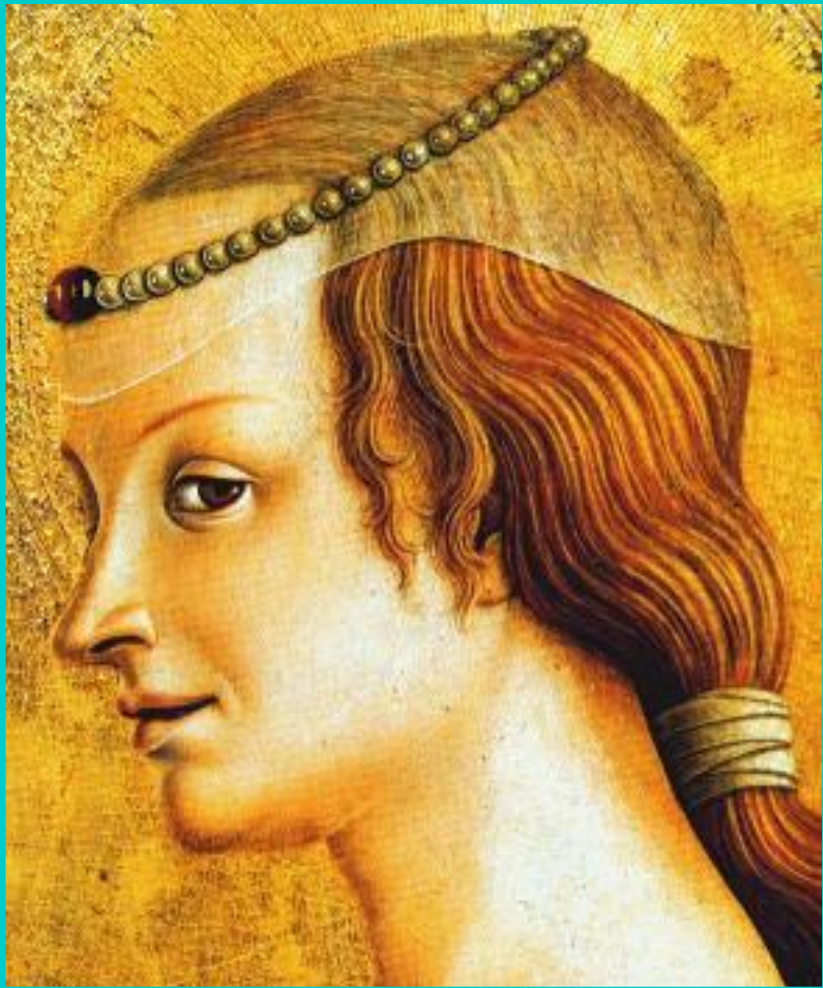
Фра Джованни да Верона. Портрет незнакомки.

Новая культура огромное внимание уделяла человеку, проявляла интерес к жизни и природе.