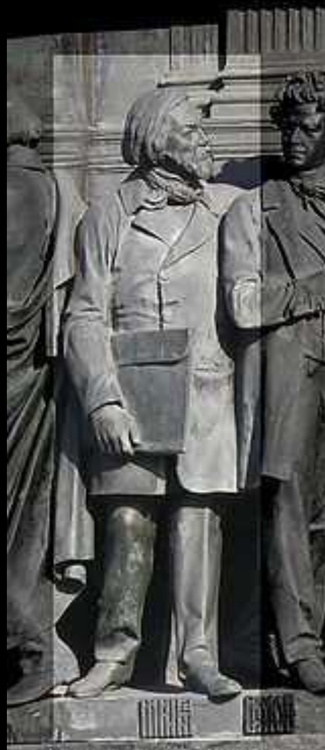
М. И. Глинка на Памятнике «1000-летие России» в Великом Новгороде

В 1802 г. в России создается Филармоническое общество. В его залах выступали с концертами знаменитые музыканты, среди которых Ф. Лист, Г. Берлиоз, П. Виардо. В сезон общество давало несколько больших концертов, знакомило публику с новинками, именно здесь впервые в России прозвучали произведения Генделя, Гайдна, Моцарта, Бетховена. Основателем русской школы в музыке стал М.И. Глинка. «Жизнь за царя», «Руслан и Людмила» положили начало двум направлениям русского оперного искусства — народной музыкальной драме и опере-сказке.