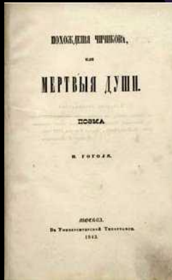
Титульная страница первого издания

Вершиной творчества Н.В. Гоголя стала поэма «Мертвые души». Сюжет «Мертвых душ», как и «Ревизора», был подсказан Гоголю Пушкиным. Это эпическое произведение Николай Васильевич закончил в 1840 году, но лишь спустя два года удалось его напечатать. Цензурный комитет дал такое разрешение лишь с условием внесения значительных поправок.