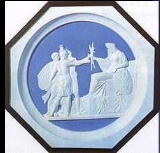
Ф. П. Толстой. Народное ополчение 1812 года. 1816. Медальон. Воск