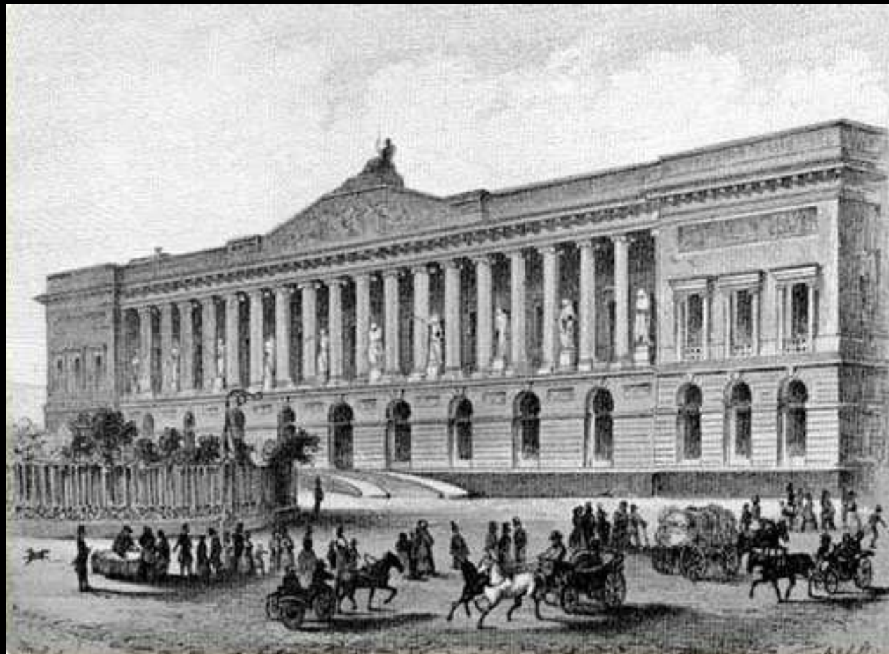
Здание Императорской Публичной библиотеки. Гравюра начала 19 века

В 1810 г. была основана крупнейшая императорская Публичная библиотека в Петербурге, причем русский отдел комплектовал её глава И. А. Крылов.