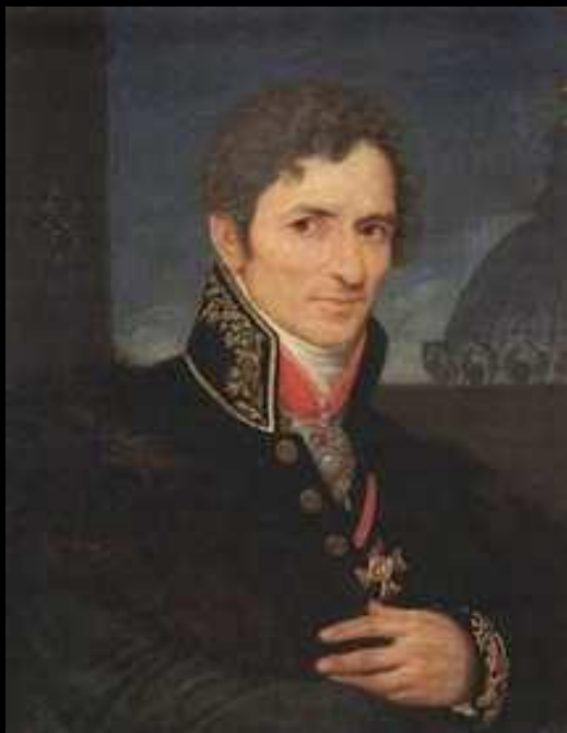
Автор проекта А. Н. Воронихин

Непростую задачу должен был решить архитектор, которому, по замыслу Павла I, предстояло возвести новый храм — Казанский собор . Император желал, чтобы этот храм напоминал собор святого Петра в Риме, величайший собор католического мира. Спустя годы Казанский собор стал мемориалом Отечественной войны 1812-го года. Его иконостас был отделан серебром, которое казаки отбили у французов, пытавшихся увезти сокровища из России, здесь же поместили военные трофеи — знамена и штандарты, ключи от крепостей. В пределах собора похоронили М.И. Кутузова.