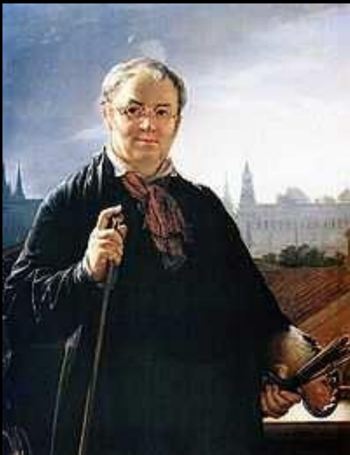
Автопортрет с кистями и палитрой на фоне окна с видом на Кремль (1844)

Образы простых людей привлекали художника В.А. Тропинина, который до 47 лет находился в крепостной зависимости. Тропининские портреты отличало особое идиллическое мировидение, их герои бесконфликтны и гармоничны.