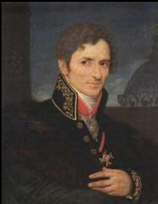
Автор проекта А. Н. Воронихин

Непростую задачу должен был решить архитектор, которому, по замыслу Павла I, предстояло возвести новый храм — Казанский собор . Император желал, чтобы этот храм напоминал собор святого Петра в Риме, величайший собор католического мира. Спустя годы Казанский собор стал мемориалом Отечественной войны 1812-го года. Его иконостас был отделан серебром, которое казаки отбили у французов, пытавшихся увезти сокровища из России, здесь же поместили военные трофеи — знамена и штандарты, ключи от крепостей. В пределах собора похоронили М.И. Кутузова.