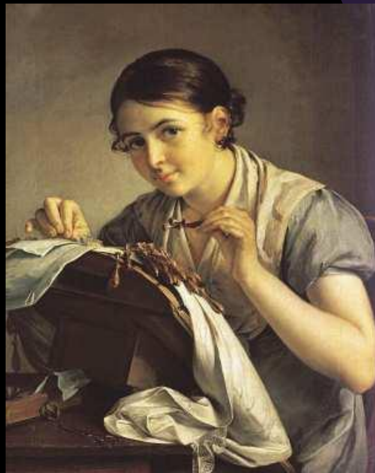
"Кружевница" 1823 (Третьяковская галерея, Москва)