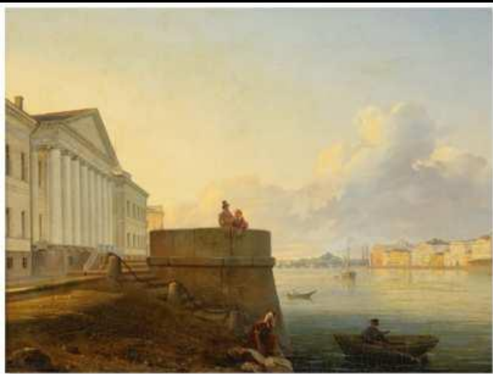
Академия наук . Первая половина XIX века

Число грамотных людей в первой половине XIX века в Российской империи было ничтожным. Развитие книжного дела замедлялось и тем, что читающая часть общества предпочитала книги на иностранных языках, прежде всего на французском. В 1801 году Александр I, взойдя на престол, отменил запрет на ввоз иностранных книг, а в 1802 году — предварительную цензуру и дал разрешение на открытие частных типографий. Крупнейшими книгоиздателями являлись Академия наук и Московский университет. Университетские воспитанники, профессора и «любители наук» нередко завещали свои библиотеки университету. Так в университетской библиотеке появились богатые книжные собрания М.Н. Муравьева Т.Н. Грановского, собрание гравюр Ф.Ф. Вигеля.