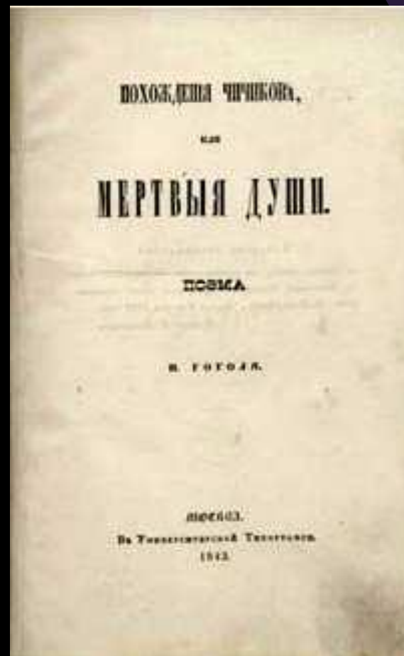
Титульная страница первого издания

Вершиной творчества Н.В. Гоголя стала поэма «Мертвые души». Сюжет «Мертвых душ», как и «Ревизора», был подсказан Гоголю Пушкиным. Это эпическое произведение Николай Васильевич закончил в 1840 году, но лишь спустя два года удалось его напечатать. Цензурный комитет дал такое разрешение лишь с условием внесения значительных поправок.