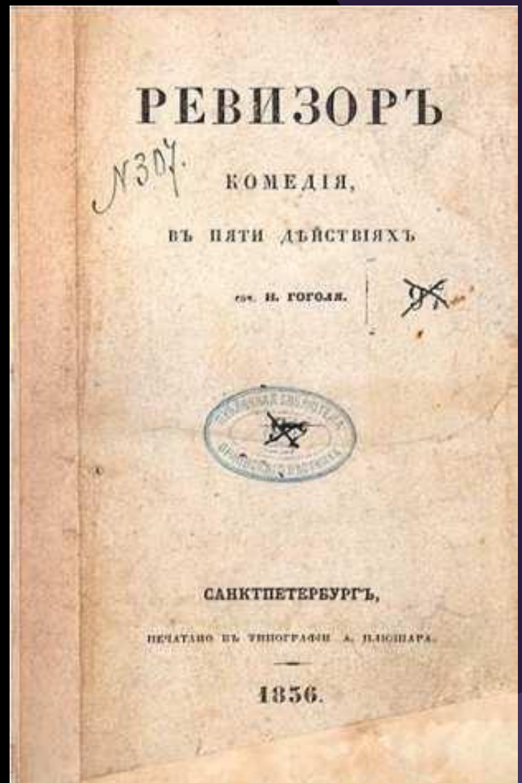
Обложка первого издания «Ревизора»

Высшее общество восприняло «Ревизор» как грубую карикатуру, как злую насмешку над русской провинцией.