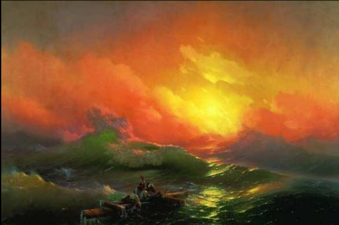
«Девятый вал» Ивана Айвазовского

В начале XIX века в изобразительном искусстве появляются романтические произведения. В природе живописцев-романтиков привлекало буйство стихии, как например, в картине «Девятый вал» Ивана Айвазовского или «Пейзаж с грозой» Ореста Кипренского. В человеке «романтиков» интересовали прежде всего сложность его душевного мира, характер, темперамент.