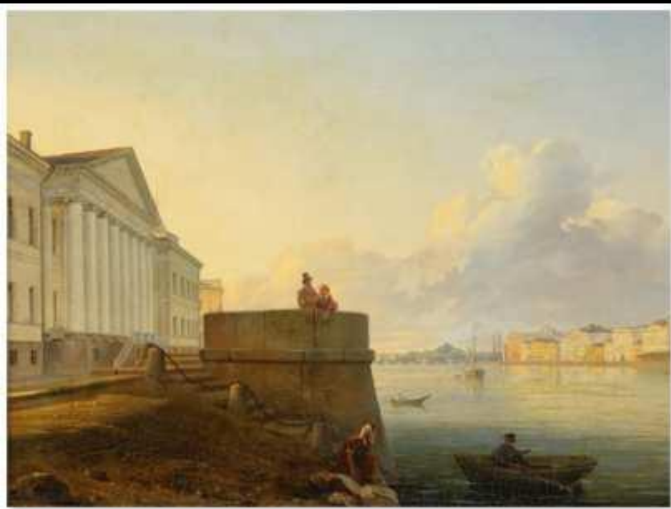
Академия наук . Первая половина XIX века

Число грамотных людей в первой половине XIX века в Российской империи было ничтожным. Развитие книжного дела замедлялось и тем, что читающая часть общества предпочитала книги на иностранных языках, прежде всего на французском. В 1801 году Александр I, взойдя на престол, отменил запрет на ввоз иностранных книг, а в 1802 году — предварительную цензуру и дал разрешение на открытие частных типографий. Крупнейшими книгоиздателями являлись Академия наук и Московский университет. Университетские воспитанники, профессора и «любители наук» нередко завещали свои библиотеки университету. Так в университетской библиотеке появились богатые книжные собрания М.Н. Муравьева Т.Н. Грановского, собрание гравюр Ф.Ф. Вигеля.