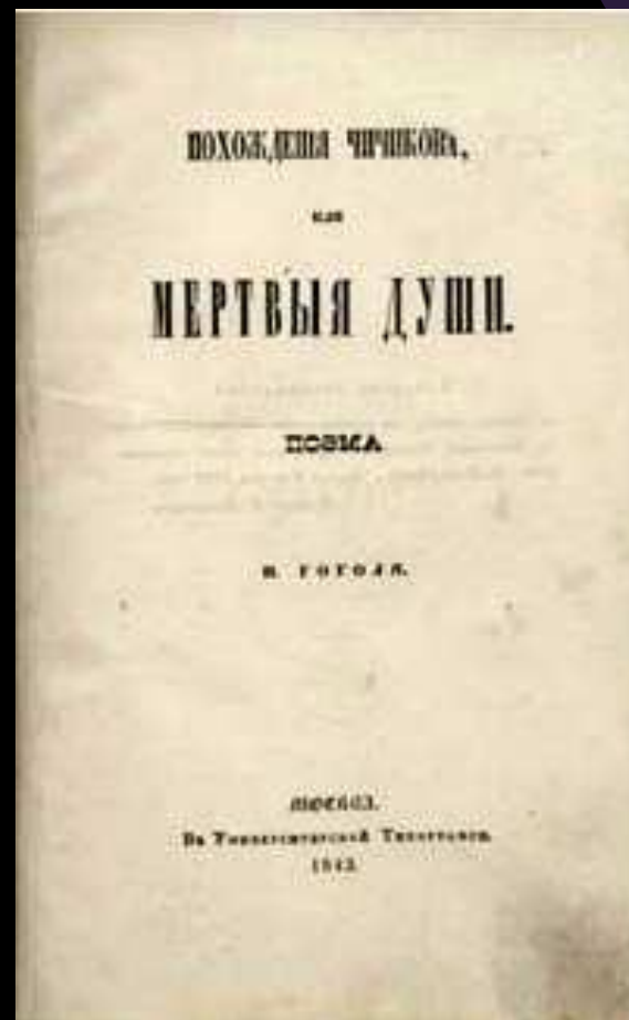
Титульная страница первого издания

Вершиной творчества Н.В. Гоголя стала поэма «Мертвые души». Сюжет «Мертвых душ», как и «Ревизора», был подсказан Гоголю Пушкиным. Это эпическое произведение Николай Васильевич закончил в 1840 году, но лишь спустя два года удалось его напечатать. Цензурный комитет дал такое разрешение лишь с условием внесения значительных поправок.