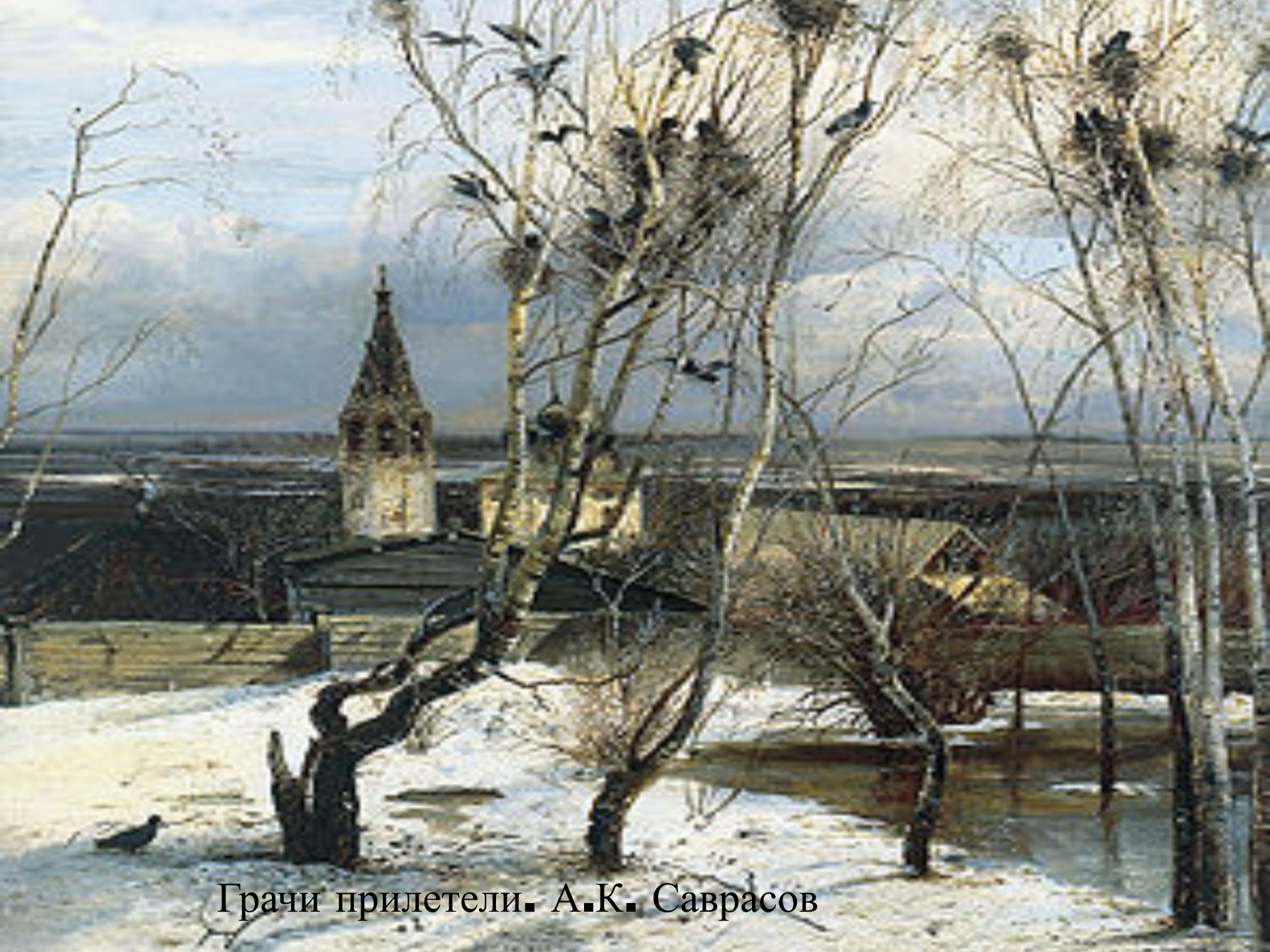
Грачи прилетели. А.К. Саврасов