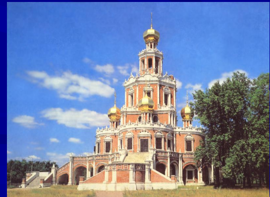
Церковь Покрова в Филях