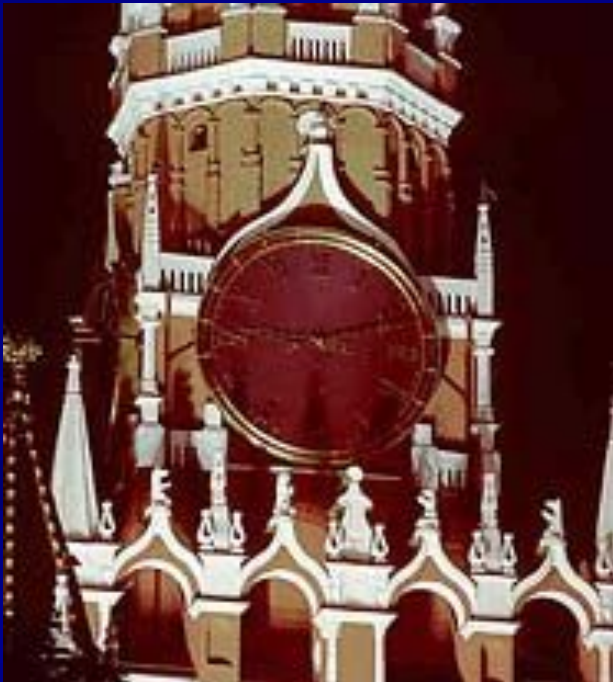
Куранты на Спасской башне Московского Кремля.