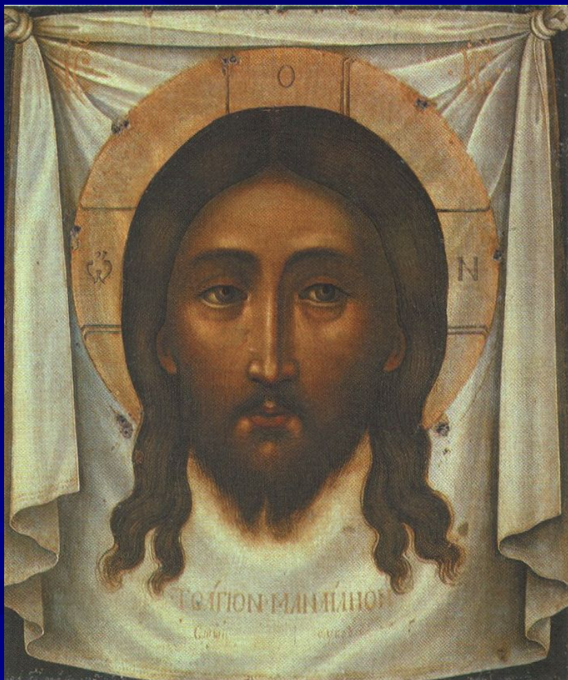
Симон Ушаков. Спас нерукотворный