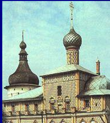
Ростов Великий. Церковь Одигитрии. 1698 год.