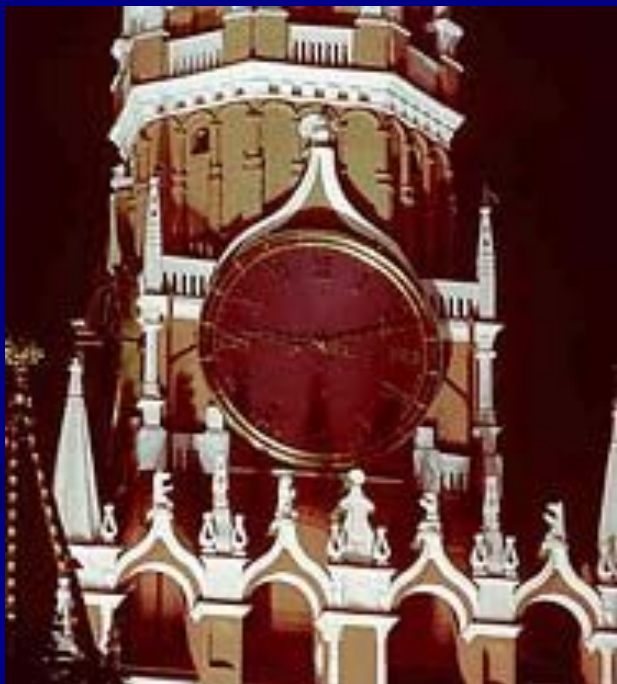
Куранты на Спасской башне Московского Кремля.